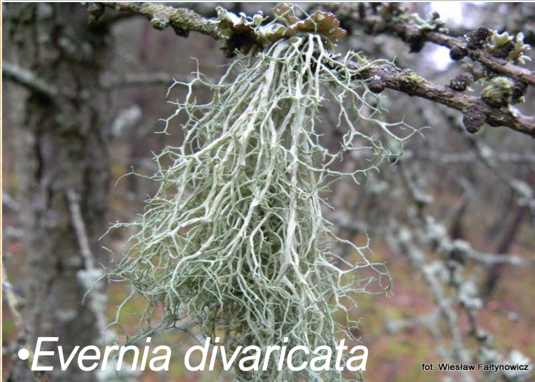
• Evernia divaricata