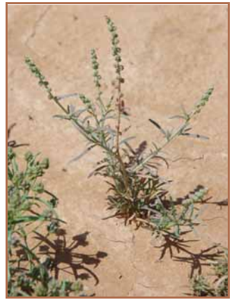
Espèce voisine : Oligomeris linifolia . Touffe en fructification.