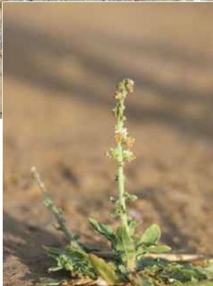
Jeune repousse érigée, en début de floraison.