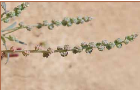
Espèce voisine : Oligomeris linifolia . Infrutescence.