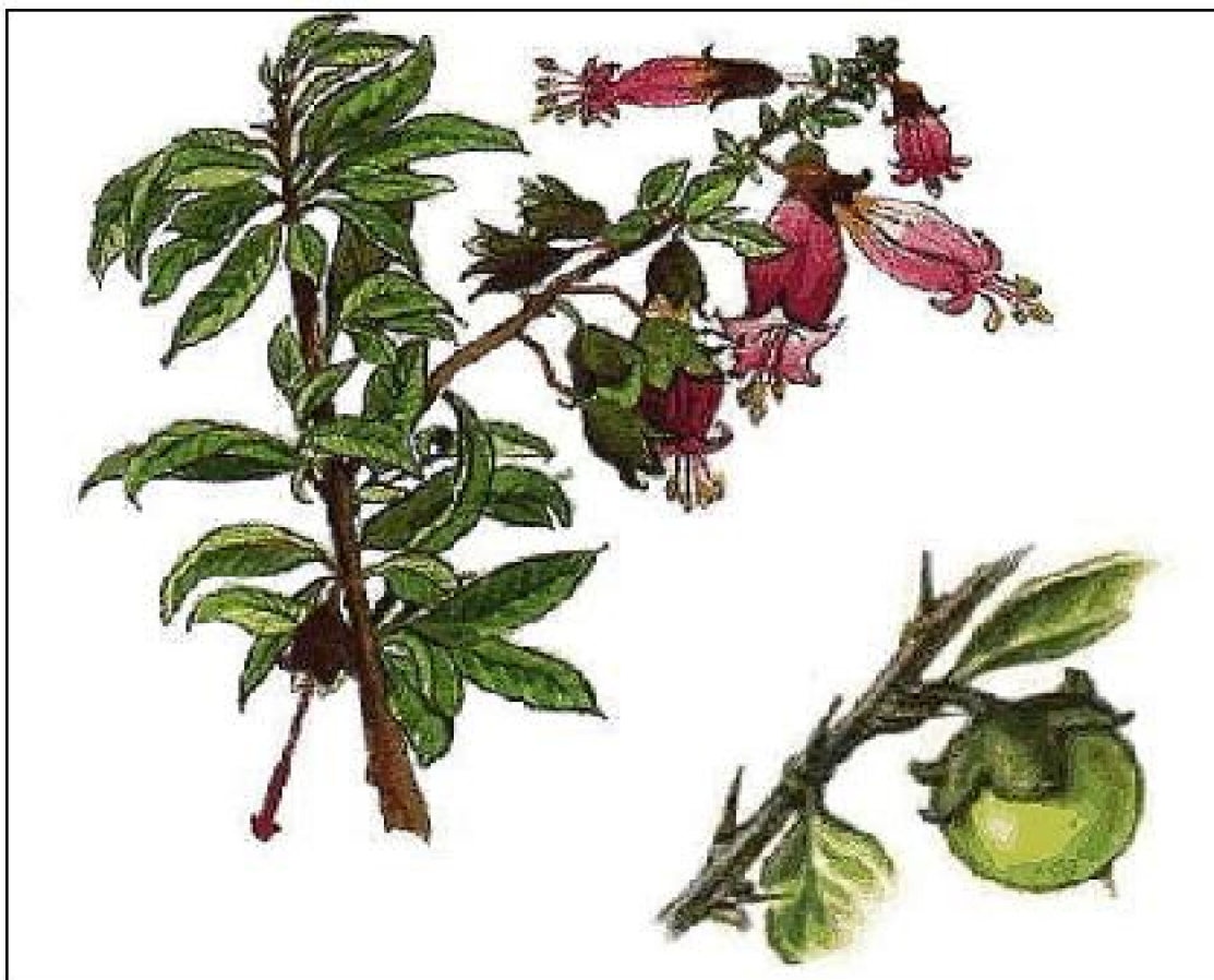
FIGURA 2. Latua pubiflora Griseb

Nombre vulgar: Latúe, latué, palo de los brujos