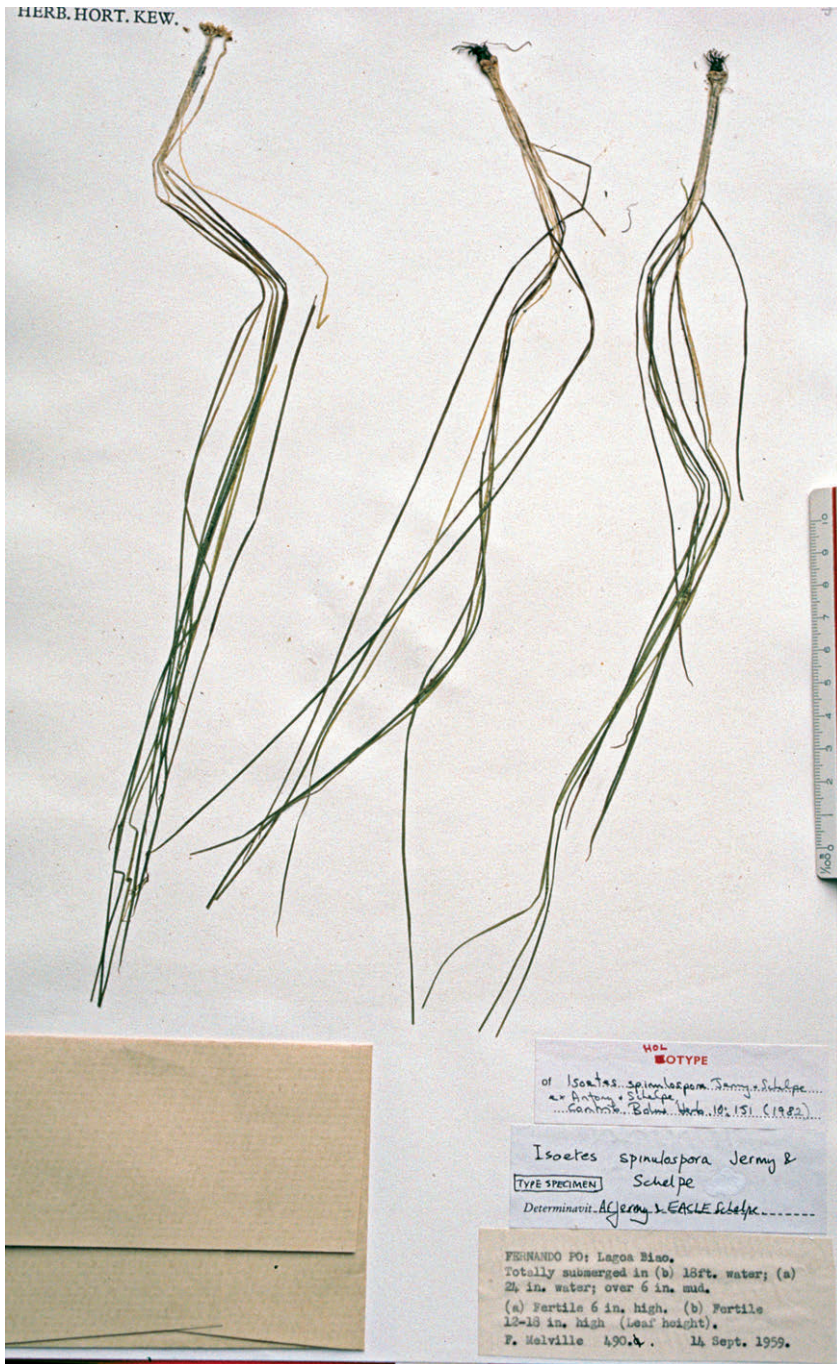
Fig. 3. Isoetes spinulospora