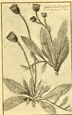
Hieracium Kneuckerianum nov. spec. hybr.

H. Kneuckerianum steht zwischen H. Zizianum und H. Pilosella und zwar letzterem am nächsten; es ist als ein Bastard der typischen Subspezies Zizianum mit H. Pilosella zu betrachten. Im Habitus gleicht derselbe einigen mehr oder weniger tiefgabeligen und armköpfigen Unterarten von H. brachiatum Bert. Nägeli und Peter führen in ihrer Monographie der Piloselloiden p. 726 ff. bereits zwei Spezies auf, welche zwischen H. Zizianum und H. Pilosella stehen, nämlich H. albipedunculum Ny. P. = Zizianum > Pilosella und H. Heuffelii Janka = Zizianum — Pilosella , erwähnen aber kein Zizianum < Pilosella , welches ohne Zweifel durch die beschriebene Pflanze von Deidesheim dargestellt wird. H. Kneuckerianum unterscheidet sich der Hauptsache nach von H. albipedunculum und von H. Heuffelii *) wie H. brachiatum von H. venetianum und H. adriaticum Ny. P., nämlich durch Anwesenheit von Stolonen. Ausserdem deuten die kugelligen Köpfe, die breitlichen Hülschuppen und die starke Rotstreifung der Randblüten in weit höherem Grade auf die Einwirkung von H. Pilosella hin, als es bei H. albipedunculum und H. Heuffelii der Fall ist.