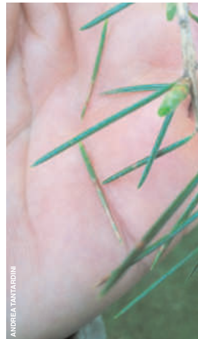
Gli aghi mostrano bande decolorate e cadono precocemente. È visibile l'emissione di nuovi germogli. The needles have discoloured bands and fall early. New buds can be seen.

Il ciclo biologico di L. cedrinum su un nuovo ospite inizia con l'infezione degli aghi neoformati a metà o nella tarda estate. Le spore vengono rilasciate dai