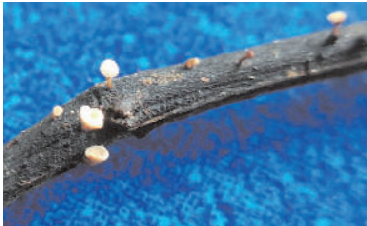
Da sinistra, necrosi fogliari da Hymenoscyphus fraxineus e corpi fruttiferi del patogeno su frassino. From left, necrosis of ash leaves caused by Hymenoscyphus fraxineus and the pathogen's fruit bodies on wood debris.

mentale situati in ambito parco. Si tratta inoltre della più occidentale tra le segnalazioni, il che comporta che virtualmente l'invasione, a partire dal Friuli Venezia Giulia e con direttrice Est-Ovest lungo la dorsale alpina e i rilievi delle Prealpi, interessi ormai l'intero Nord Italia. L'invasione sarebbe avvenuta a una velocità stimabile, suddividendo la distanza percorsa per il tempo trascorso dal 2009 al 2016, in non meno di 70 km/anno. Non è però escluso che l'invasione abbia avuto luogo a una velocità ancora maggiore, poiché i sintomi tipici della malattia furono osservati nel Parco La Mandria a partire dal 2014, oppure che il fungo sia giunto in Italia nordoccidentale a partire dal Canton Ticino in Svizzera, dove la malattia è presente dal 2013 (4) . La segnalazione ha infine rilevanza per i