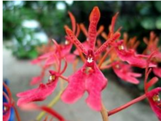
Renanthera coccinea