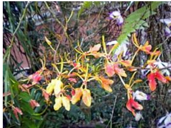
Renanthera vietnamensis

Như vậy cây Renanthera annamensis là cây nào? Hoa và màu hoa (theo Rolfe và Curtis) giống như cây Renanthera citrina . Thân dài (theo lời mô tả của Phạm Hoàng Hộ và Trần Hợp) và lá (hình của Curtis) lại giống như Renanthera coccinea . Vậy thì cây này có thực hay không? Hay chỉ là một sự nhầm lẫn nào đó? Từ năm 1907 đến nay tức là 104 năm qua, chưa có ai trông thấy tận mắt cây lan cả, hay là nó đã tuyệt tích khỏi rừng núi Lâm Đồng, Đà Lạt?