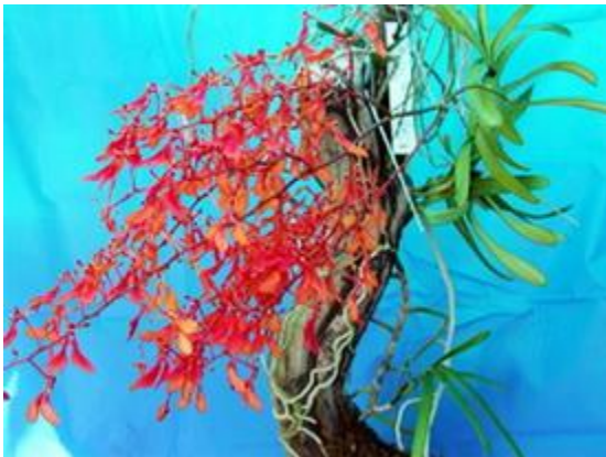
Renanthera imschootiana