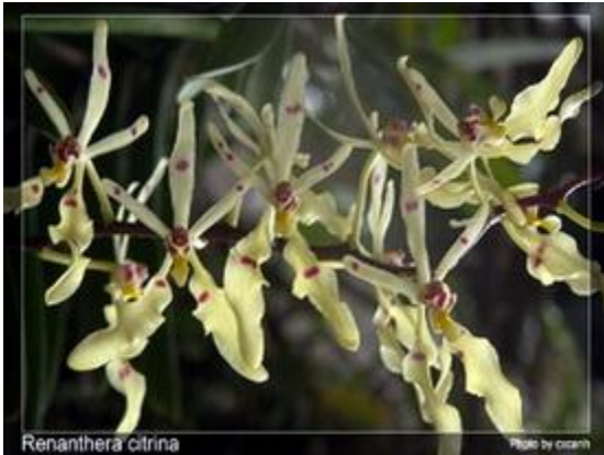
Renanthera citrina