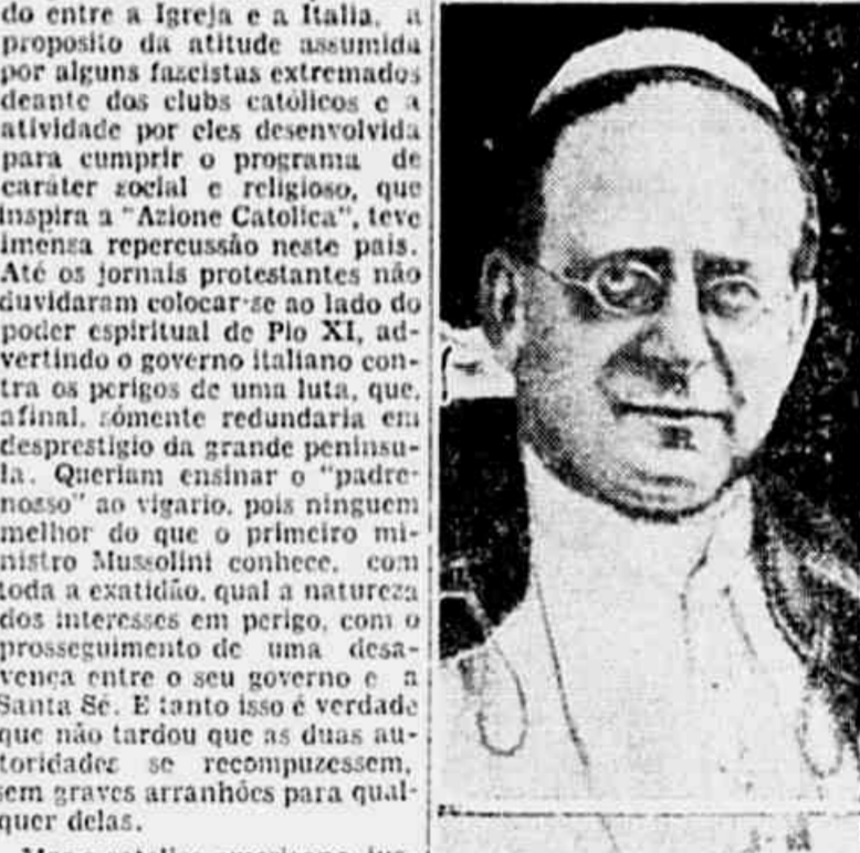
O papa Pio XI, autor das duas ultimas enciclicas

NOVA YORK, 7 (Austregesilio de Athayde, enviado especial dos "Diarios Associados" — Pelo telegrafo) — O conflito provocado entre a Igreja e a Italia, a proposito da attitude assumida por alguns fazistas extremados deante dos clubs catolicos e a atividade por eles desenvolvida para cumprir o programa de caráter social e religioso, que inspira a "Azione Catolica", teve imensa repercussão neste pais.