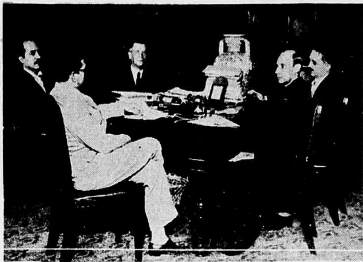
O Conselho reunido, hoje, à tarde, no Ministerio da Educação.

A reunião dos sábios no Ministerio da Educação — O representante gaúcho quer pôr o Brasil um primor, no prazo de dez annos, com a dotação de cem mil contos de réis anuais! — O ministro jornalista