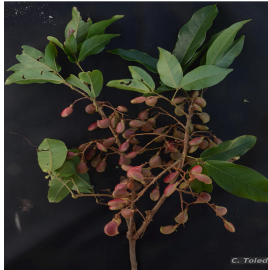
Figura 1: Conarus rostratus (Vell.) L.B.Sm.