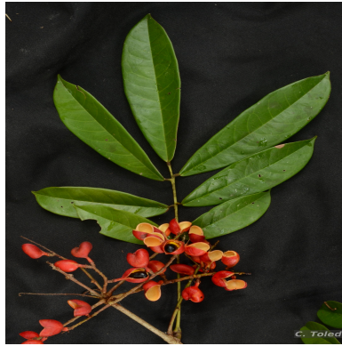
Figura 1: Connarus punctatus Planch.