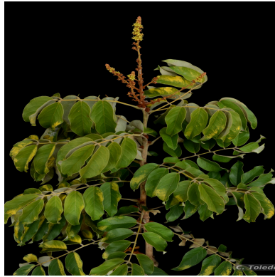
Figura 1: Connarus suberosus Planch.