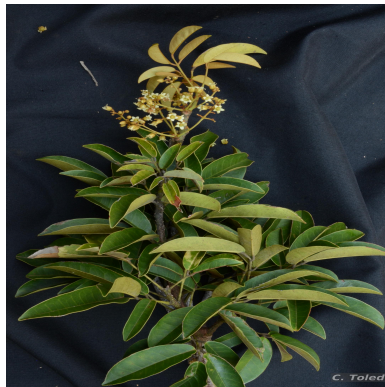
Figura 2: Connarus beyrichii Planch.