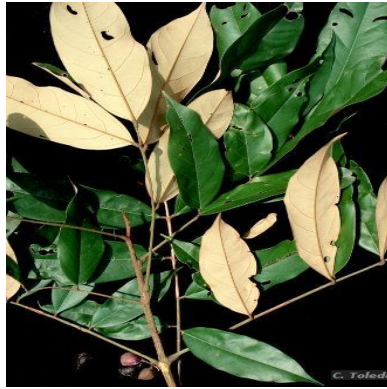
Figura 1: Connarus angustifolius (Radlk.) G.Schellenb.