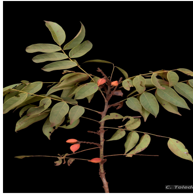
Figura 1: Connarus erianthus Benth. ex Baker