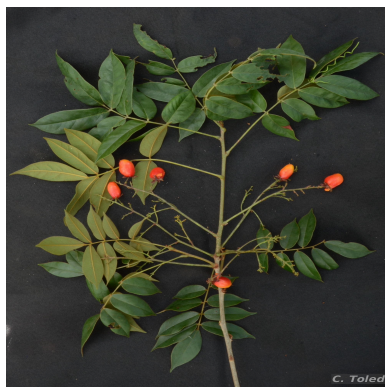
Figura 1: Bernardinia fluminensis (Gardner) Planch.