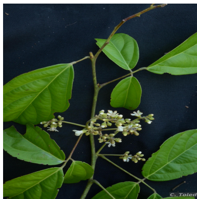
Figura 1: Rourea camptoneura Radlk.