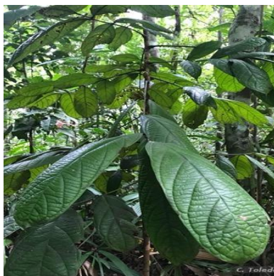
Figura 1: Connarus fasciculatus subsp. pachyneurus (Radlk.) Forero