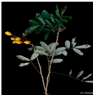
Figura 1: Connarus aureus C. Toledo