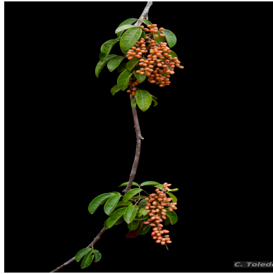
Figura 1: Connarus blanchetii Planch.