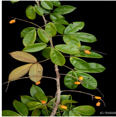
Figura 1: Connarus favosus Planch.