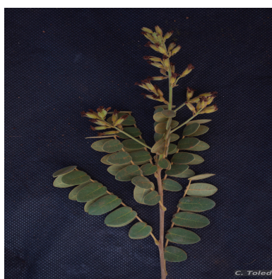
Figura 1: Rourea chrysomalla Glaz. ex G.Schellenb.