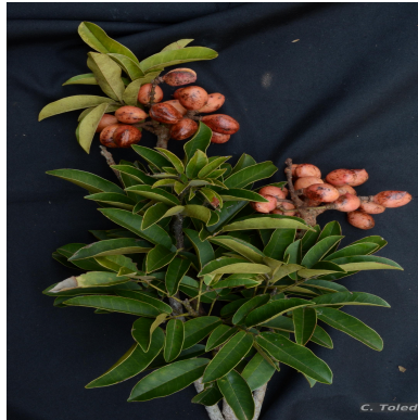
Figura 1: Connarus beyrichii Planch.