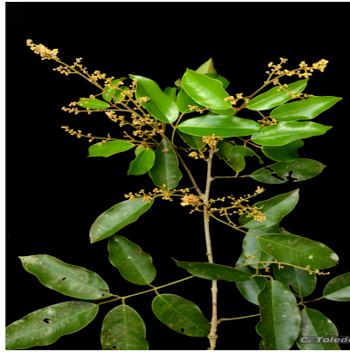
Figura 1: Connarus nodosus Baker