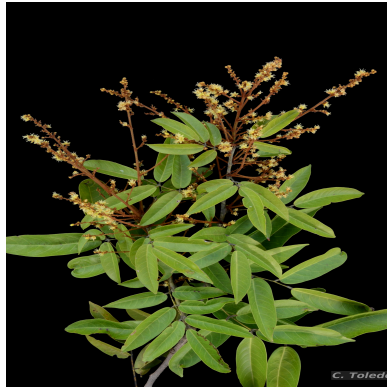
Figura 1: Connarus incomptus Planch.