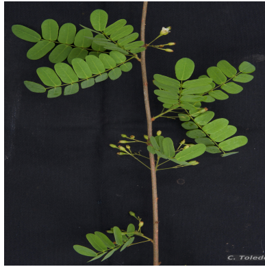
Figura 1: Rourea bahiensis Forero