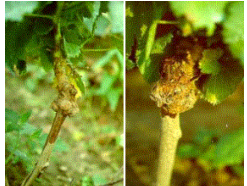
Fig 1 - Esempi di "Testa grossa".

Contro A. tumefaciens può essere utilizzato il ceppo K84 di A. radiobacter antagonista naturale produttore di agrocina 84, inibente di A. tumefaciens