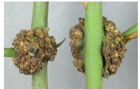
Fig 1- "Testa grossa" examples.