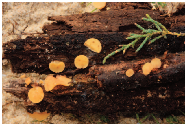
Fig. 1. Hymenoscyphus tamaricis.

Durante nuestro trabajo de campo para completar el catálogo provincial de hongos, que se han centrado especialmente en el Espacio natural Doñana y los parques naturales Los Alcornocales y Sierra de Grazalema, localizamos dos nuevas localidades de hongos amenazadas; en concreto de Hymenoscyphus tamaricis (fig. 1) y Marasmius hudsonii (fig. 2) especie esta última no citada con anterioridad para la provincia. Lo cual contribuye a conocer aún mejor la distribución de estas especies en Andalucía.