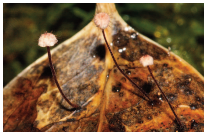
Fig. 3. Marasmius hudsonii sobre hojas de acebo (Foto: Manuel Becerra).

Especie de la que hasta ahora sólo se conocía su presencia en Andalucía dentro del Parque Natural Sierras de Cazorla, Segura y las Villas (Moreno- Arroyo 2004) (fig. 4). No tenemos constancia de citas anteriores para la provincia de Cádiz, aunque seguramente sea localmente abundante en aquellas zonas de Los Alcornocales donde está presente el acebo.