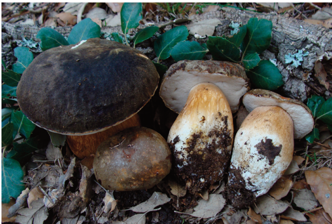
Figura 43. Boletus aereus

CÁDIZ: El Bosque, El Castillejo, 30STF7771, quejigal basófilo, 300 m, AH 43945 (Becerra y Robles 2012 sub Boletus poikilochromus Pöder, Cetto & Zuccherelli).