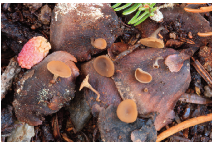
Figura 9. Ciboria rufofusca