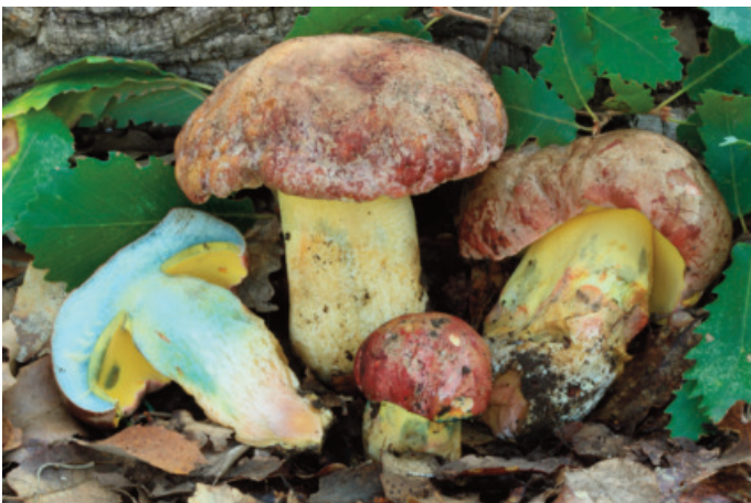
Figura 45. Butyriboletus pseudoregius