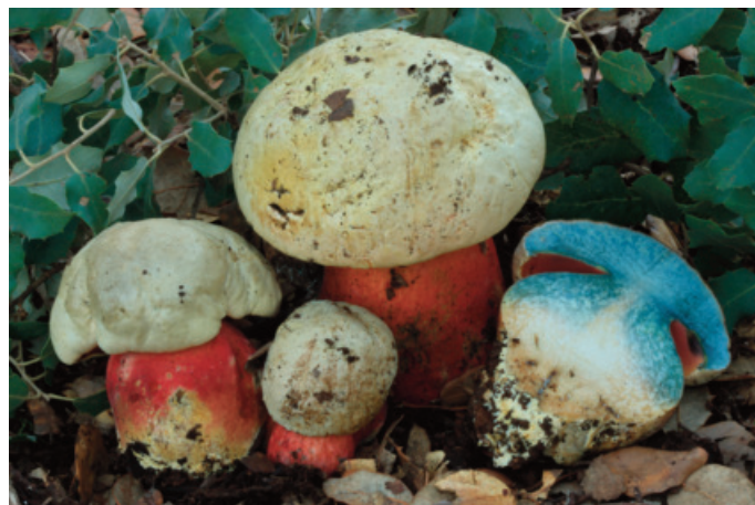
Figura 57. Rubroboletus satanas

* Suillus mediterraneensis (Jacquet. J. Blum.) Redeuilh. CÁDIZ: El Bosque, cerro del Albarracín, 30STF7792, pinar de Pinus halepensis , terreno calizo, 25-X-2015, JA-CUSSTA 8526 (Becerra y Robles 2016) (figura 59).