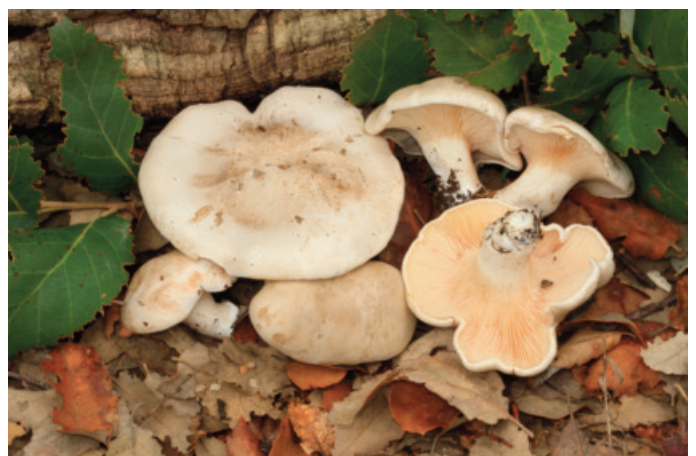
Figura 36. Clitopilus cystidiatus

Observaciones: novedad para el Parque Natural Sierra de Grazalema (Moreno-Arroyo 2004).