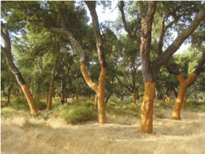
Figura 3. Alcornocal en El Cupil (Ronda)

Berthel), la escorodonia ( Teucrium scorodonia L.) y los jaguarzos ( Cistus salvifolius L.). En el extremo sur, ya en los límites con el Parque Natural Los Alcornocales, aparecen otros taxones más propios de las sierras aljibicas, como la quejiguetta ( Quercus lusitanica Lam.).