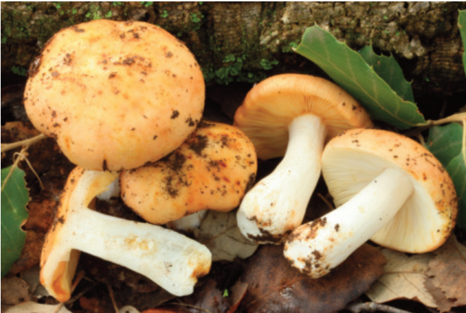
Figura 77. Russula straminea