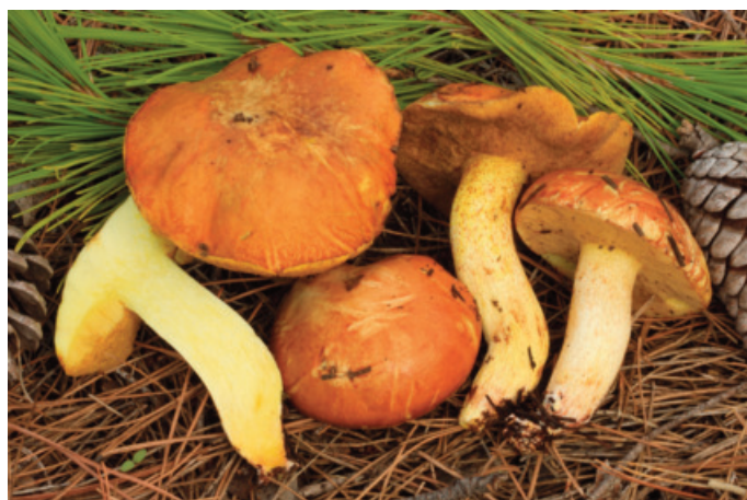
Figura 59. Suillus mediterraneensis

Suillus variegatus (Sw.) Richon & Roze CÁDIZ: El Bosque, Río Majaceite, 30STF7772 (Castro 2018). Observaciones: nos resulta muy extraña esta cita, pues este taxón en el sur de la Península crece exclusivamente en pinares de Pinus nigra subsp. salzmanii de alta montaña de la provincia de Jaén (Moreno-Arroyo 2004).