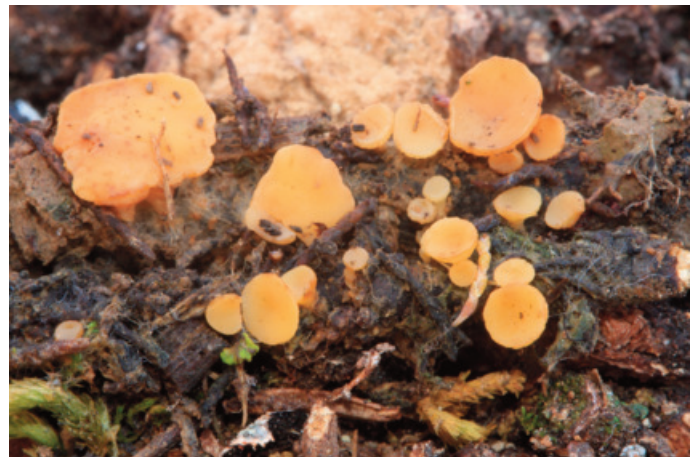
Figura 8. Hymenoscyphus tamaricis