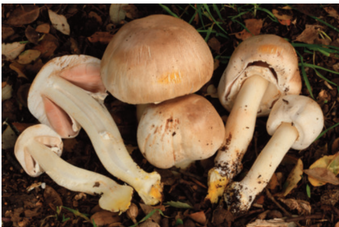
Figura 23. Agaricus xanthodermus

Cystoderma serrulatum (Pers.) Hesler CÁDIZ: Grazalema, Benamahoma, llanos del Laurel, 30STF8170 (Castro 2018); Grazalema, puerto de los Alamillos, 30STF9070 (Castro 2018).