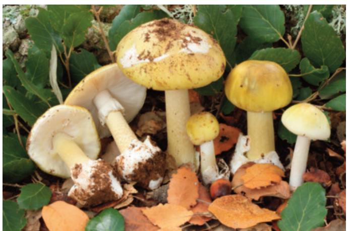
Figura 34. Amanita phalloides