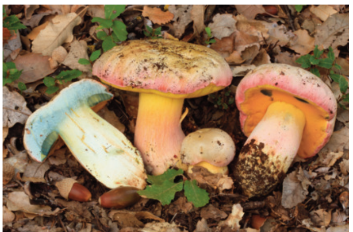
Figura 56. Rubroboletus pulchrotinctus