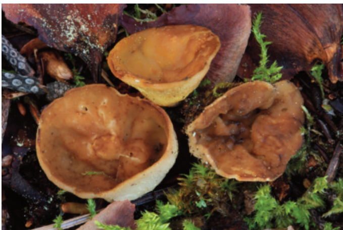
Figura 11. Gyromitra melaleuca

MÁLAGA: Ronda, arroyo del Cupil, 30SUF0072, bosque de ribera con Fraxinus angustifolia , Populus nigra y Equisetum