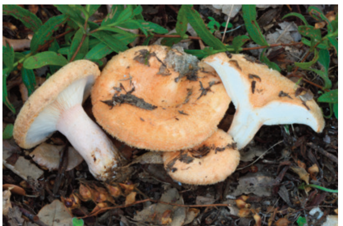
Figura 64. Lactarius tesquorum