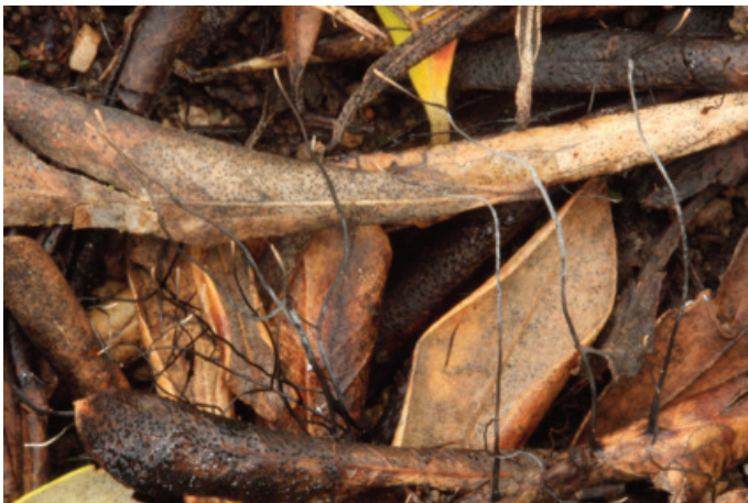
Figura 7. Xylaria sicula

CADIZ: Grazalema, puerto del Pinar, 30STF8372 (Moreno-Arroyo 2004).