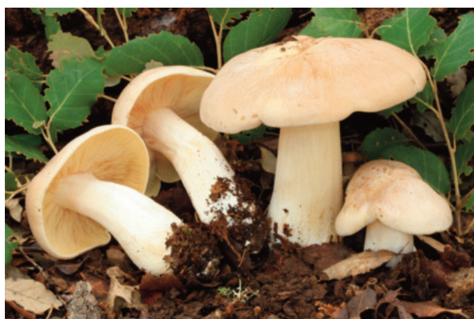
Figura 37. Entoloma sinuatum

CÁDIZ: Grazalema, llanos del Rabel, 30STF8474 (Castro 2018).