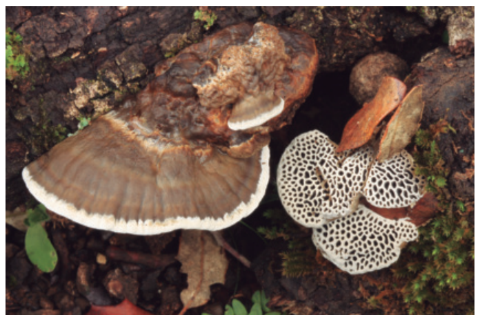
Figura 20. Daedaleopsis nitida

CÁDIZ: Grazalema, carretera a Ronda, El Higuierón, 30STF9371 (Moreno et al. 2007).