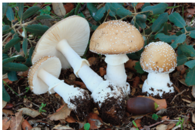
Figura 33. Amanita pantherina

Benamahoma, llanos del Campo, 30STF8170 (Castro 2018); finca El Higuern, 30STF9170 (Castro 2018).