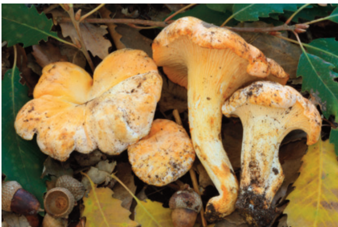
Figura 19. Cantharellus subpruinus

MÁLAGA: [Ronda], arroyo del Cupil, 30SUF0271 (Castro 2018).