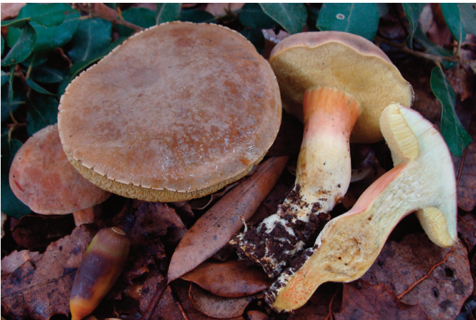
Figura 51. Hortiboletus engelii

CÁDIZ: Grazalema, llanos del Campo, 30STF8070, encinar basófilo, 650 m, 17-X-2015, ARB201501 (Becerra y Robles 2016) (figura 58).