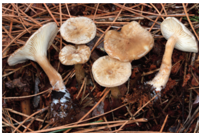
Figura 41. Infundibulicybe meridionalis