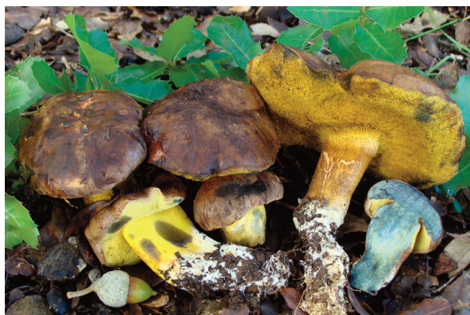
Figura 49. Cyanoboletus pulverulentus

Neoboletus xanthopus (Klofac & A. Urb.) Klofac & A. Urb. CÁDIZ: Grazalema, carretera Grazalema-Ronda, 30STF9271 (Moreno-Arroyo 2004 sub Boletus erythropus Pers.). MÁLAGA: Montejaque, Los Cucaderos, 30STF9570, ARB201408. Ronda, El Cupil, 30STF9971, ARB201407 (figura 53).