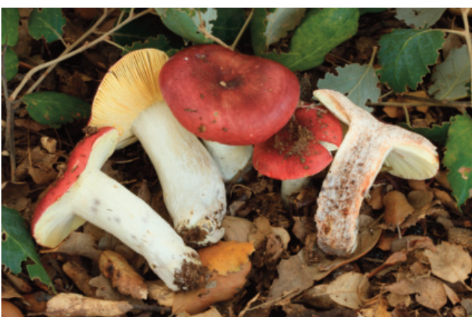
Figura 75. Russula seperina