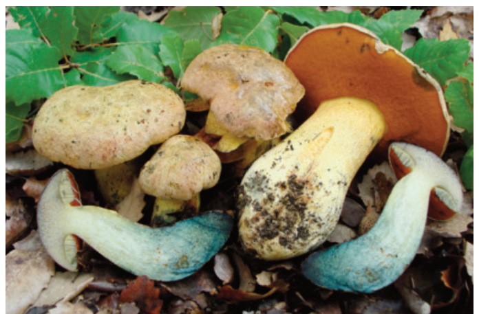
Figura 58. Suillellus comptus

* Xerocomellus redeuilhii A.F.S. Taylor, U. Eberh., Simonini, Gelardi & Vizzini CÁDIZ: El Bosque, El Castillejo, 30STF7771, encinar-quejigal basófilo, 360 m, 14-X-2015, ARB201525. MÁLAGA: Benaoján, La Dehesa, 30STF9965, encinar basófilo, 10-X-2015, JA-CUSSTA 8522 (Becerra y Robles 2016 sub Xerocomellus dryophilus (Thiers.) N. Siegel, C.F. Schwarz & J.L. Frank) (figura 60). Observaciones: novedad para la provincia de Cádiz (Moreno- Arroyo 2004).