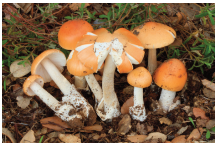
Figura 29. Amanita crocea