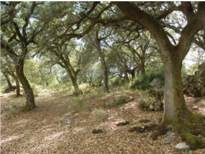
Figura 2. Encinar en los alrededores de Benaoján

Así en zonas bajas, hasta unos 600-800 m o incluso los 1.000 en las solanas, se desarrollan los encinares termomediterráneos ( Smilaci mauritanicae-Quercetum rotundifoliae ). Se caracteriza por la presencia, como especies acompañantes, de acebuches ( Olea europaea var. sylvestris (Mill.) Lehr), algarrobos ( Ceratonia siliqua L.), cornicabras ( Pistacia terebinthus L.), palmitos ( Chamaerops humilis L.), retamas ( Retama sphaerocarpa (L.) Boiss.), escobones ( Cytisus arboreus subsp. baeticus (Webb.) Maire), madroños ( Arbutus unedo L.) y especies lianoides como la zarzaparrila ( Smilax aspera L.) y Aristolochia baetica L. En vaguadas, fondos de valle o terrenos con una alta humedad ambiental suelen aparecer pies sueltos de quejigos ( Quercus faginea Lam.), que en localidades favorables llegan a formar pequeños rodales o formaciones monoespecíficas. Es el caso de los llanos del Espino en El Bosque, las caídas de la Sierra del Pinar, La Dehesa de Benaoján o El Cupil, en Ronda (Aparicio y Silvestre 1996).