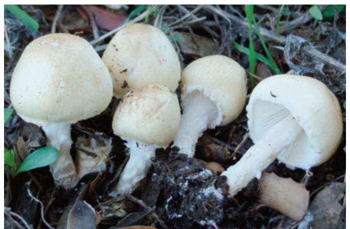
Figura 24. Lepiota oreadiformis

Lycoperdon dermoxanthum Vittad CADIZ: Grazalema, puerto del Pinar, 30STF8372 (Moreno-Arroyo 2004 sub Bovista dermoxantha (Vittad) De Toni).