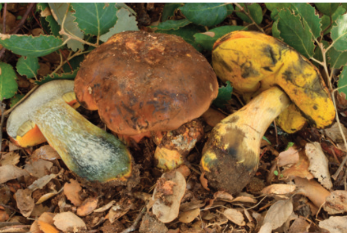
Figura 53. Neoboletus xanthopus