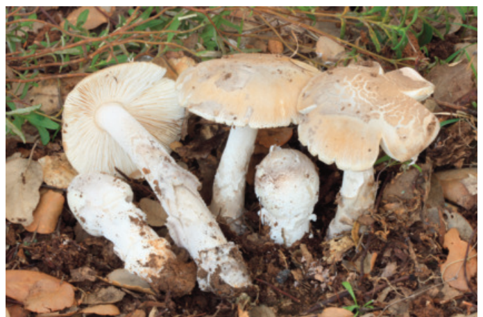
Figura 28. Amanita ceciliae

Observaciones: novedad para el parque Natural Sierra de Grazalema (Moreno-Arroyo 2004).