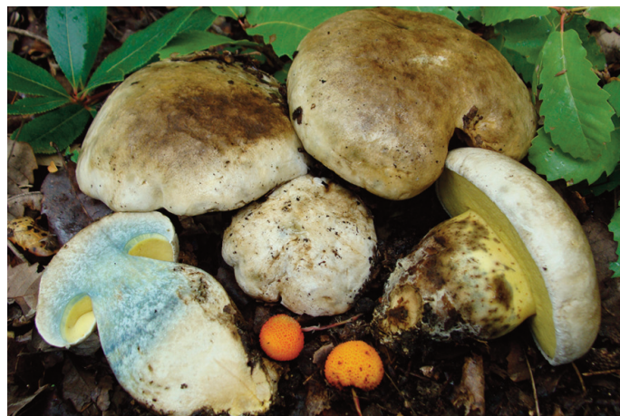
Figura 47. Caloboletus radicans

Leccinellum lepidum (H. Bouchet ex Essete) Bresinsky & Manfr. Binder CÁDIZ: Grazalema, puerto del Pinar, 30STF8372 (Moreno-Arroyo 2004 sub Leccinum lepidum (Bouchet ex Essete) Quadraccia).