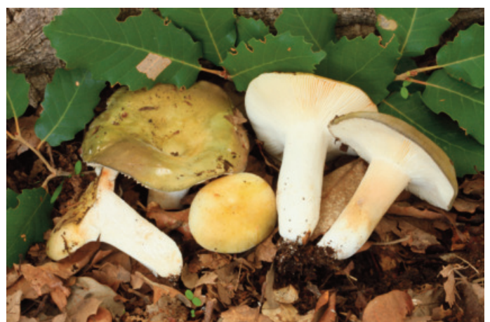
Figura 68. Russula amoenicolor f. olivacea