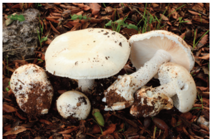
Figura 32. Amanita ovoidea

CÁDIZ: Grazalema, puerto del Pinar, 30STF8372 (Moreno et al. 2007 sub Pholiotina aporos (Kits van Wav.) Clemençon).