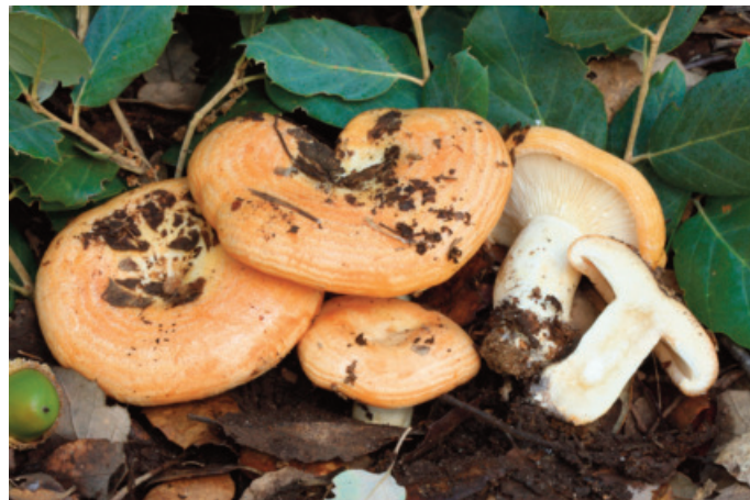
Figura 65. Lactarius zonarius

CADIZ: Grazalema, puerto de las Palomas, 30STF8774 (Moreno-Arroyo 2004).