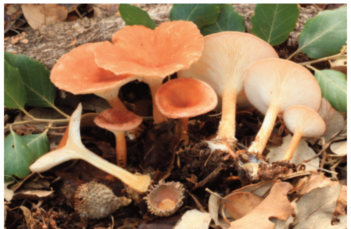
Figura 40. Infundibulicybe mediterranea

CÁDIZ: Grazalema, sierra del Pinar, 30STF8372 (Castro 2018).