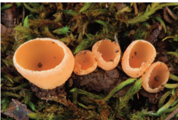
Figura 17. Tarzetta cupularis