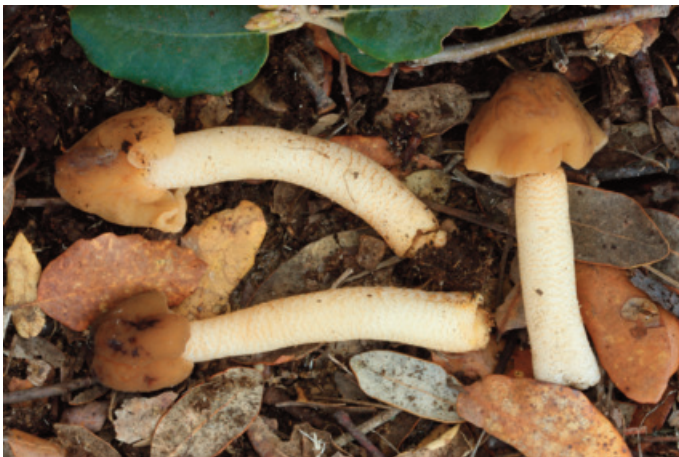
Figura 15. Verpa digitaliformis

Pithya vulgaris Fuckel CÁDIZ: Grazalema, puerto del Pinar, 30STF8374 (Ortega et al. 2002); sierra de San Cristóbal, pinar de San Cristóbal (Ortega y Aguilera, 1986).