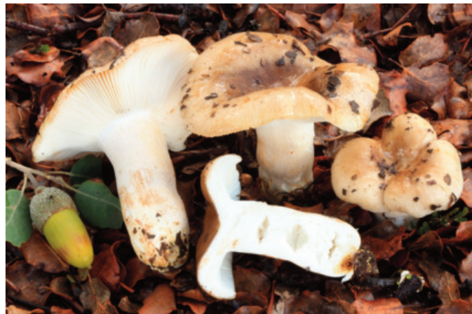
Figura 69. Russula insignis

CÁDIZ: Grazalema, monte de las Encinas y los Laureles,