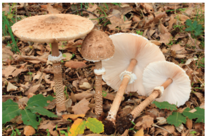
Figura 26. Macrolepiota procera

MÁLAGA: Ronda, El Cupil, 30STF9961, alcornocal con sotobosque de Cistus monspeliensis , 790 m. JA-CUSSTA 8508 (figura 28).