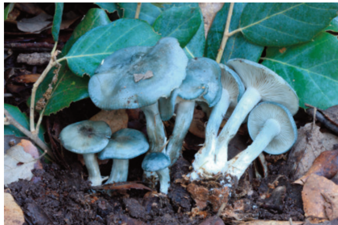
Figura 39. Clitocybe odora

Observaciones: novedad para el Parque Natural Sierra de Grazalema (Moreno-Arroyo 2004).