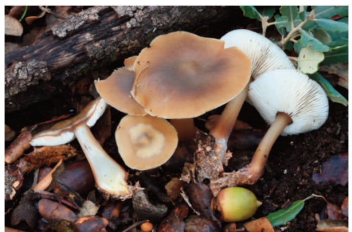
Figura 38. Rhodocollybia butyracea

Observaciones: la cita de Málaga aparece en el artículo original como perteneciente a Montejaque, sin embargo, en realidad es término municipal de Ronda.