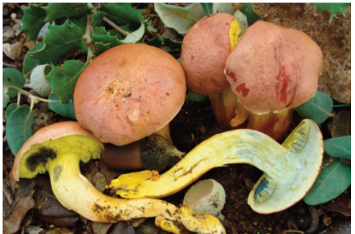
Figura 54. Rheubarbariboletus persicolor