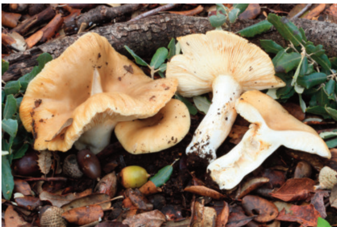
Figura 73. Russula praetervisa

Aleurodiscus dextrinoideocerussatus Manjón, M.N.Blanco & G.Moreno CADIZ: Grazalema, aldeaños Grazalema, 30STF8971 (Moreno-Arroyo 2004).