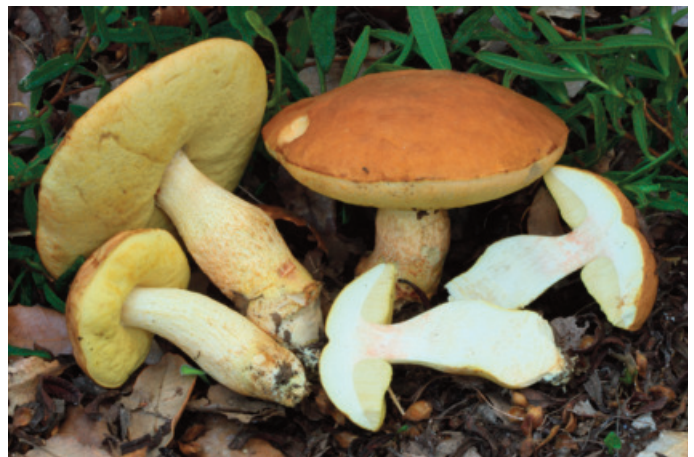
Figura 52. Leccinellum corsicum