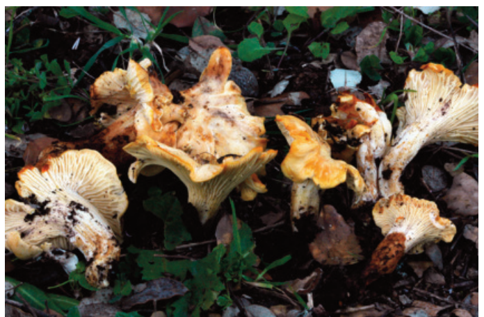
Figura 18. Cantharellus lilacinopruinatus