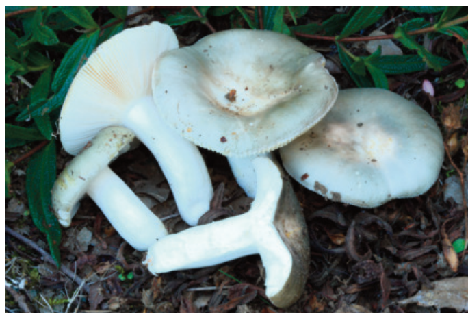
Figura 71. Russula monspeliensis

30STF8170, encinar basófilo, 860 m, 17-X-2015, JA-CUSSTA 8516 (Becerra y Robles 2016) (figura 70).