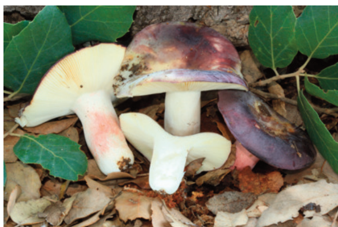
Figura 67. Russula amoenicolor