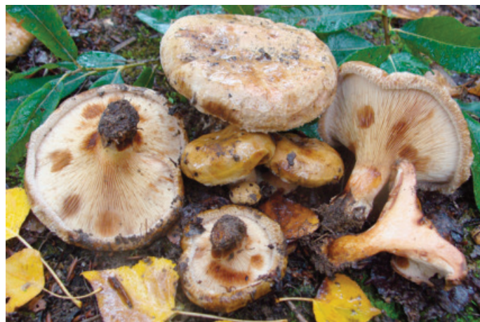
Figura 61. Paxillus ammoniavirescens

CÁDIZ: Grazalema, puerto del Boyar, 30STF8671 (Moreno-Arroyo 2004).