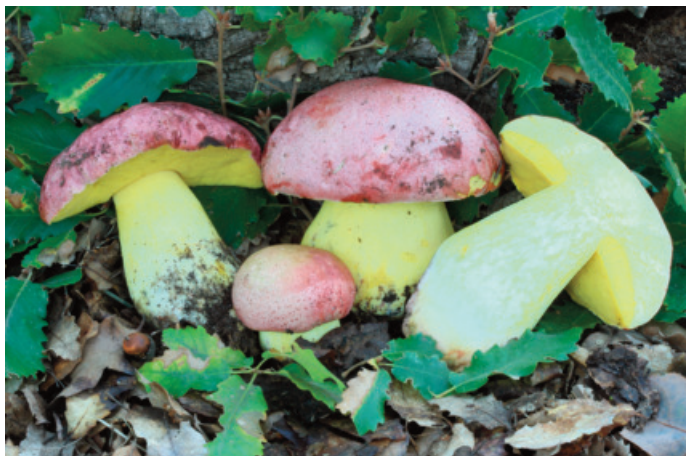
Figura 46. Butyriboletus regius

MÁLAGA: Benaoján, La Dehesa, 30STF9965, encinar basófilo, 460 m, 13-X-2010 (Becerra y Robles 2011 sub Boletus poikilochromus Pöder, Cetto & Zuccherelli) (figura 48).