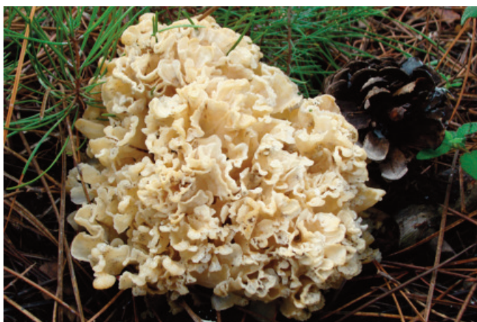
Figura 21. Sparassis crispa

Corticium roseum (Pers.) Donk CÁDIZ: El Bosque, 30STF7670 (Tellería 1991 sub Laeticorticium roseum (Pers.) Donk).