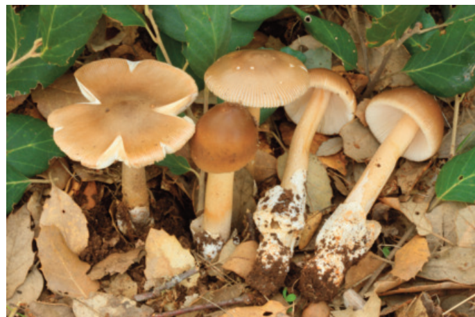
Figura 31. Amanita fulvoidea

CÁDIZ: Grazalema, Las Cumbres, 30STF9170 (Castro 2018);