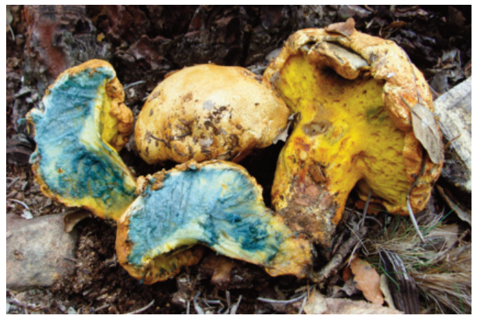
Figura 44. Buchwaldoboletus pontevedrensis