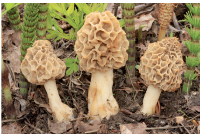
Figura 14. Morchella vulgaris