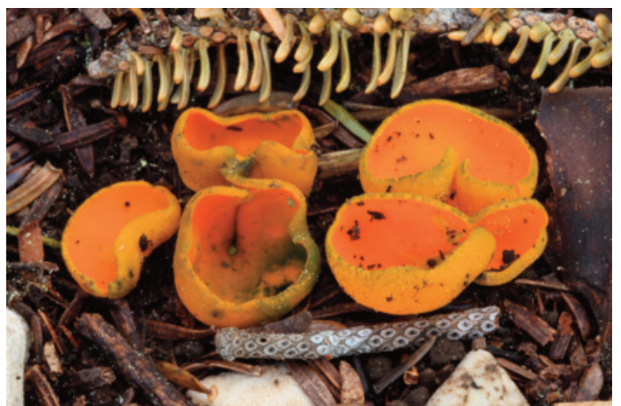
Figura 10. Caloscypha fulgens