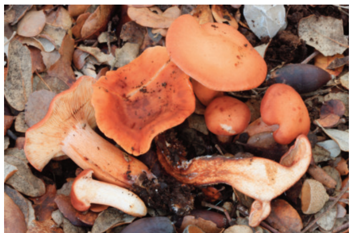
Figura 62. Laccaria atlanticus

*MÁLAGA: Ronda, El Cupil, 30STF9971, alcornocal, 770 m, 24-