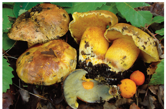
Figura 48. Cupreoboletus poikilochromus

* Rubroboletus pulchrotinctus (Alessio) Kuan Zhao & Zhu L. Yang CÁDIZ: El Bosque, El Castillejo, 30STF7771, encinar-quejigal