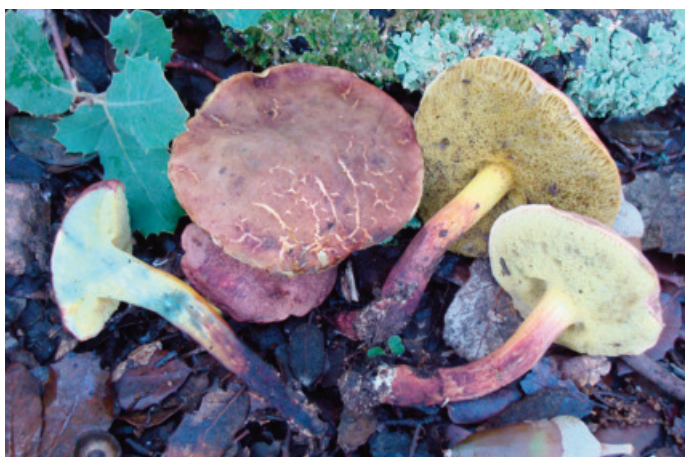
Figura 60. Xerocomellus redeuilhii