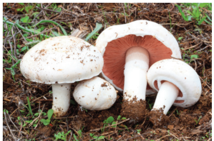
Figura 22. Agaricus campestris

Tomentella botryoides (Schwein.) Bourdot & Galzin CÁDIZ: Grazalema, Benamahoma (Tellería 1980).