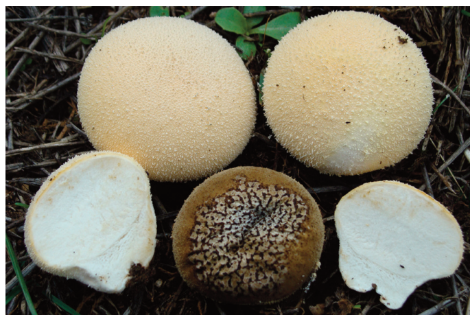
Figura 25. Lycoperdon pratense

Observaciones: la cita dada por Castro para Montejaque (Castro 2018), se corresponden en realidad al término municipal de Ronda.