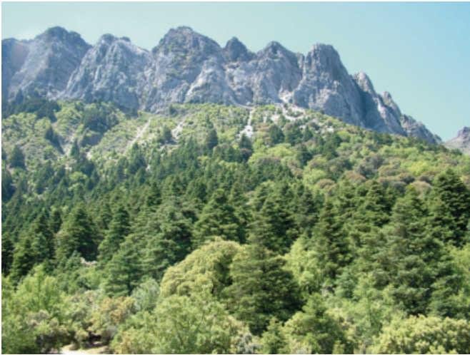
Figura 5. Pinsapar de Grazalema

algunas orquídeas como Epipactis kleinii M.B. Crespo, M.R. Lowe & Piera o Cephalanthera rubra (L.) Rich.