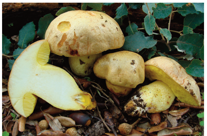
Figura 50. Hemileccinum impolitum