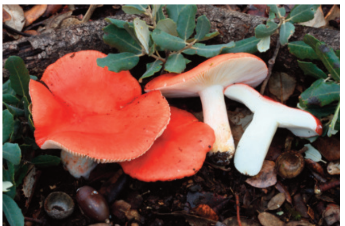
Figura 72. Russula persicina