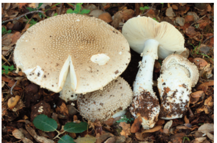
Figura 30. Amanita echinocephala