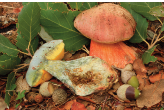
Figura 55. Rubroboletus legaliae