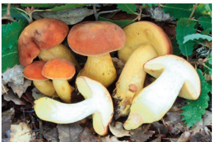
Figura 42. Aureoboletus moravicus