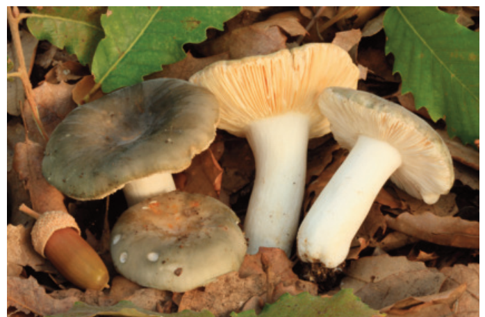
Figura 74. Russula pseudoaeruginea