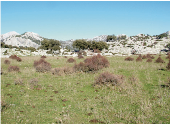
Figura 6. Pastizal de montaña en la sierra del Caíllo (Villaluenga del Rosario)

incidencia en el fondo de los grandes poljes de la Sierra, caso de los del Republicano, Manga de Villaluenga o Líbar.