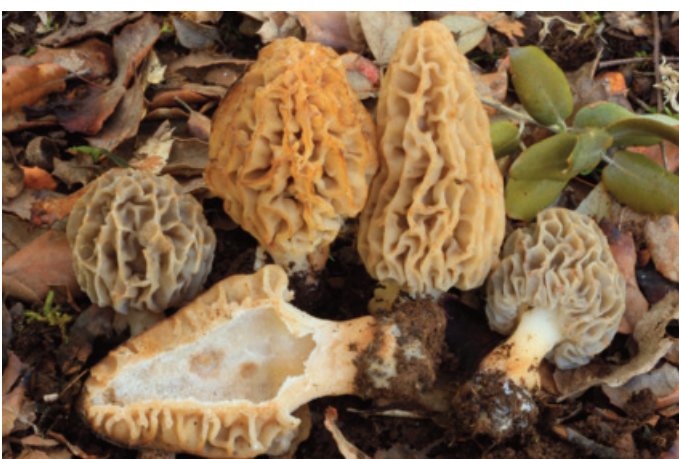
Figura 13. Morchella tridentina