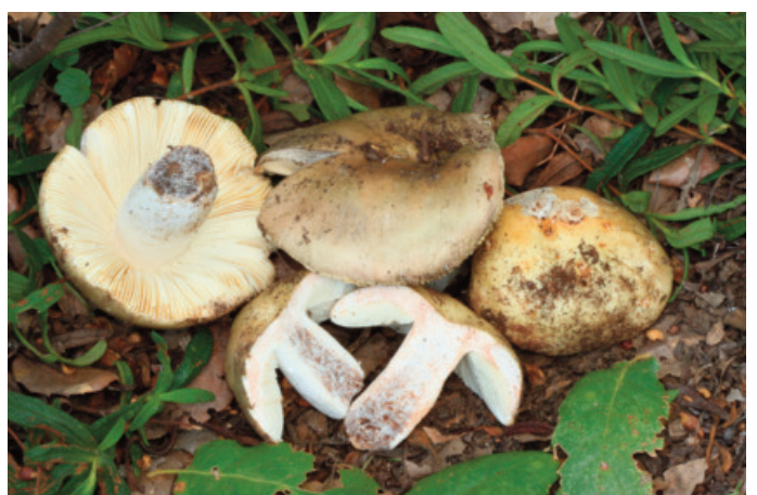
Figura 76. Russula seperina f. luteovirens