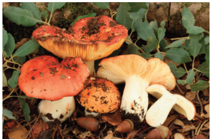
Figura 70. Russula maculata

CÁDIZ: Grazalema, monte de las Encinas y los Laureles,