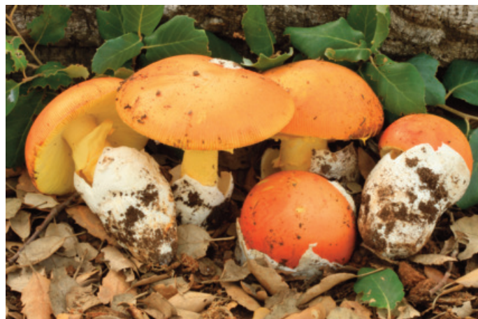
Figura 27. Amanita caesarea

MALAGA: Ronda, Cortijo del Chusco, 30STF962 (Moreno-Arroyo 2004).