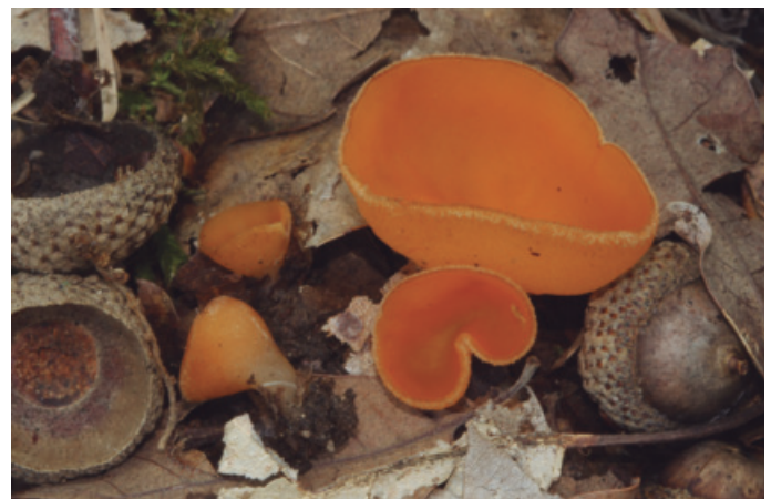
Figura 16. Pseudaleuria fibrillosa