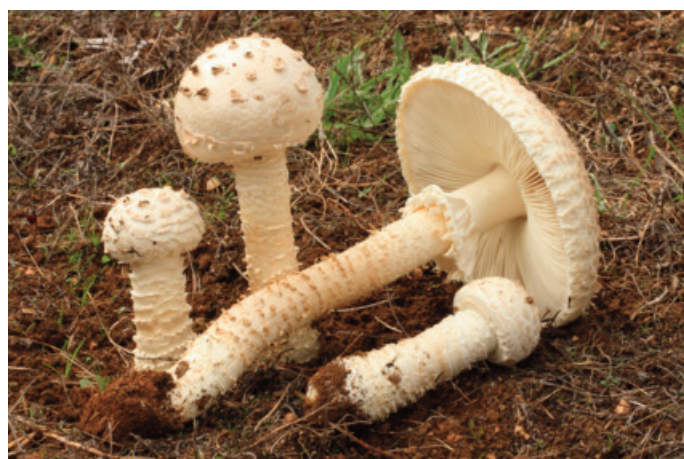
Figura 35. Saproamanita vittadinii

CÁDIZ: El Bosque, llano del Espino, 30STF7674 (Moreno-Arroyo 2004 sub Rhodocybe gemina (Fr.) Kuyper & Noordel.).