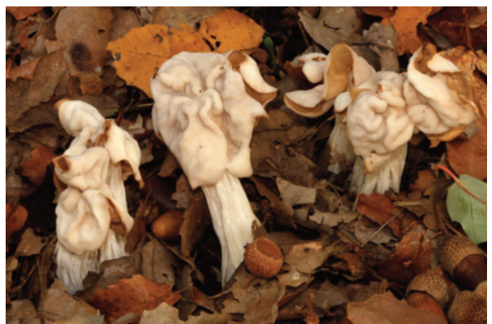
Figura 12. Helvella crispa