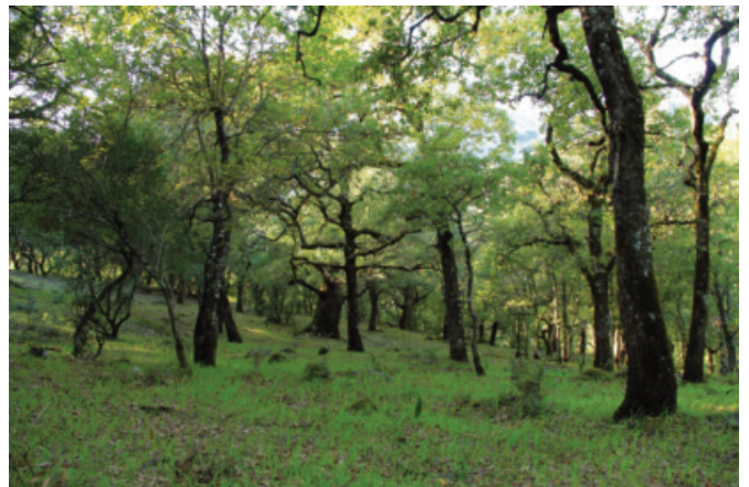
Figura 4. Quejigal en los alrededores del Berrueco

El primero de ellos, forma una masa bastante extensa en la vertiente del Peñón del Berrueco hacia la Garganta de Barrida. Estos quejigales de hoja ancha ( Rusco hipophylli-Querceto canariensis ) presentan un sotobosque escaso por la densa sombra que ofrece el dosel arbóreo, apareciendo genistas como Teline linifolia .