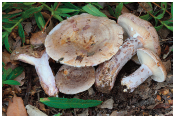
Figura 63. Lactarius cystophilus