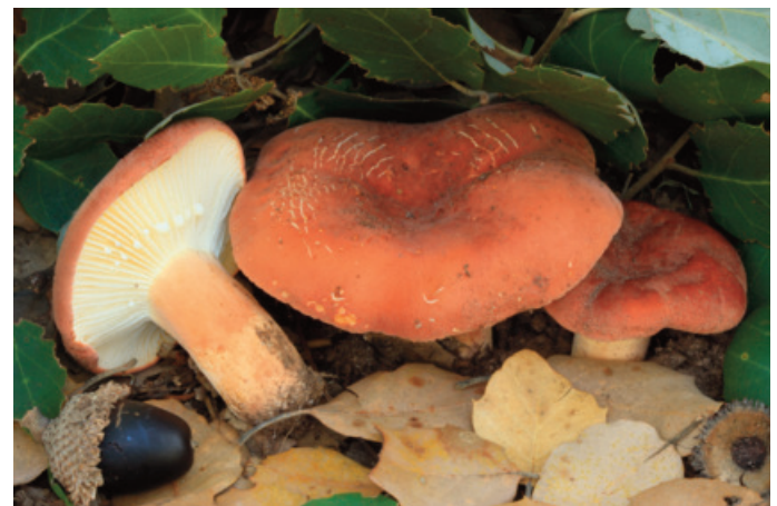
Figura 66. Lactifluus rugatus