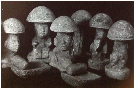
La « chair des dieux ». Art maya