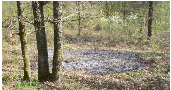
Le sol brûlé, en 2018

« Ce polypore « cultivé » est un comestible estimé, notamment en Espagne et en Italie. On peut provoquer sa poussée en mettant le feu, entre autres à des bosquets de noisetiers ( Corylus avellana ; d'où, l'épithète corylinus ). « Les habitants mettent eux-mêmes le feu aux arbustes quelques jours avant leurs fêtes de village et s'il ne survient pas de pluie, arrosent les souches brûlées pour faire apparaître les fructifications. » (SCHULTHEIS & THOLL)