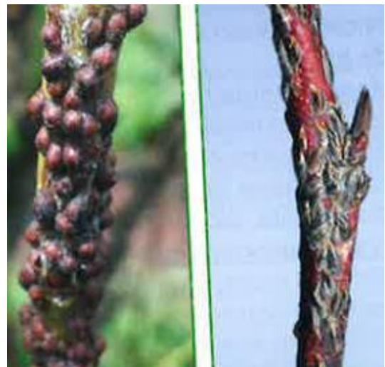
Cocc. Mezzo grano di pepe

In caso di forte presenza intervenire con olio minerale alla caduta foglie (Chemol, 3 l/hl, Chemol 90 EL 1,5 l/hl). Trattamento da ripetere prima della rottura gemme in primavera.