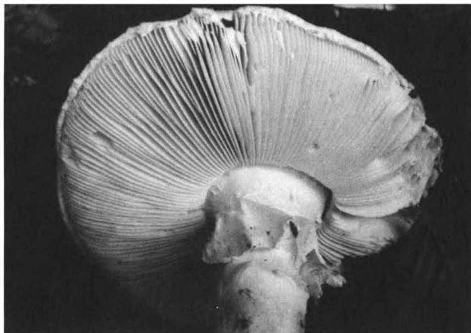
Amanita solitaria (Bull.: Fr.) Mérat, syn.: A. echinocephala (Vitt.) QuéL. Growing in deciduous forests, floodplain forests, on moist, nutrient-rich, neutral to basic soils. Primary in warm regions of Czech Rep. Not common. Loc.: Praha-Velká Chuchle, SPR Chuchelský háj, Carpinion, calcareous soil, Sept. 11, 1991, J. Klán.