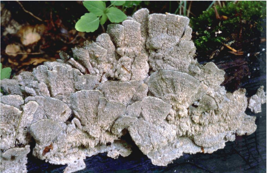
Outkovka jednobarvá – Cerrena unicolor . Malé Karpaty, Borinka, SPR Strmina, ležící kmen buku, 17. VI. 2001. (k článku na str. 1)