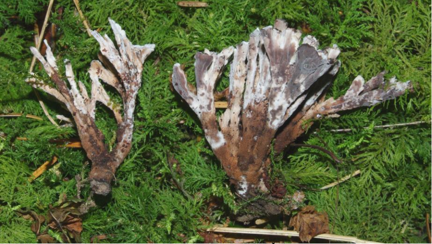
Plesňák měnlivý – Thelephora anthocephala . Střední Čechy, Posázaví, U Kamenného stolu poblíž Ratají nad Sázavou, pod jedlemi, dutina v zemi: v hlíně a mechu mezi kapradinami, 10. IX. 2009 leg. et det. J. Holec, JH 76/2009 (PRM 915903), foto J. Holec (k článku na str. 8)