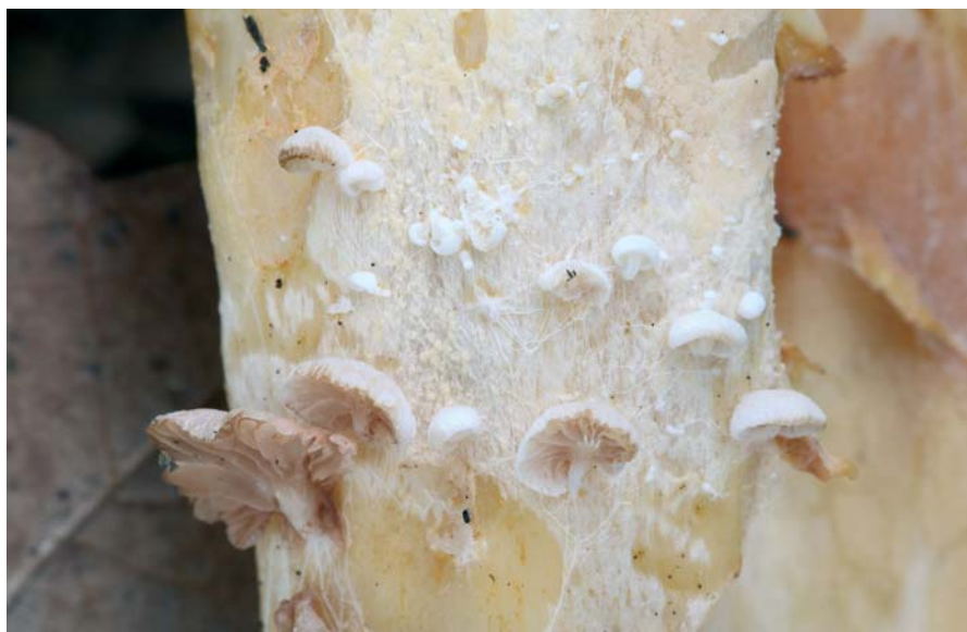
Závojenka Jahnova – Entoloma jahonii. Dobříš, polesí směrem k Voznici, na dospělé plodnici lišky bledé vyrostlé v dubovém lese (plodnice rostoucí z třeně lišky), 18. 6. 2018