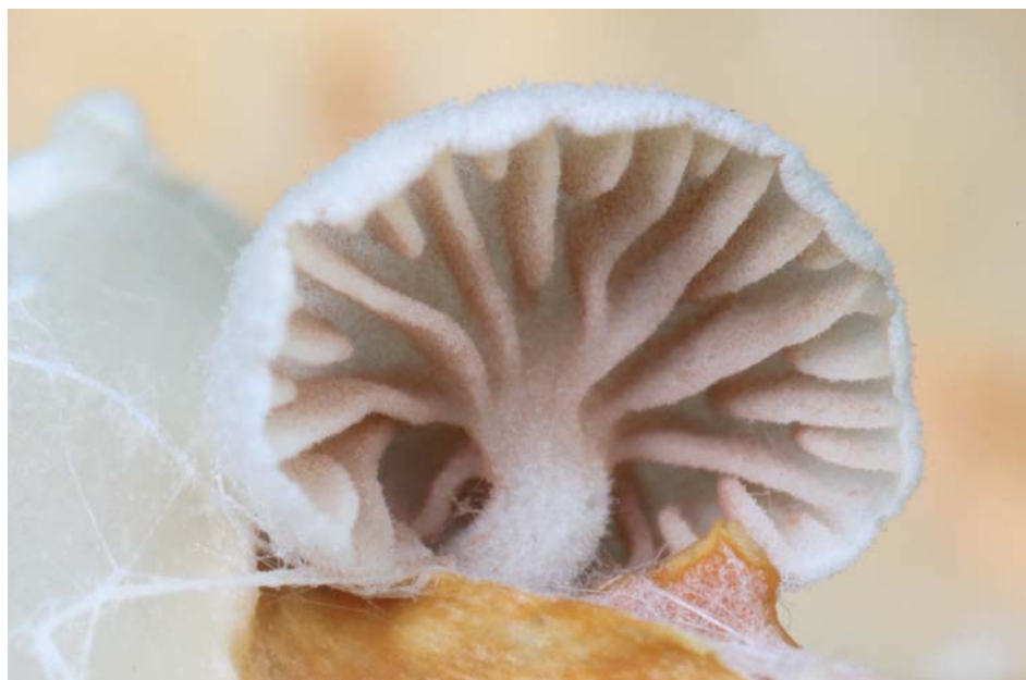
Závojenka Jahnova – Entoloma jahonii. Dobříš, polesí směrem k Voznici, na dospělé plodnici lišky bledé vyrostlé v dubovém lese, 18. 6. 2018, (k článku na str. 12).