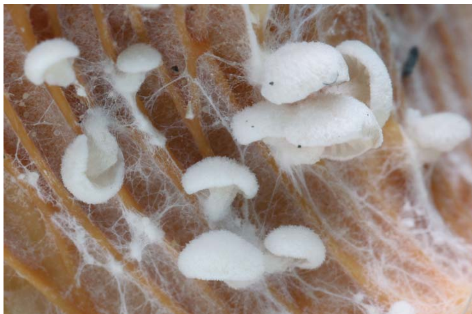
Závojenka Jahnova – Entoloma jahonii. Dobříš, polesí směrem k Voznici, na dospělé plodnici lišky bledé vyrostlé v dubovém lese (plodnice rostoucí z lišt lišky), 18. 6. 2018, (k článku na str. 12).