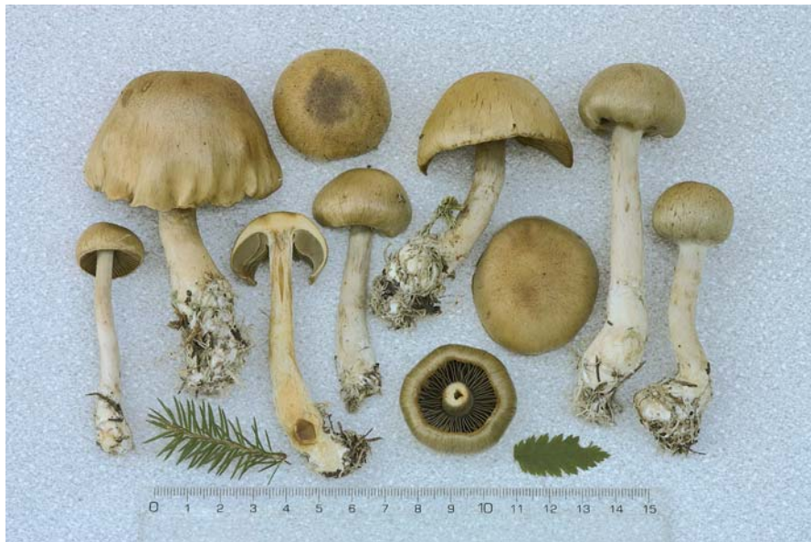
Pavučinec olivově žlutý – Cortinarius subtortus. Rudoltice u Sobotína, NPR Rašeliniště Skřítek, 1. 9. 2016

Vlastní mikrolokalitou bylo rašeliniště v podmáčené smrčině s borůvkou a brusinkou v podrostu (obr.), z dřevin byl v okolí pouze smrk. Na ploše přibližně 2 × 2 metry bylo nalezeno 15 plodnic.