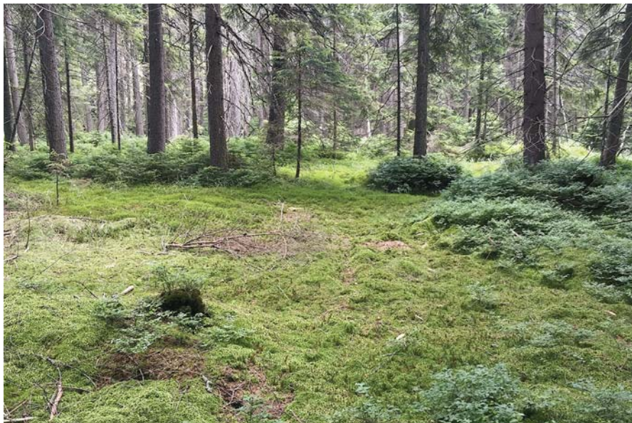
Pavučinec olivově žlutý – Cortinarius subtortus, lokalita nálezů. Rudoltice u Sobotína, NPR Rašeliniště Skřítek, 1. 9. 2016