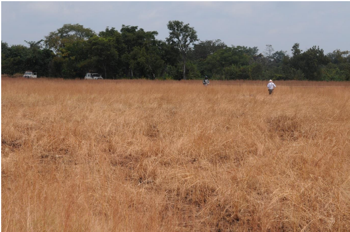
Bowal ferralitique de Simbaraya, novembre 2012