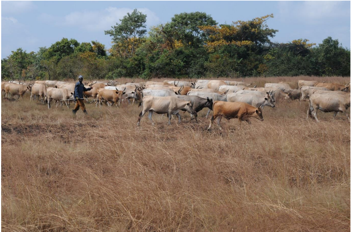
Éleveurs sur le bowal de Simbaraya, novembre 2012