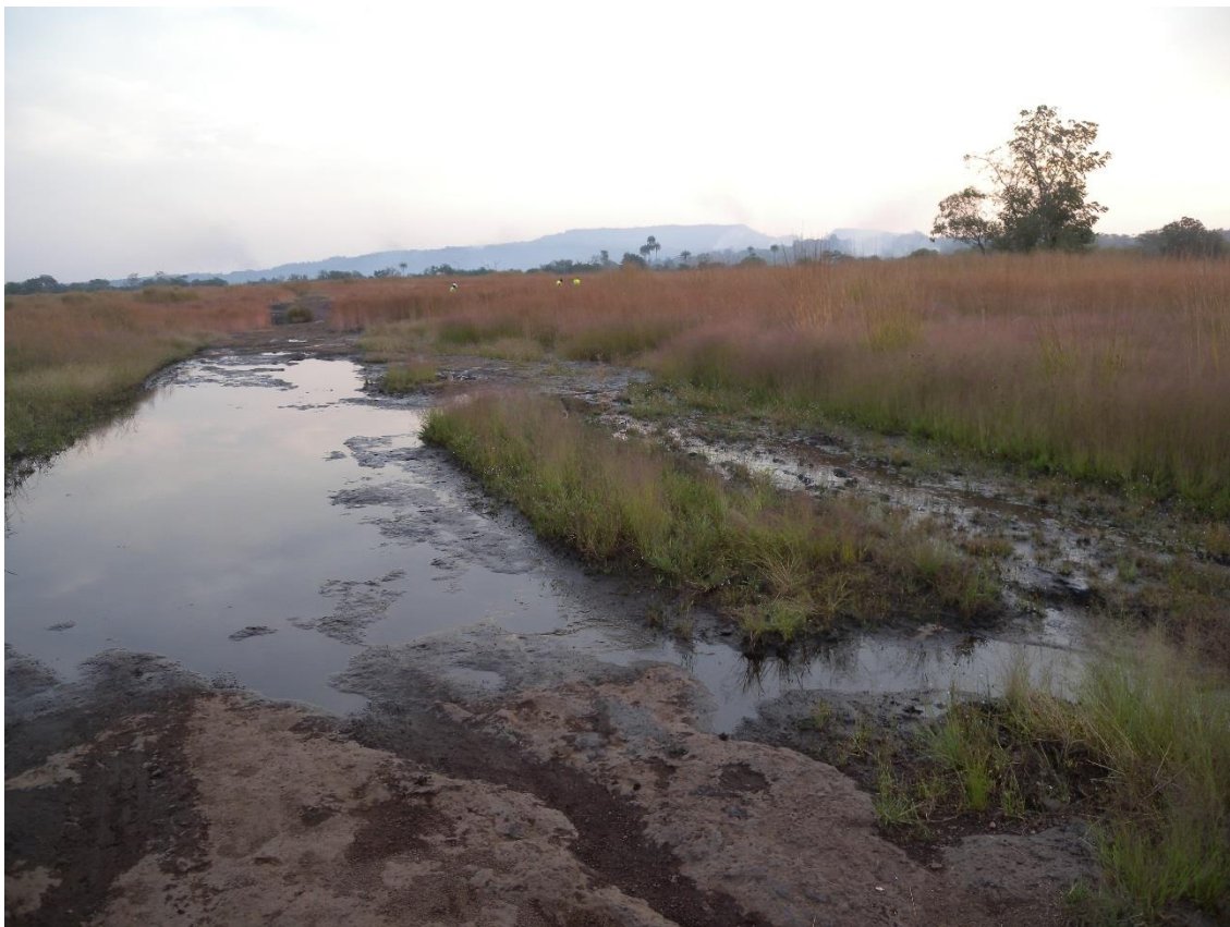
Végétation de chasse éphémère, novembre 2012