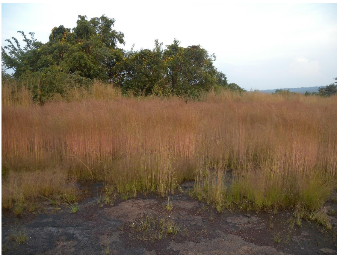
Végétation de chasse éphémère, novembre 2012