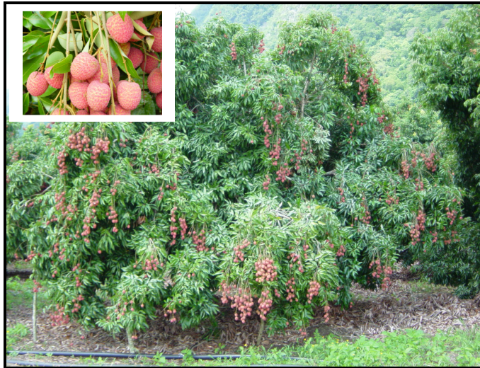
Figura 4. Árbol de la variedad Racimo Rojo.