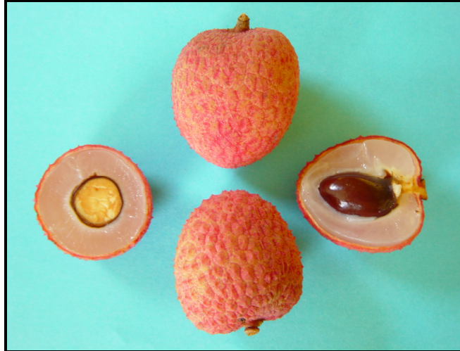
Figura 2. Fruto, semilla y arilo (pulpa) de litchi.

Semilla. Dentro del arilo está la semilla, que varía de tamaño según el cultivar, puede alcanzar hasta 2.5 cm de largo, es brillante de color café y representa del 10 al 18% del peso del fruto (Figura 2). Las semillas atrofiadas denominadas “lengua de pollo”, característica de algunas variedades, son pequeñas y arrugadas, no viables y representan en este caso solo el 4% del peso del fruto, razón por la que el fruto, con esta característica es preferido por los consumidores, pues contiene un mayor porcentaje de pulpa.