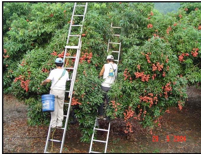
Figura 9. Cosecha de Litchi en el mes de mayo.

La cosecha se realiza manualmente, para lo cual se utilizan escaleras, mismas que se recargan alrededor de la copa del árbol. El corte de la fruta se hace por racimos, cortando la rama con una porción de tallo que contenga en la parte basal del racimo unos dos pares de folíolos, lo que a su vez equivaldrá a la poda anual, para propiciar un mayor número de brotes terminales para la próxima cosecha; los racimos se recolectan en cubetas de plástico o recipientes lisos para evitar daños a los frutos (figura 9).