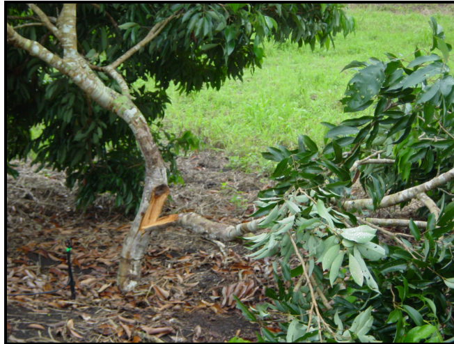
Figura 7. Árbol con “desgajamiento” severo, por falta de poda de formación.

ya que éstas, con el tiempo se desgajan fácilmente (Figura 7). Es así como se va conformando adecuadamente el conjunto de ramas secundarias. Esta poda de formación puede realizarse en cualquier época del año conforme se necesite. Para formar y balancear adecuadamente la copa del árbol, generalmente son necesarias de 2 a 3 podas por año durante los primeros 3 años de desarrollo.