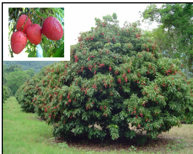
Figura 5. Arbol de la variedad Ralo Rojo.