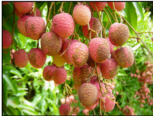
Figura 8. Mancha café del fruto de litchi.

Para la prevención de la enfermedad, además del cuidado de los niveles de humedad, se recomiendan dos aplicaciones foliares a base de Benomyl a razón de 1 gramo por litro de agua, iniciando la primera 30 días previos a la cosecha y la segunda 10 días después de la primera. Esta enfermedad ataca significativamente más a la variedad Racimo Rojo.