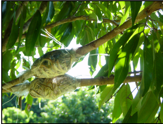
Figura 3. Acodos en la planta madre a los 60 días listos para “cosecharlos” y llevarlos a la etapa del vivero.

El período óptimo para realizar el acodo es de mayo a julio, cuando existe mayor humedad y alta temperatura, condiciones que favorecen la emisión de raíces en el acodo realizado y la posterior finalización de la planta en la etapa del vivero.