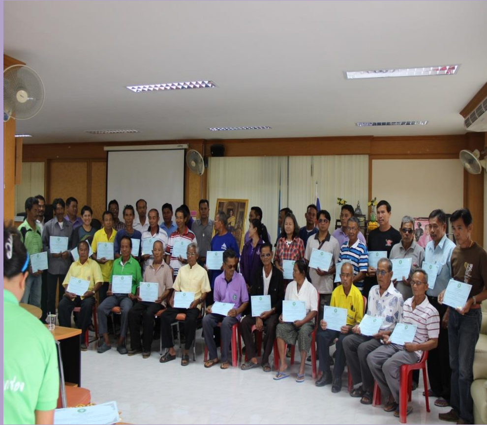
เชิดชูเกียรติภูมิปัญญาในท้องถิ่น