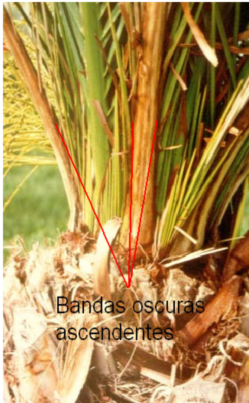
Bandas oscuras ascendentes