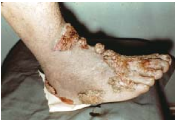
Figura 1. Lesiones verrucosas, vegetantes, características de cromomicosis podálica.

Esta micosis profunda, de localización subcutánea, se desarrolla en el sitio de un traumatismo transcutáneo que vehiculiza la fase saprofitaria del hongo causal. La infección avanza lentamente en el transcurso de años, a medida que el agente etiológico sobrevive y se adapta a la condición del huésped. El hongo adquiere en los tejidos, en su vida parasitaria, estructuras multicelulares de gruesas paredes coloreadas de negro, llamadas células muriformes o cuerpos escleróticos (corpúsculos «fumagoides»), que se dividen por facetación y nunca por gemación. Los hongos pueden estar libres en el tejido o fagocitados por macrófagos. En la dermis, las células muriformes presentes en los microabscesos formados por la reacción celular, a menudo muestran daño en su pared celular, pero los macrófagos no son capaces de destruir las células micóticas fagocitadas, las que siguen desarrollándose en su interior. Las células muriformes de la F. pedrosoi pueden permanecer viables por más de 18 meses, después de que el tejido infectado ha sido recolectado de pacientes, demostrando la resistencia natural de estas estructuras (Rosental et al. citado por Queiroz-Telles) 3 .