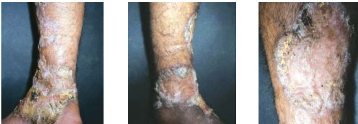
Figura 3, 4, y 5. Úlcera vegetante, verrucosa, abarcando todo el tercio inferior de la pierna de un paciente con cromomicosis. Instituto de Medicina Tropical «Daniel A. Carrión» UNMSM (Dermatología sanitaria) Dic. 1974.

Tiempo de incubación: el más corto es de 2 meses y el más largo de 40 años. El tiempo promedio entre la aparición de las lesiones y el diagnóstico fue de 14 años.