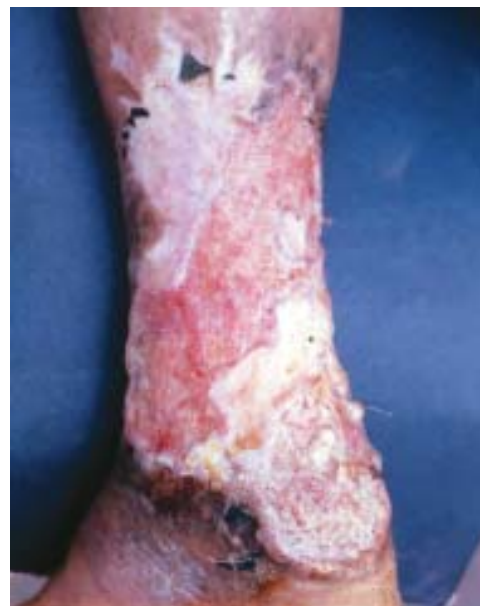
Figura 2. Gran lesión ulcerativa de bordes vegetantes y zonas cicatriciales en tercio inferior de pierna con cromomicosis.

En el sitio de la inoculación aparece una pápula o placa que desarrolla en semanas o meses, adquiriendo forma verrucosa. Las lesiones antiguas se aclaran en su parte central y pueden ulcerarse. La mayoría de lesiones son solitarias o pueden estar agrupadas, evolucionan en forma moderada o severa, sin tendencia a curarse espontáneamente y pueden infectarse secundariamente, provocando linfoedema y elefantiasis dando lugar, ocasionalmente, a carcinoma epidermoide. En Brasil se presenta un alto porcentaje, hasta 85% en miembros inferiores y sólo 13% en miembros superiores, siendo lo contrario en Venezuela.