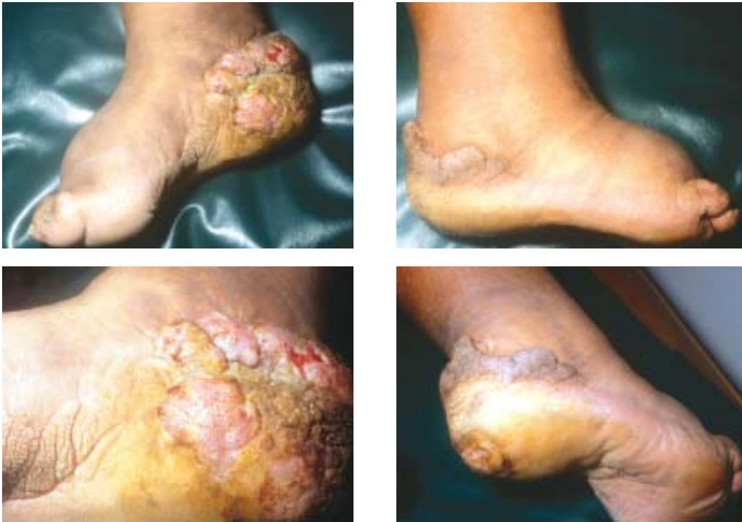
Figura 6, 7, 8, y 9. Lesión tumoral, verrucosa, vegetante, con linfoedema, que abarca el pie y el tercio inferior de la pierna de un paciente con cromomicosis. Instituto de Medicina Tropical «Daniel A. Carrión» UNMSM (Dermatología sanitaria) Marzo 1999.

pués por otros autores. Sin embargo, Castro 25 , el año 2003, demuestra que temperaturas tan bajas como -190\text{ }^{\circ}\text{C} , a las que se llega con el nitrógeno líquido, no matan al hongo como se creía y que éstos pueden recuperarse viables de las lesiones tratadas con este procedimiento hasta después de 12 días de terminado el tratamiento con resultados exitosos; planteando que el mecanismo de la cura no se conoce y cabe sospechar en un estímulo inmunológico.