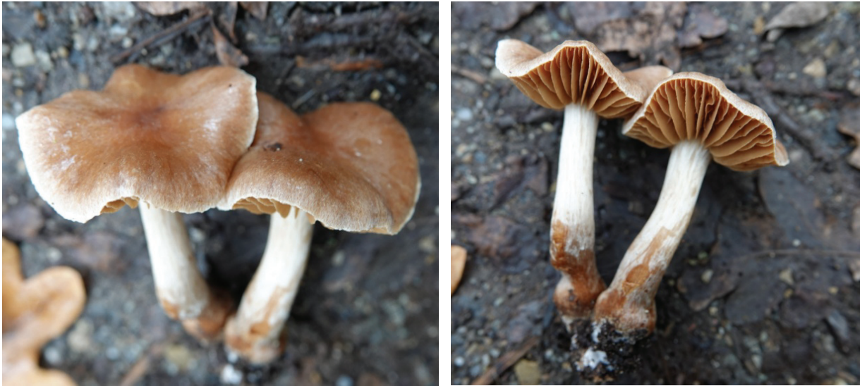
Cortinarius sordescitipes - Cortinariaceae (Lieu : Ecomusée d'Alsace UNGERSHEIM - 12.11.2019)