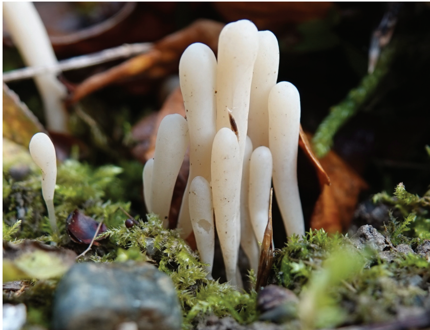
Clavaria argillacea var. obtusata Clavariaceae (Lieu : Ecomusée d'Alsace UNGERSHEIM - 19.11.2019)

Clavaria argillacea var. obtusata (Boud.) J. Favre - DOL