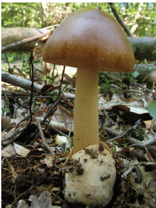
Amanita fulva forma ad int