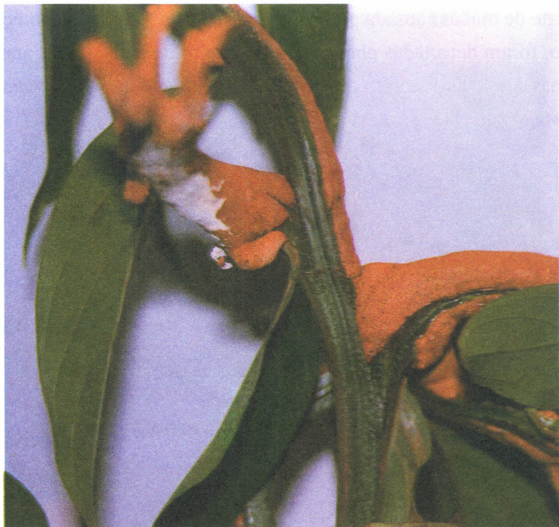
Fig. 5.4 Galhas em ramos de louro amarelo causadas por Drepanocones sp.

do superbrotamento e do cancro, provocadas por Fusarium decemcellulare Brick, nas plantas cultivadas em sistemas consorciados com o cacauzeiro ( Theobroma cacao L.), para sombreamento definitivo dessa cultura em Ouro Preto d'Oeste, Estado de Rondônia. A doença foi observada no tronco e nos ramos das árvores. Nos ramos, as folhas ficam encarquilhadas e caem e no tronco, ocorrem o secamento total e rachaduras na casca (Albuquerque & Bastos, 1990). Possíveis patógenos foram detectados em testes de sanidade em sementes dessa essência florestal, como Fusarium , Alternaria , Curvularia e Pestalotia (Carneiro, 1987).