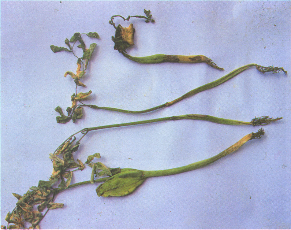
Fig. 5.5 Estiolamento de mudas de paricazeiro causado por Fusarium sp.

da morte de mudas causada por Fusarium sp. (Fig. 5.5) . Sob condições de campo, foram detectadas plantas de paricazeiro de mais de três anos com sintomas de galhas de coroa causada pela bactéria Agrobacterium radiobacter pv. tumefaciens (Fig. 5.6).