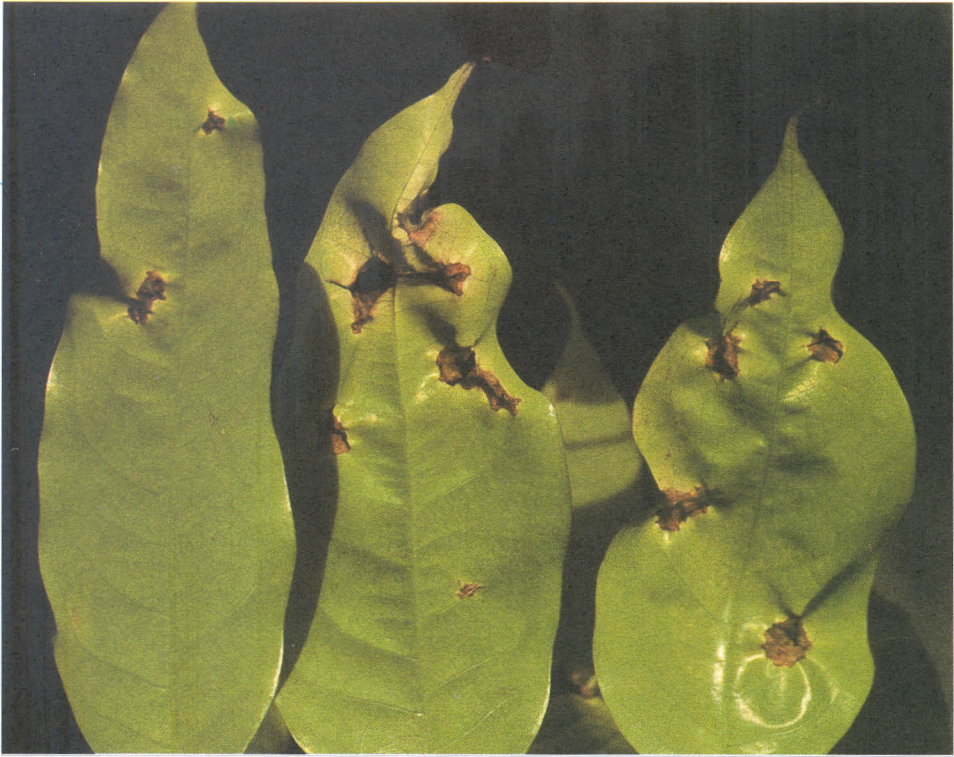
Fig. 5.2 Mancha escura das folhas de acauzeiro causada por Phomopsis sp.

com superfície lobulada, desprovidos de septos, medindo 14\mu\text{m} - 16\mu\text{m} \times 4\mu\text{m} - 8\mu\text{m} . Embora as folhas apresentem numerosas manchas, o patógeno não causa queda da folhagem. Os prejuízos restringem-se à redução da área fotossintética.