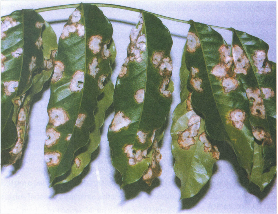
Fig. 5.3 Folhas de mogno africano com sintomas de mancha areolada causada por Thanatephorus cucumeris , associado a Corynespora cassiicola , sob condições de campo.

Em jatobazeiro ( Hymenaea courbarry L.), espécie de madeira dura e nobre usada para postes, esteios, vigas, assoalhos, mobiliário, etc., no Pará e em