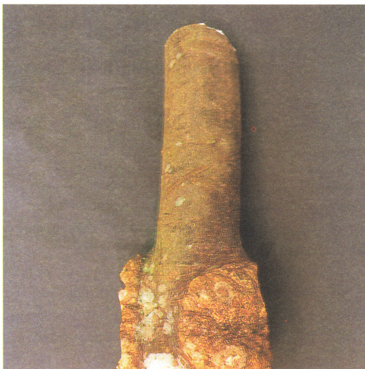
Fig. 5.6 Galha da coroa ( Agrobacterium radiobacter pv. tumefaciens ) em tronco de plantas de paricazeiro, sob condições de campo.

Testes de sanidade em sementes de itaúba amarela ( Mezilaurus itauba (Meins.) Taub. Ex. Mez.), munguba ( Pseudobombax munguba C. Martius & Zuccarini) Dugand), cedro ( Cedrella odorata L.), gmelina ( Gmelina arborea Roxb. Ex. Sm.), quaruba ( Vochysia maxima Ducke), caroba ( Jacaranda copaia (Aubl.) D. Don.), tamanqueira ( Faiara sp.), tatajuba ( Bagassa guiananensis Aubl.) e garapa ( Apulai leiocarpa ), oriundas da região amazônica, detectaram possíveis patógenos, sendo mais comuns os gêneros Fusarium , Alternaria , Phoma , Curvularia , Phomopsis , Rhizoctonia , Botryodiplodia e Pestalotia (Carneiro, 1987).