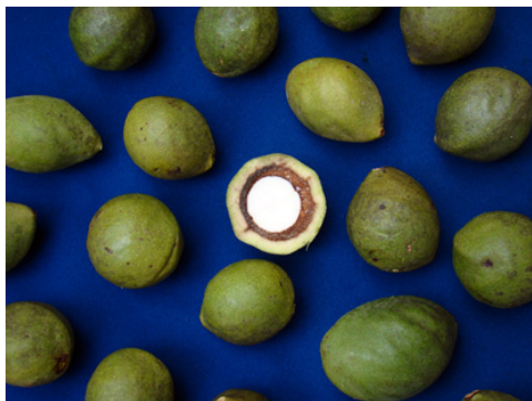
Figura 1. Frutos de morcegueira após a dispersão.

O transporte dos frutos deve ser efetuado em sacos de ráfia, mas evitando-se temperaturas elevadas para que não ocorra a fermentação do mesocarpo (polpa), a proliferação de fungos e o comprometimento da qualidade fisiológica das sementes, com a redução da taxa de germinação.