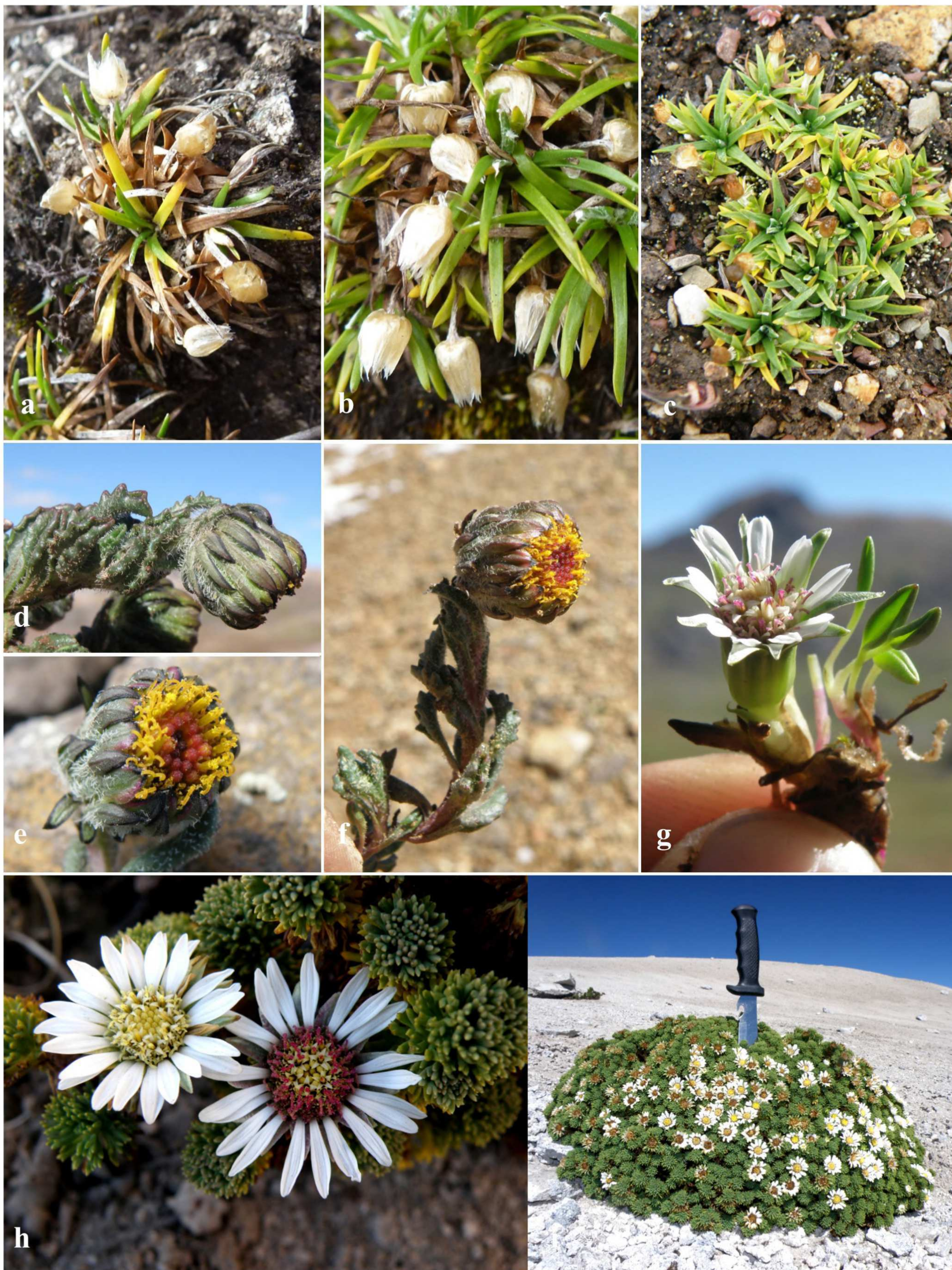
Fig. 1. Nuevos registros de Asteraceae. (a–b) Hábito de Jalcophila boliviensis Anderb. & S. E. Freire; (c) Hábito de Jalcophila ecuadorensis M. O. Dillon & Sagást.; (d–f) Rama florífera de Senecio aquilaris Cabrera; (g) Werneria spathulata Wedd., (h) Rama florífera y (i) hábito de Xenophyllum pseudodigitatum (Rockh.).