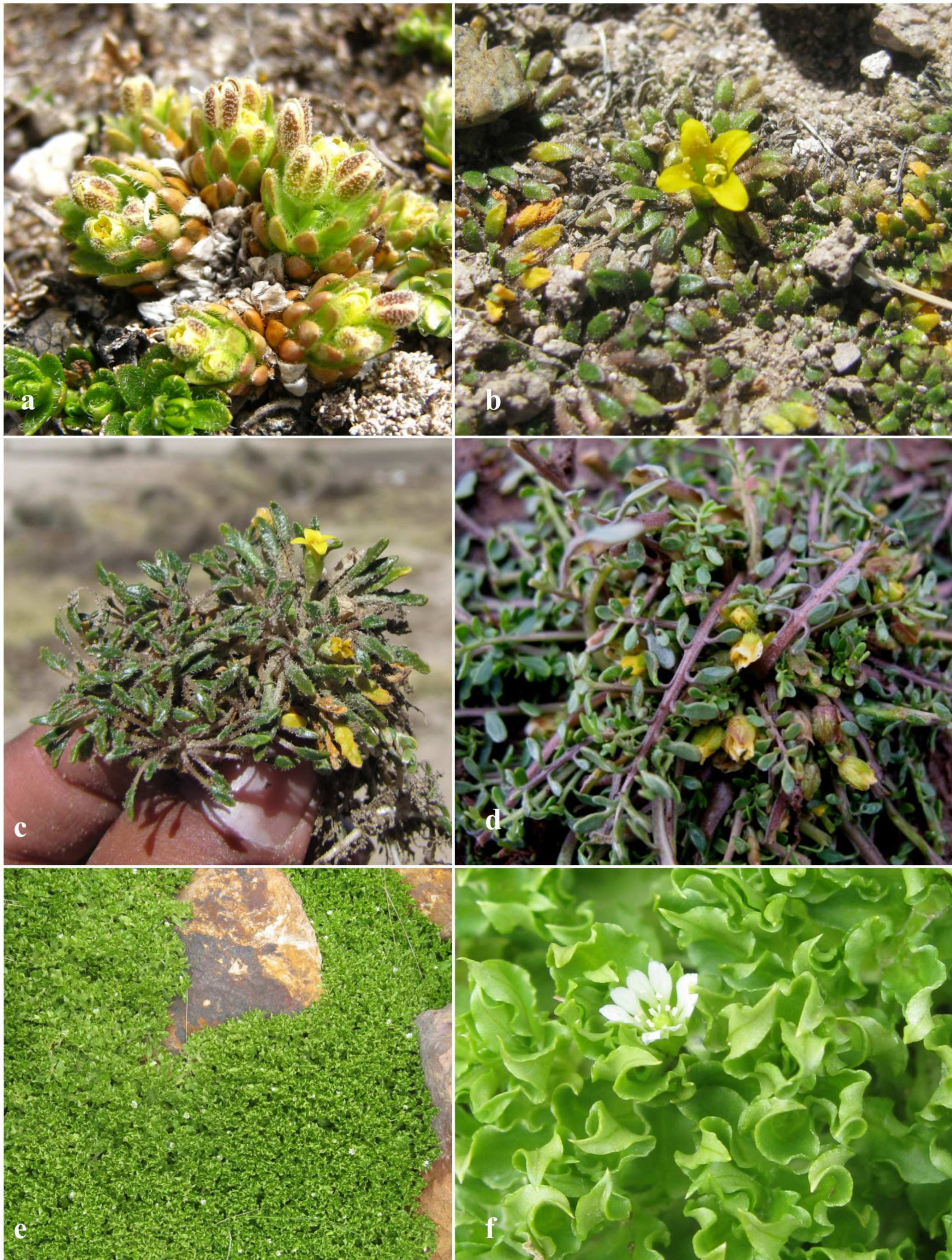
Fig. 2. Nuevos registros de Brassicaceae y Caryophyllaceae. (a) Hábito de Draba loayzana Al-Shehbaz; (b–c) Hábito de Petroravenia werdermannii (O. E. Schulz) Al-Shehbaz; (d) Hábito de Rorippa beckii Al-Shehbaz; (e) Hábito y (f) Rama florífera de Stellaria weddellii Pedersen.