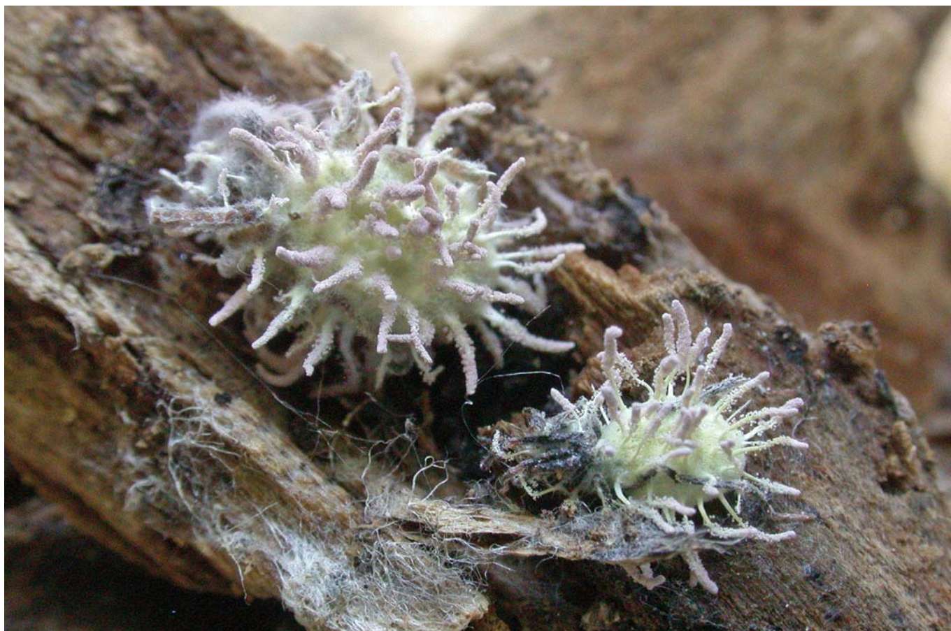
Pl. 1 – Gibellula pulchra. Aspect général, récolte NV 2010.05.28.

Corémies formées d'un faisceau d'hyphes hyalines, cloisonnées, larges de 2–4 µm. Conidiophores macronémés, mononémés, hyalins, constitués d'un stipe cylindrique, de 7–9 µm de diamètre, se développant latéralement (pl. 2, fig. A), cloisonné, à paroi épaisse de 0,3–0,4 µm, verruqueux, portant au sommet un bouquet de ramifications stériles, plus ou moins clavées, et de phialides subcylindracées, mesurant jusqu'à 10 µm de long, produisant les conidies organisées en une masse rayonnante. Conidies très nombreuses, denses, elliptico-fusoïdes, parfois plus larges à une extrémité, (2,5) 3–5 (5,5) × (1,2) 1,5–2 (2,5) µm, X = 4,1 × 1,6 µm, Q = 1,8–2,6–3,3, simples ou en courtes chaînes, hyalines, lisses.