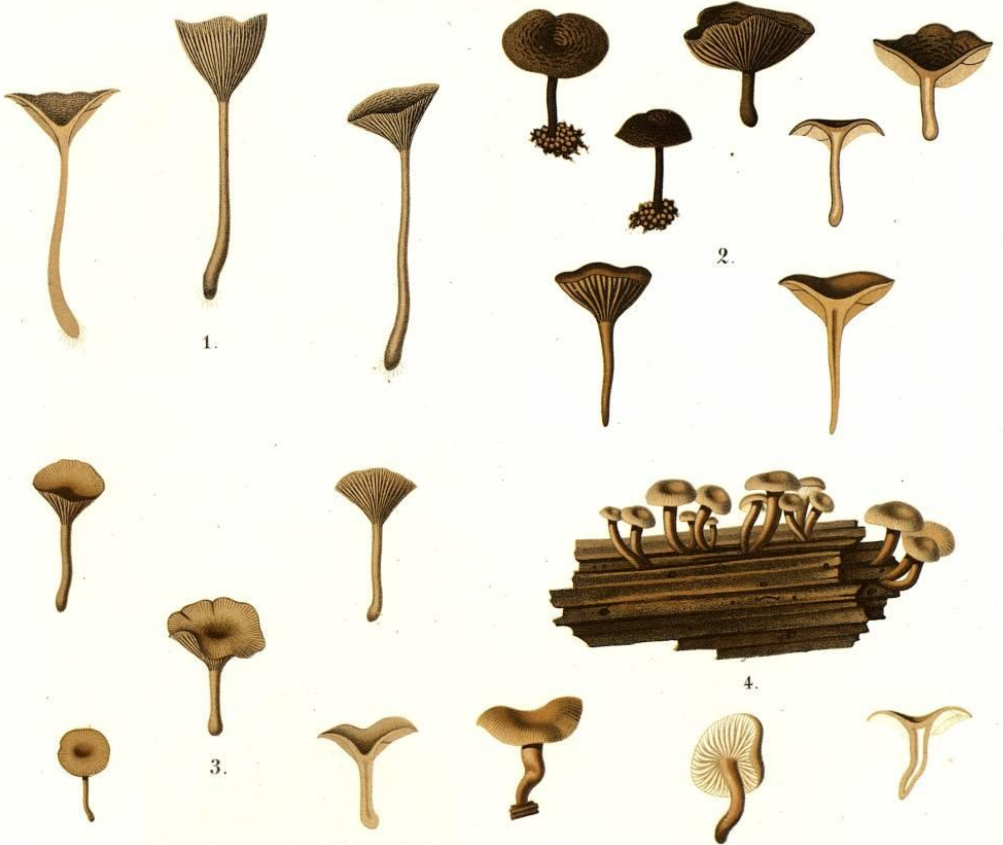
1. AGARICUS (OMPHALIA) PHILONOTIS LASCH.