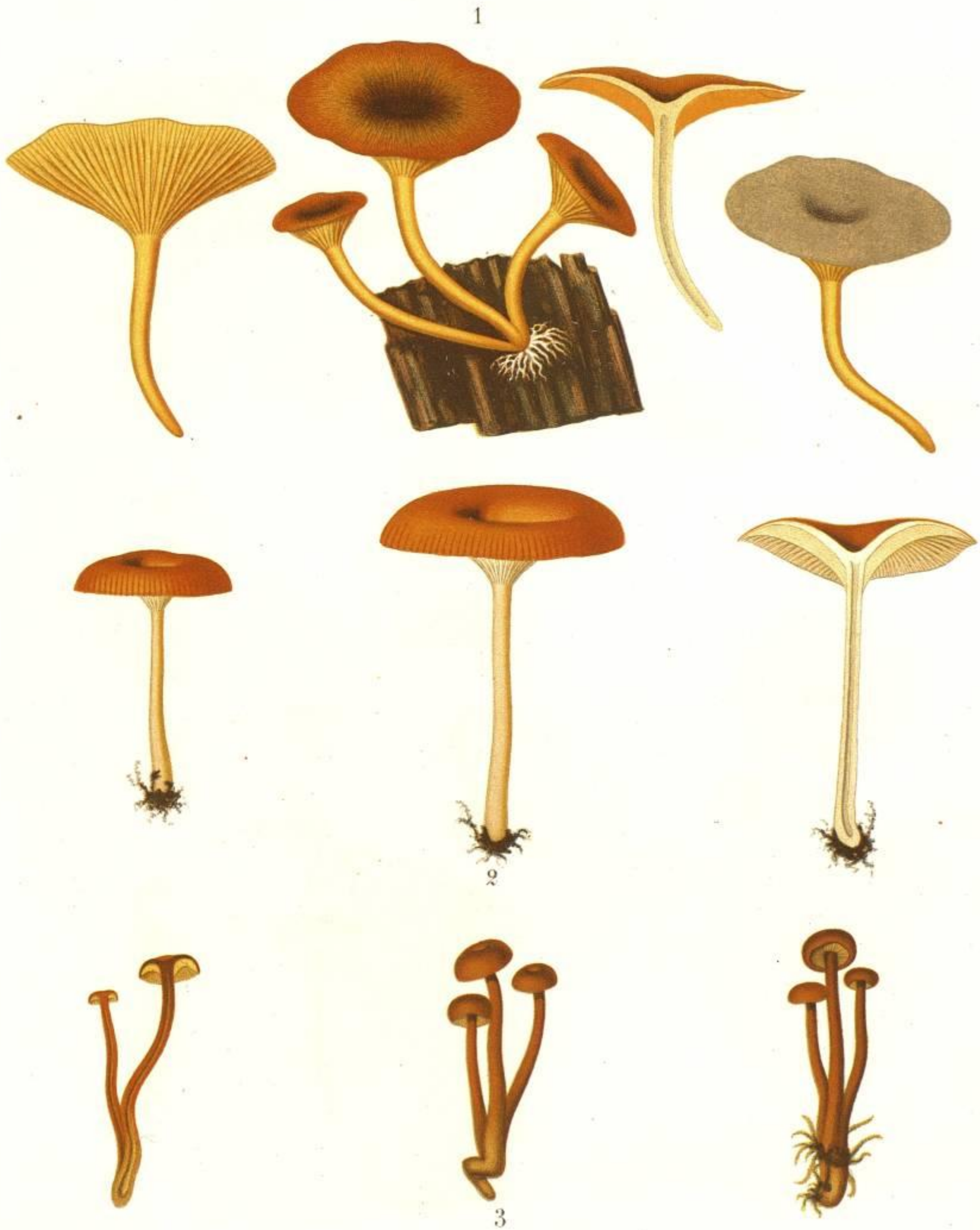
1. AGARICUS (OMPHALIA) CHRYSOPHYLLUS FR. 2. AGARICUS (OMPHALIA) POSTII FR. 3. AGARICUS (OMPHALIA) LAESTADII FR.