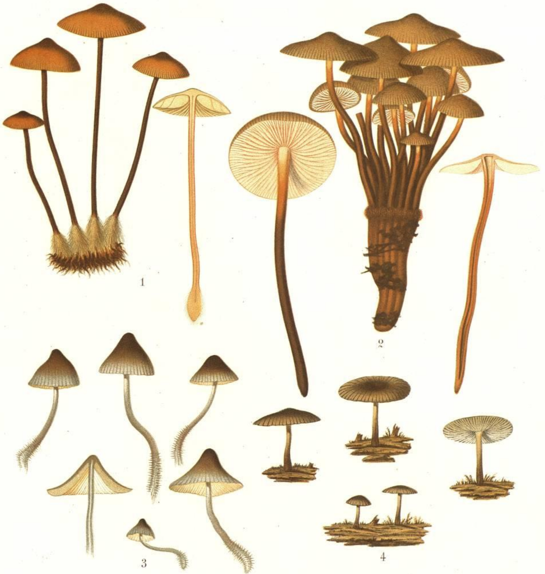
1. AGARICUS (MYCENA) COHAERENS FR. 2. AGARICUS (MYCENA) GALERICULATUS v. CALOPUS FR. 3. AGARICUS (MYCENA) PARABOLICUS FR. 4. AGARICUS (MYCENA) TINTINABULUM FR.