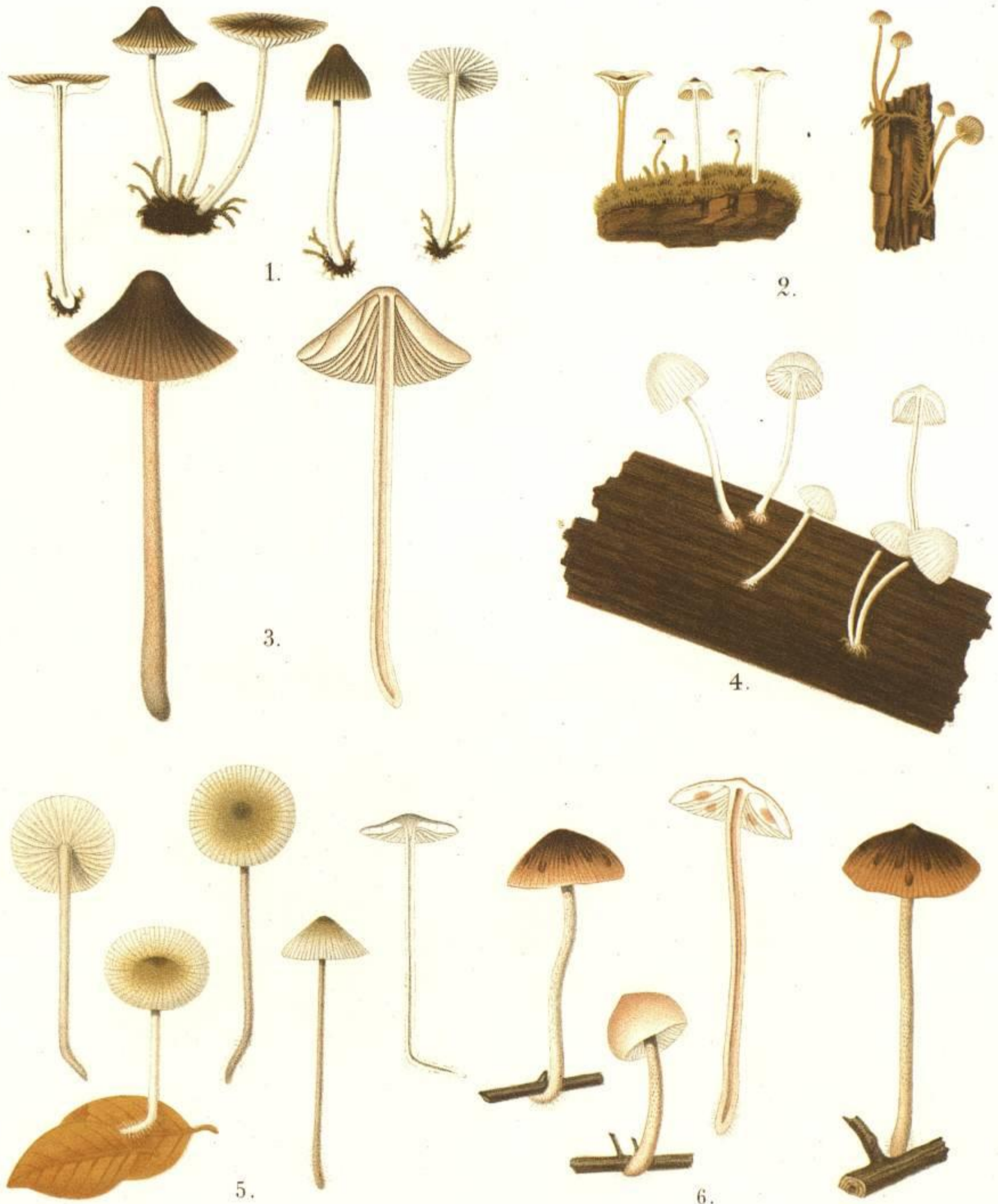
1. AGARICUS (OPHALIA) GRISEUS. FR. 2. AGARICUS (MYCENA) SPEIREUS. FR. 3. AGARICUS (MYCENA) ATROMARGINATUS. FR. 4. AGARICUS (MYCENA) RUBROMARGINATUS. FR. 5. AGARICUS (MYCENA) LINEATUS. FR. 6. AGARICUS (MYCENA) ZEPHIRUS. FR.