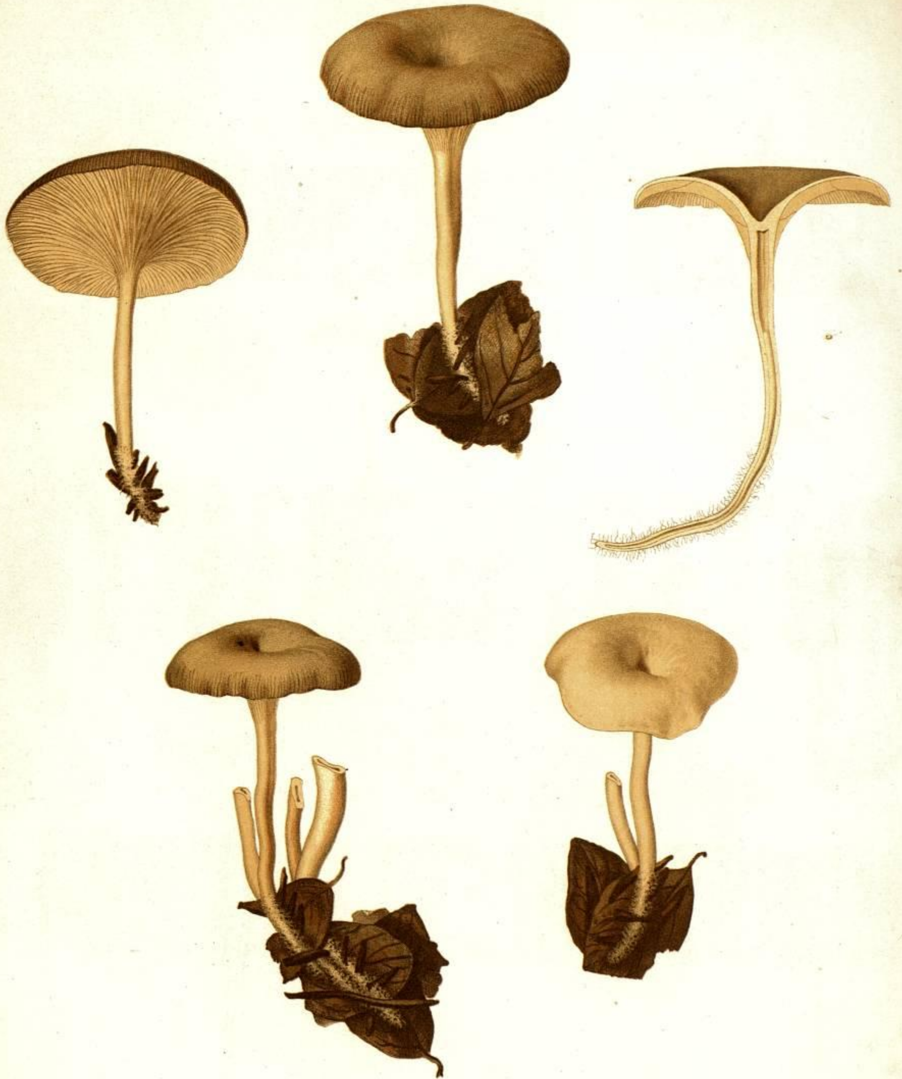
AGARICUS (OMPHALIA) HYDROGRAMMUS FR.