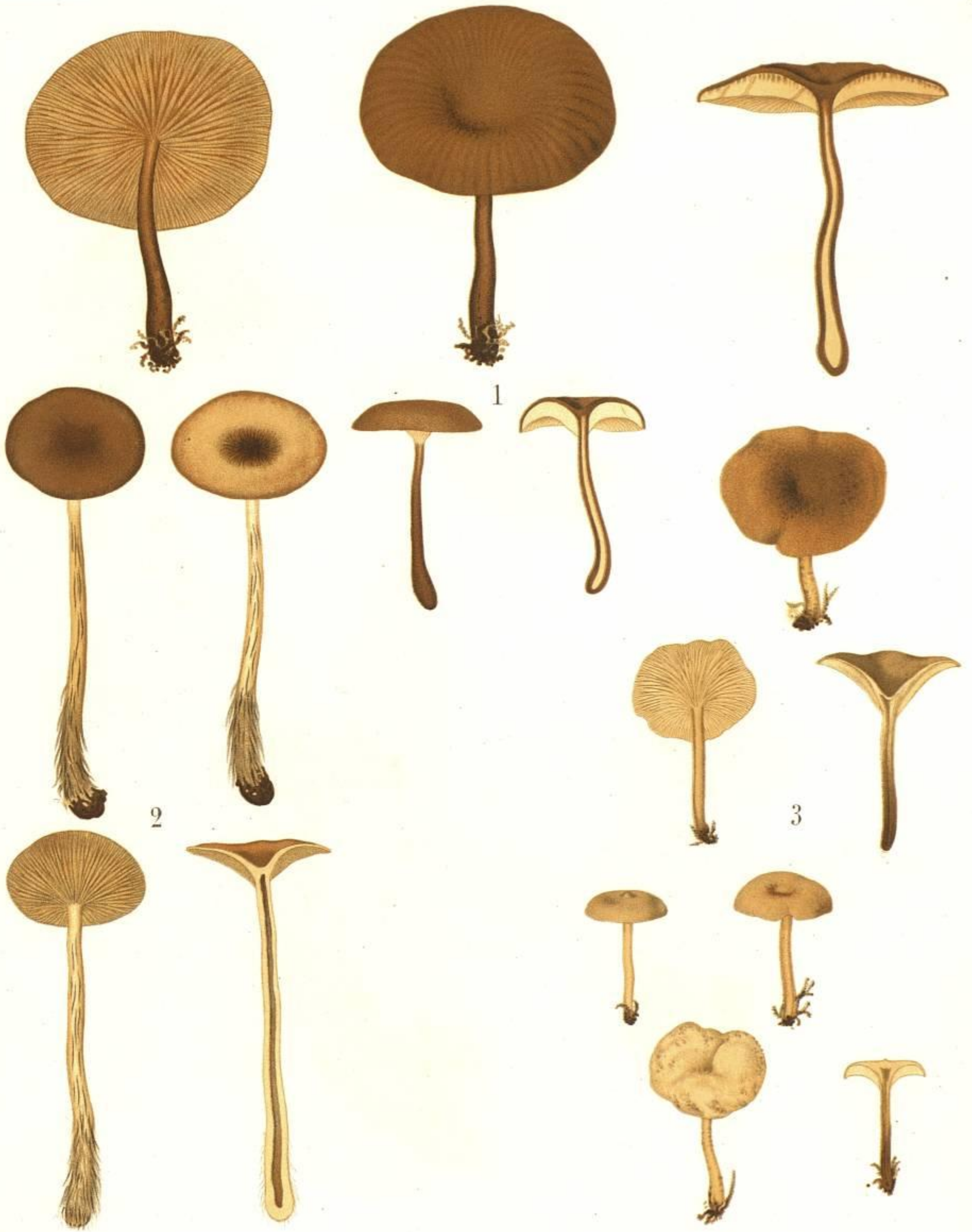
1. AGARICUS (OMPHALIA) DUMOSUS FR. 2. AGARICUS (OMPHALIA) LITUUS FR. 3. AGARICUS (OMPHALIA) OFFUCIATUS. FR.