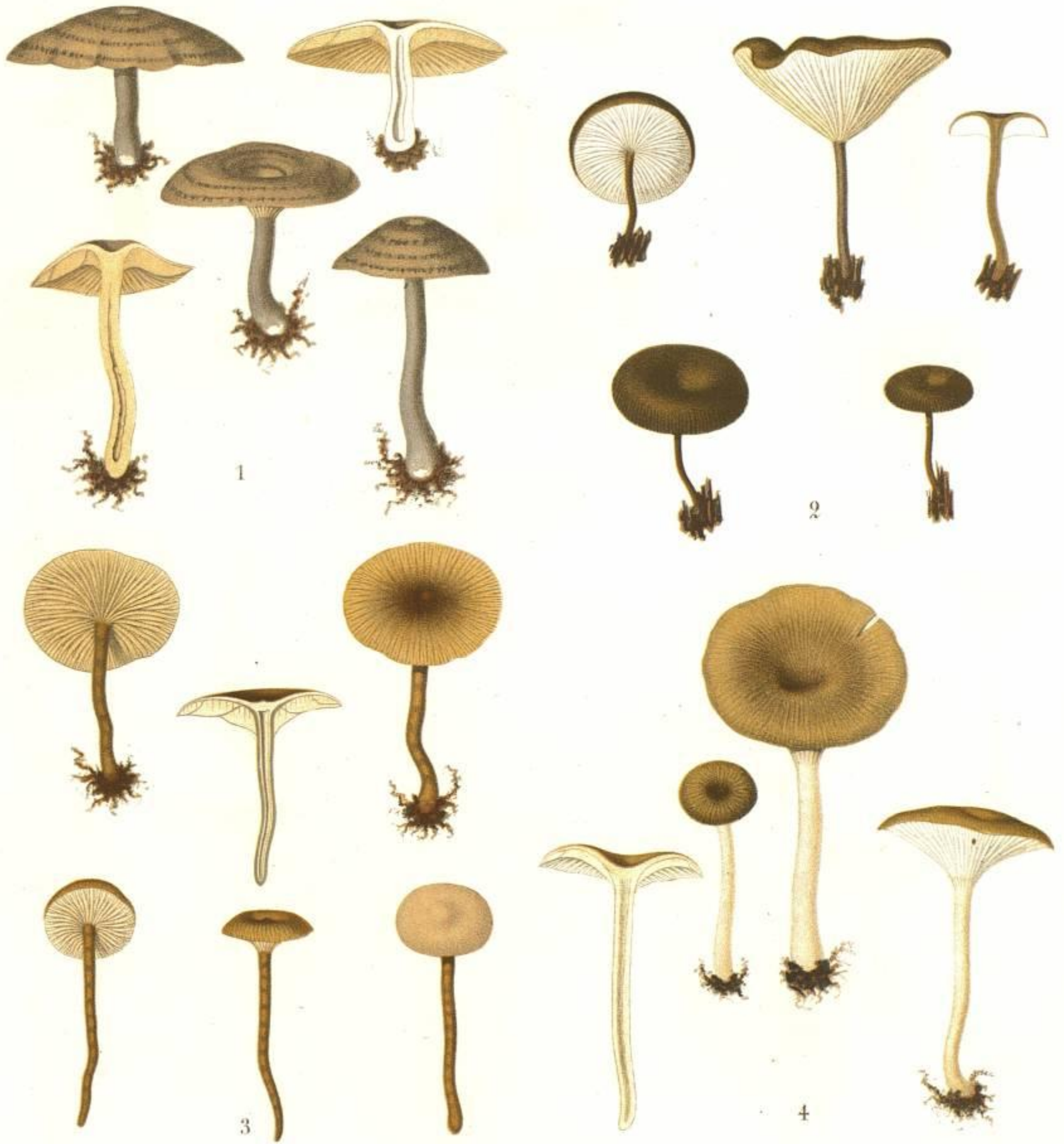
1. AGARICUS (OMPHALIA) DETRUSUS FR. 2. AGARICUS (OMPHALIA) MAURUS FR. VAR. 3. AGARICUS (OMPHALIA) STRIIPILEUS FR. 4. AGARICUS (OMPHALIA) LEUCOPHYLLUS FR.