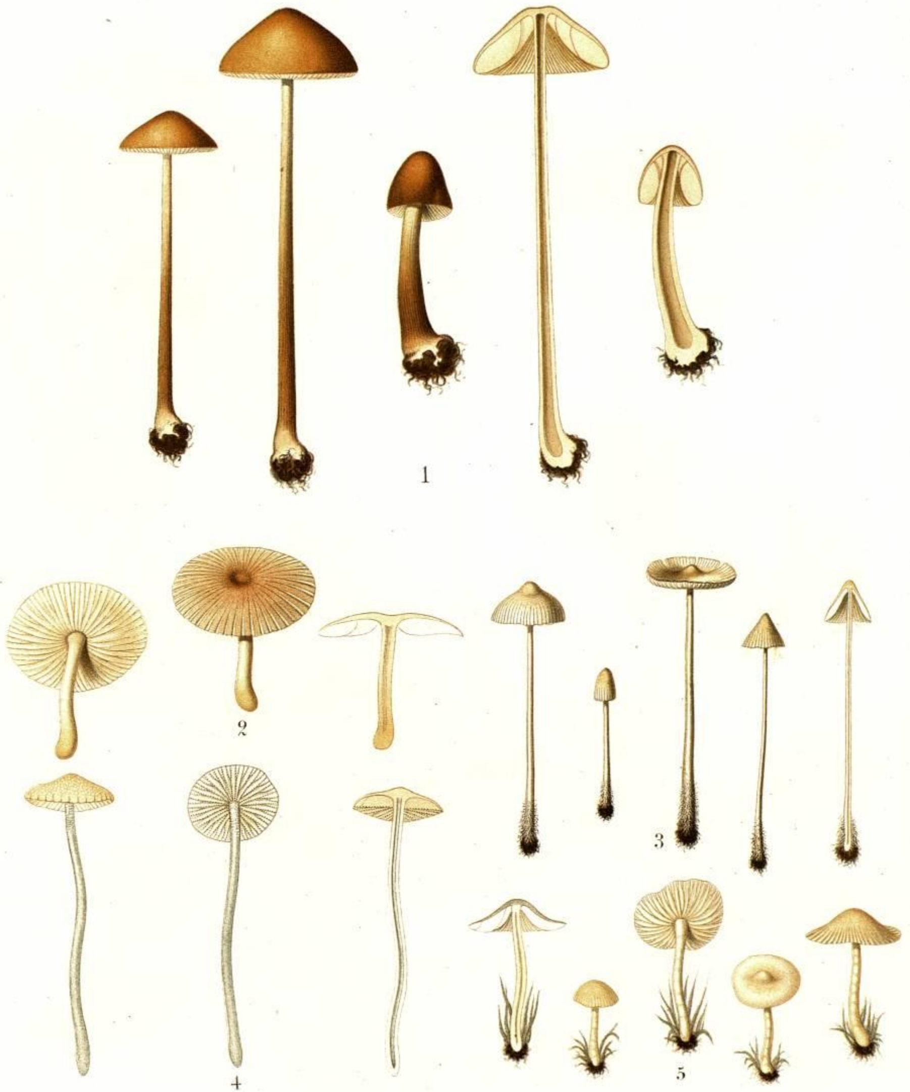
1. AGARICUS (MYCENA) CALEROPSIS FR. n.sp. 2. AGARICUS (MYCENA) BENZONII FR. 3. AGARICUS (MYCENA) LACTEUS FR. 4. AGARICUS (MYCENA) FARREUS FR. 5. AGARICUS (MYCENA) FLAVO-ALBUS FR.