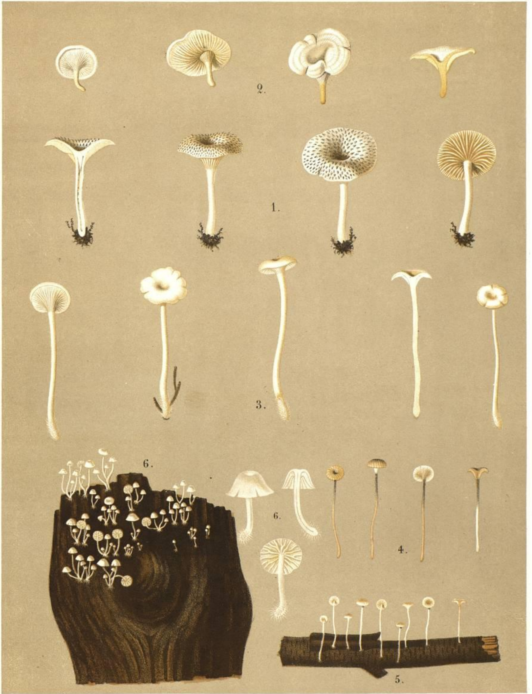
1. AGARICUS (OMPHALIA) AFFRICATUS FR. 2. AGARICUS (OMPHALIA) SCYPHOIDES FR. 3. AGARICUS (OMPHALIA) SCYPHIFORMIS FR. 4. AGARICUS (OMPHALIA) SETIPES VAR. FR. 5. AGARICUS (OMPHALIA) GRACILLIMUS WEINM. 6. AGARICUS (OMPHALIA) INTEGRELUS. PERS.