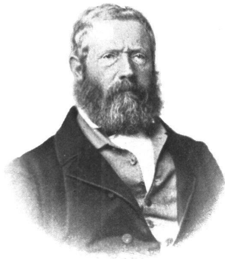
Gustav Otth 1806—1874