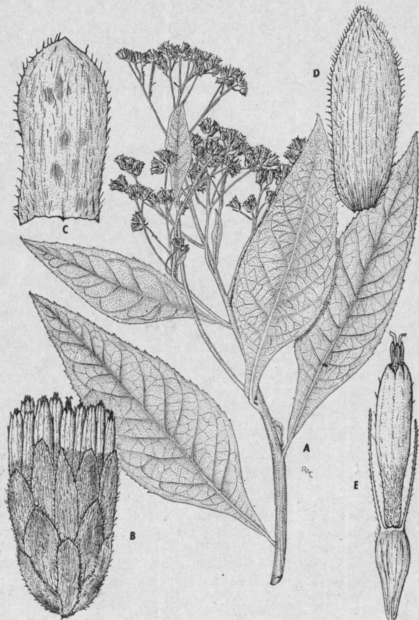
Fig. 1. — Verbesina cajamarcensis Sagást.: A, rama, \times 1/2 ; B, capítulo, \times 6 ; C, bráctea involucrel externa, \times 15 ; D, bráctea involucrel interna; \times 10 ; E, flor, \times 8 .