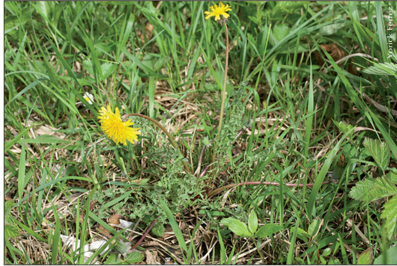
▲ Taraxacum tortilobum