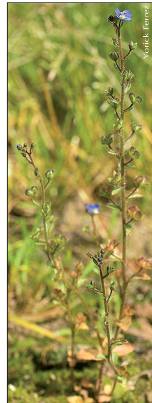
▶ Veronica acinifolia