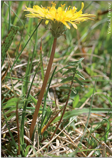
▲ Taraxacum rubicundum