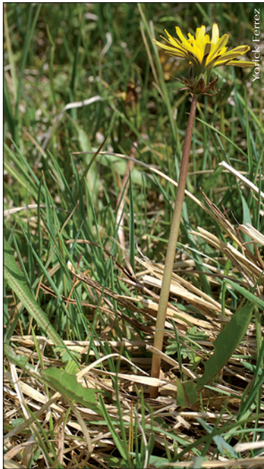
▼ Taraxacum odiosum