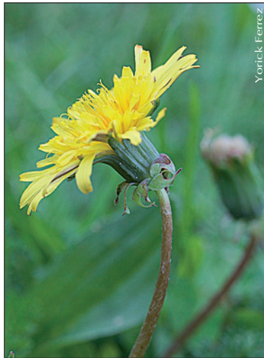
▲ Taraxacum lacistophyllum

beaucoup à l'espèce précédente, mais s'en différencie par ses pédoncules et ses bractées involucales devenant pourpre foncé. Il s'en différencie également par son écologie nettement plus mésophile. Il s'observe typiquement sur les talus au bord des routes traversant les massifs forestiers. Les données actuelles ne permettent pas de préciser son degré de menace en Franche-Comté (DD).