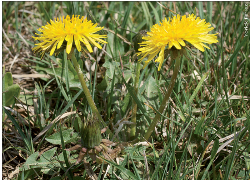
▼ Taraxacum prionum