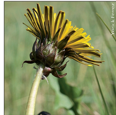
▲ Taraxacum multilepis