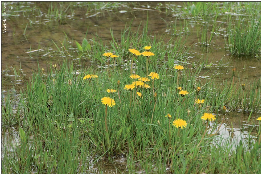
▲ Taraxacum udum