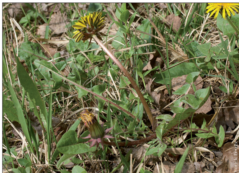
▶ Taraxacum puniceum