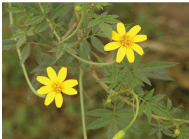
Figura 1. Tagetes lacera Brandege en floración.