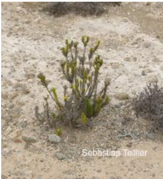
Figura 2: Planta de Gutierrezia taltalensis