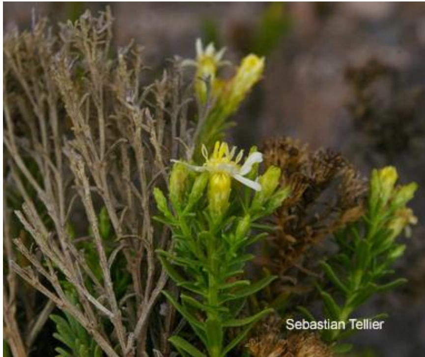
Figura 1: Ramita y flor de Gutierrezia taltalensis Phil.