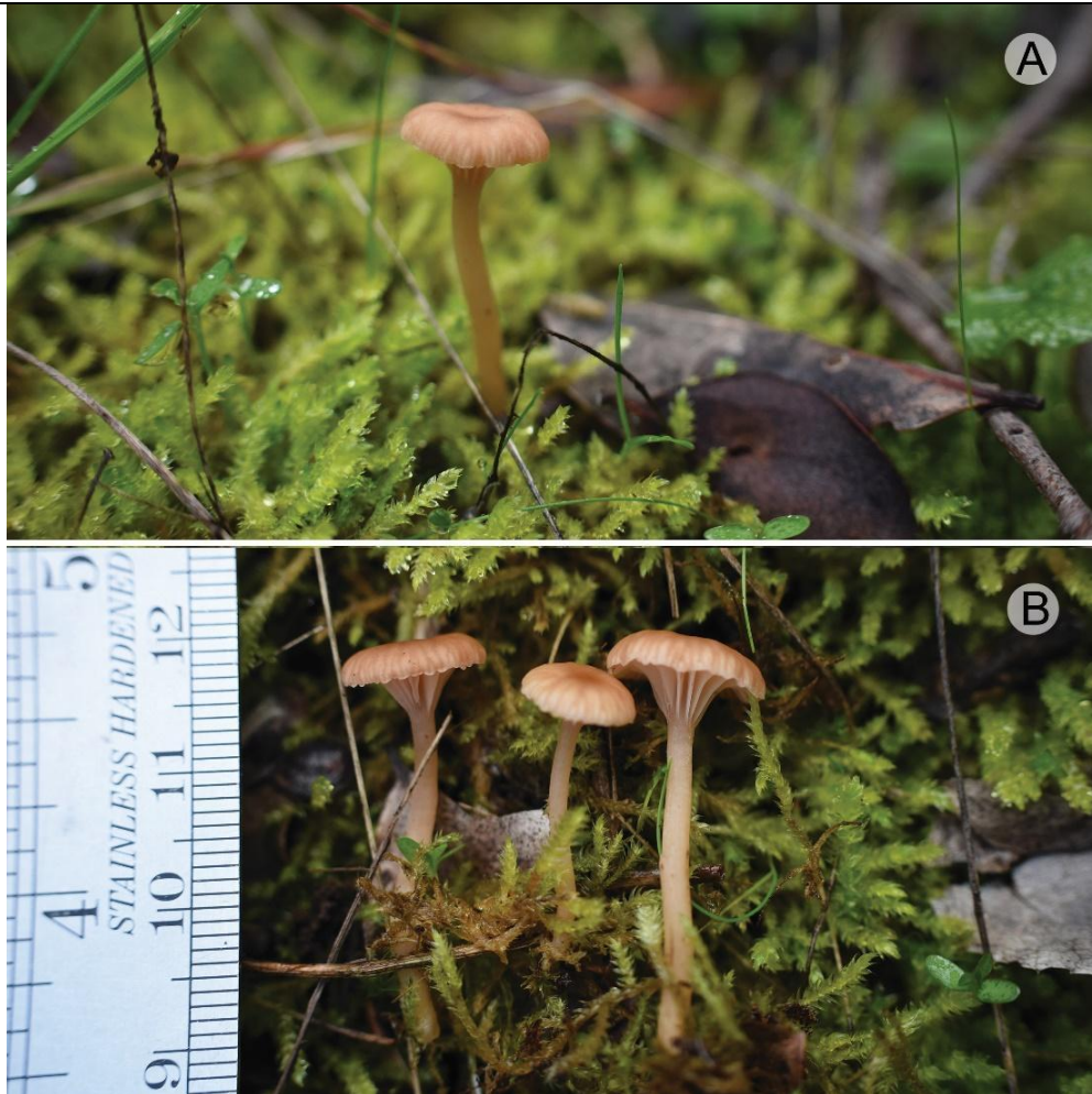
Figura 1: Registros fotográficos en el Cerro Poqui, A) vista lateral en su ambiente natural, y B) escala de tamaño con ejemplares colectados.