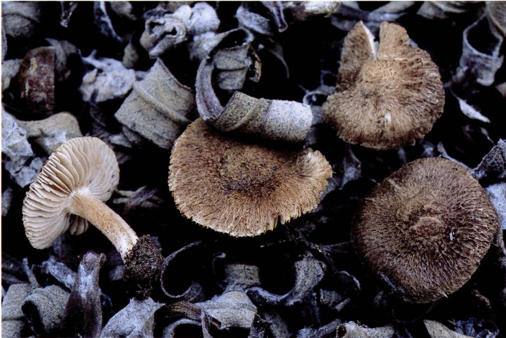
Inocybe rocabrunae Esteve-Rav. et Vila