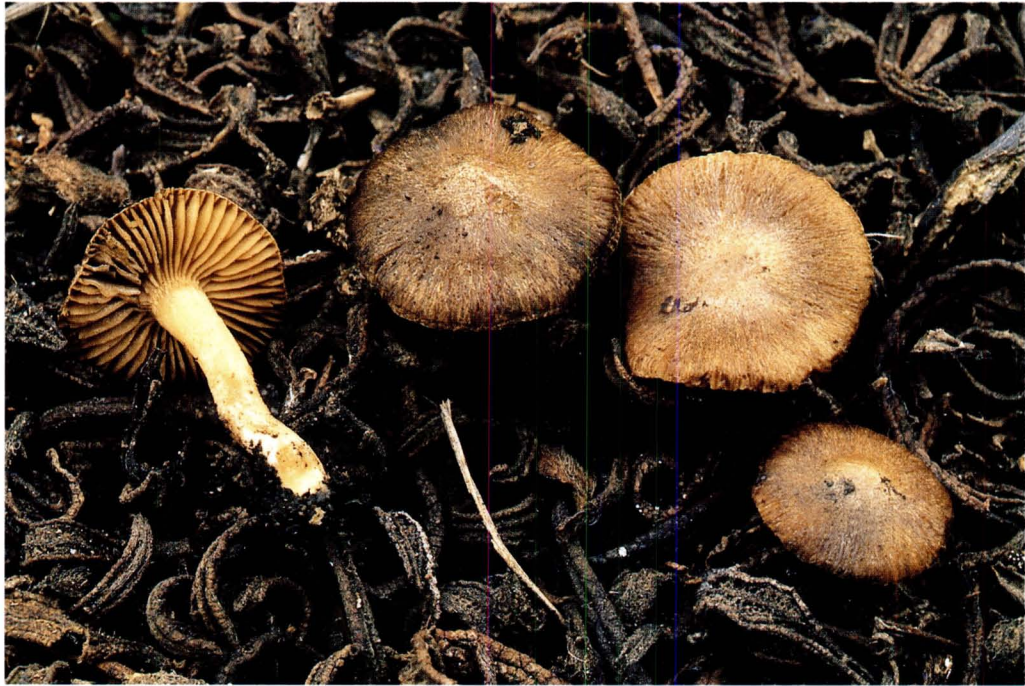
Inocybe aurantiifolia Beller