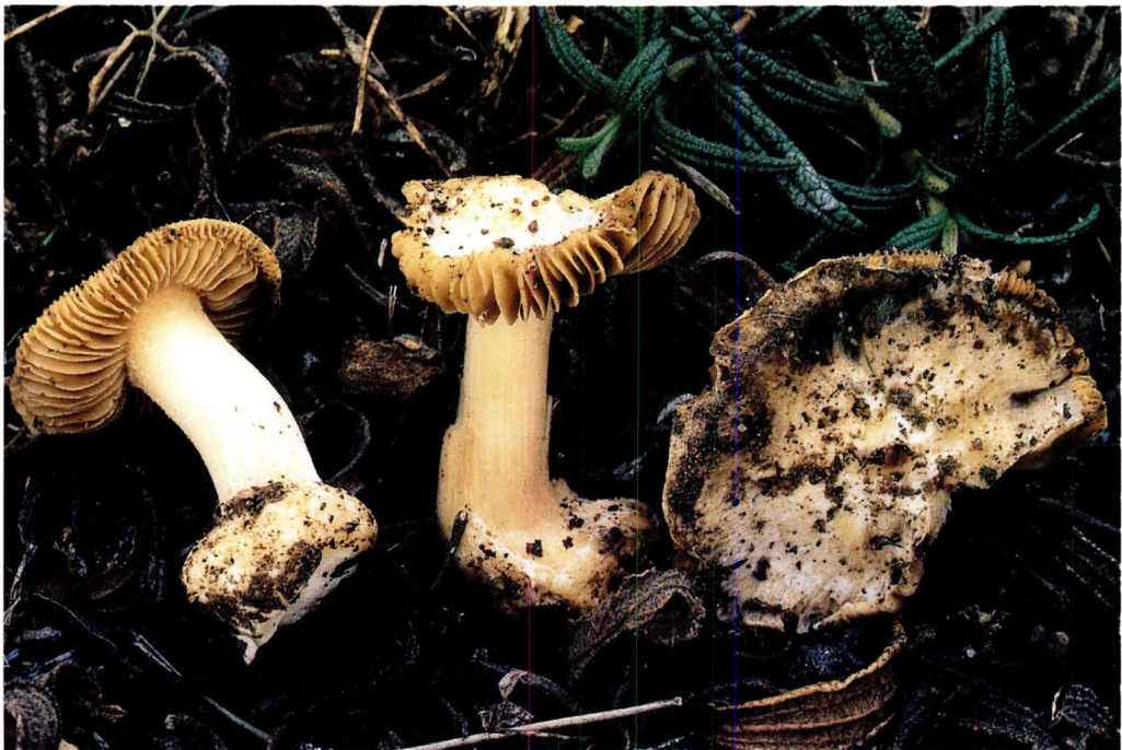
Inocybe cistobulbipes Esteve-Rav. et Vila