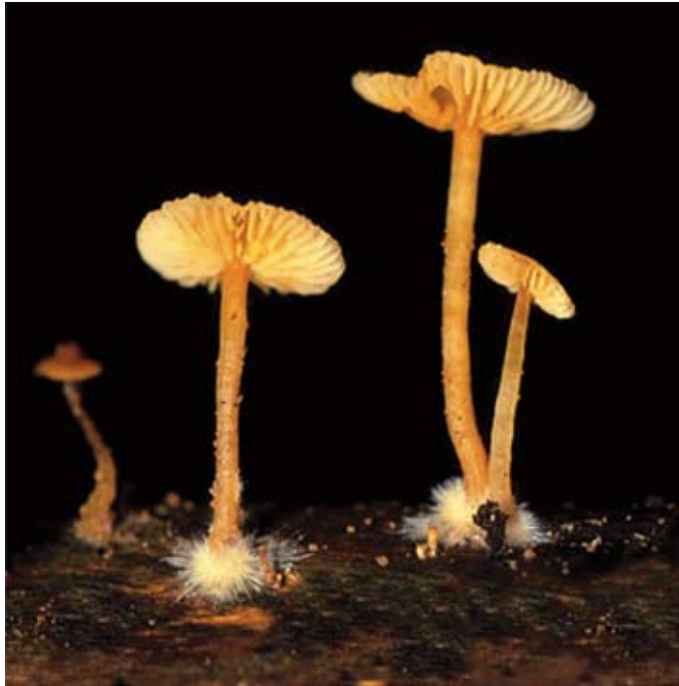
Fig. 2. Basidiomas de Gymnopilus tuxtlenensis en la región de El Tuito, Jalisco.

Venezuela, Estado Guarico, aprox. 45 km S-SW de Calabozo, Fondo Pecuario Masaguaral, agosto 3, 1980, C. Ovrebo 1182-A (F); agosto 17, 1980, C. Ovrebo 1215-A (F-1059160).