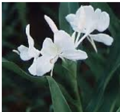
Figura 14: Hedychium coronarium Figures 14: Hedychium coronarium