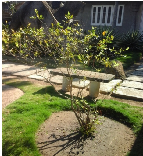
Figures 3: Psidium salutare