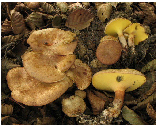
Pieds de Gyrodon lividus .

La présence de ce bolet témoigne d'un assèchement progressif et d'une eutrophisation de l'aulnaie marécageuse.