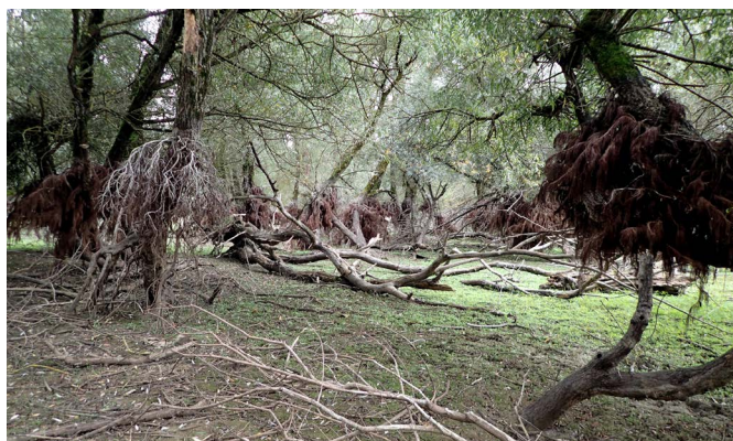
Lentinus tigrinus (en haut) et son habitat (en bas).