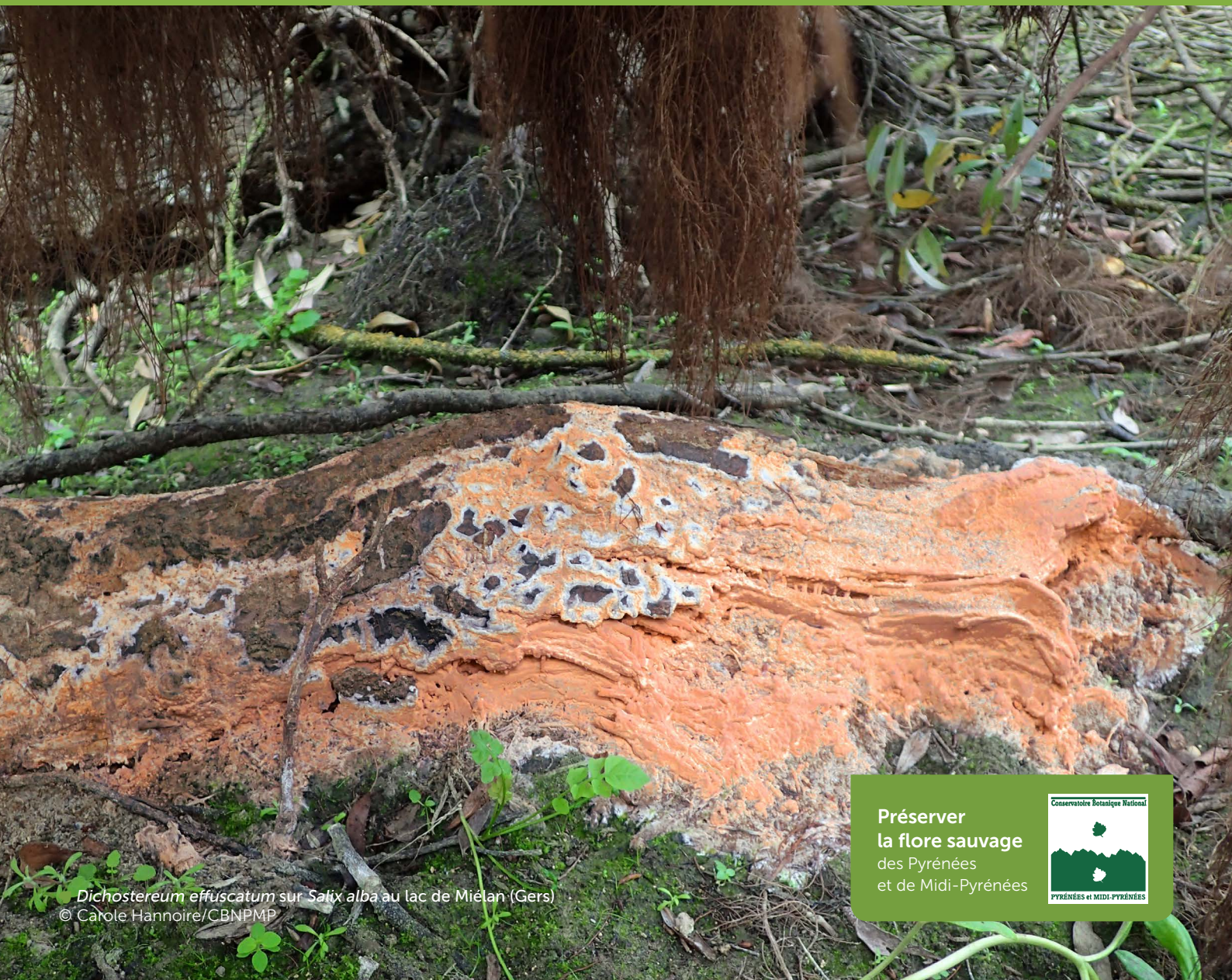
Dichostereum effuscatum sur Salix alba au lac de Miélan (Gers)

Ce sont des centaines d'espèces de champignons qui occupent de nombreuses niches écologiques au niveau des rives inondables des retenues collinaires : directement sur la vase ou dans le sable, sur des plantes vivantes ou mortes (bryophytes, herbacées), dans la litière ou l'humus, sur le bois mort ou l'écorce des arbres, ils contribuent à la décomposition de la matière organique. Les secteurs boisés apportent un cortège important d'espèces symbiotiques souvent spécifiques, liées aux saules, peupliers et à l'aulne glutineux, avec lesquels elles constituent des mycorhizes, indispensables à l'installation et la survie de ces arbres dans des sols à forte contrainte d'engorgement. Cette fiche présente une sélection de quelques espèces représentatives et faciles à reconnaître, occupant différents niveaux des rives (2 mois à plus de 6 mois d'exondation).