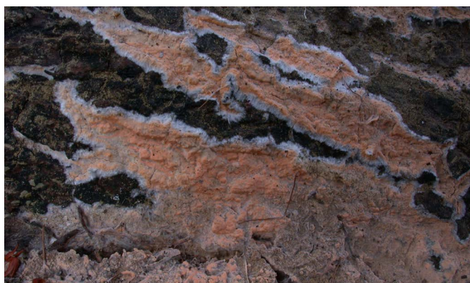
Habitat à Dichostereum effusatum (en haut) et D. effusatum en vue rapprochée (en bas).