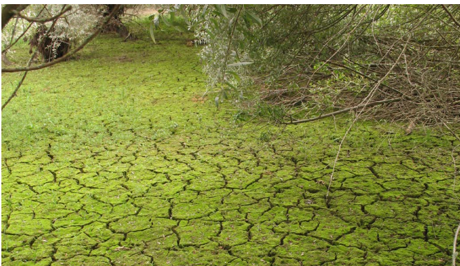
Entoloma lilacinroseum (en haut) et son habitat (en bas).

Cette fiche a été réalisée par Carole Hannoire, Gilles Corriol avec la participation de Béatrice Morisson / Conservatoire botanique national des Pyrénées et de Midi-Pyrénées, dans le cadre du programme « Amélioration de la connaissance de la flore, la fonge et les habitats naturels sur le territoire de la plaine de Midi-Pyrénées » retenu par l'appel à projets sur l'amélioration et la valorisation des connaissances sur la biodiversité, cofinancé par la Région et l'Union européenne dans le cadre du PO FEDER Midi-Pyrénées Garonne 2014-2020.