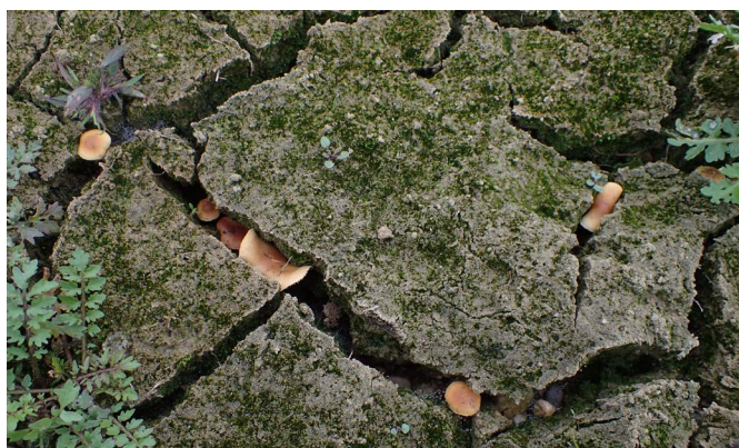
Pholiota conissans var. graminis (en haut) et son habitat (en bas).