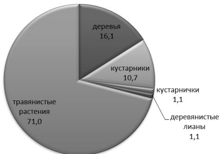
Рисунок 2 – Количественное соотношение (%) жизненных форм растений, пораженных выявленными микромицетами

Хозяева фитопатогенов отнесены к 15 видам деревьев (16,1%), 10 видам кустарников (10,7%), 1 виду кустарничков (1,1%), 1 виду деревянистых лиан (1,1%) и 66 видам травянистых растений (71,0%) (рис. 2).