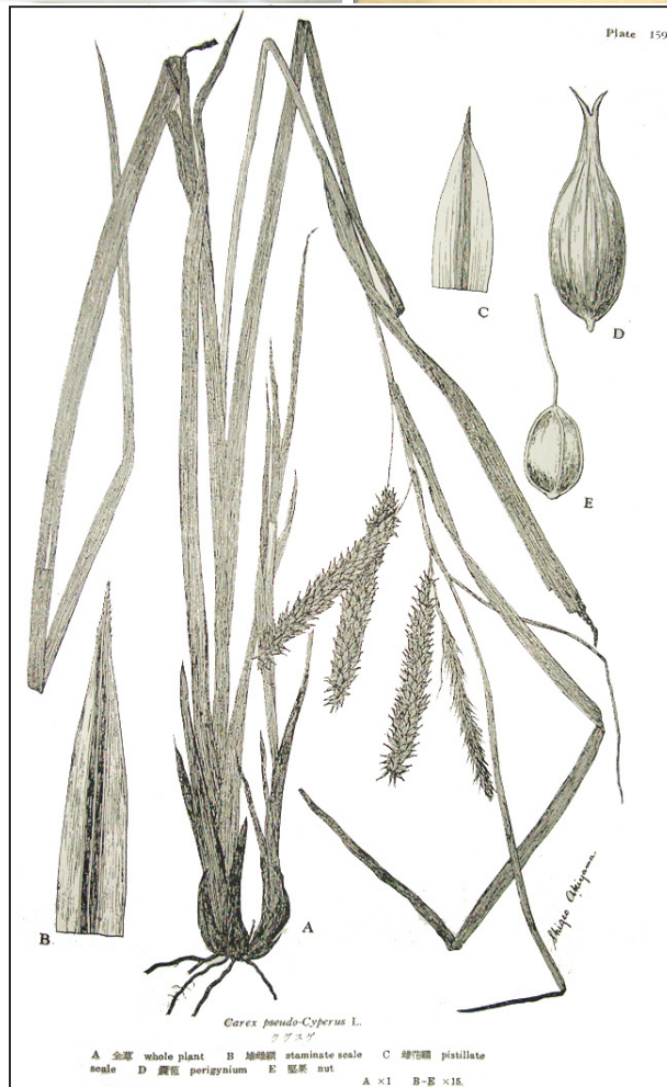
口絵 2: ケグスゲ Carex pseudo-cyperus の 図版と標本