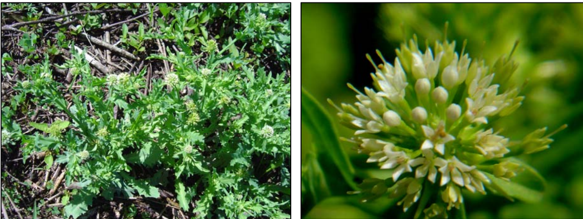
a. Aspecto general