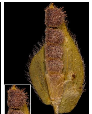
30 Zornia sericea