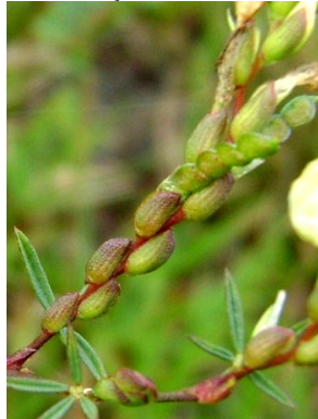
12 Zornia guanipensis