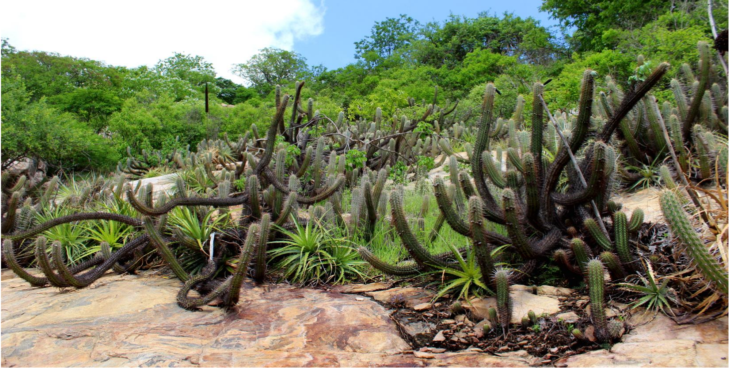
Afloramento rochoso em Savana Estépica (Caatinga) Rocky outcrops in the Stepic Savanna (Caatinga)

[fieldguides.fieldmuseum.org] [1190] version/versão 1 9/2019