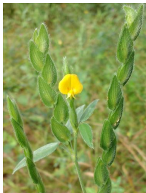
27 Zornia sericea