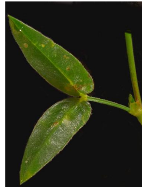
19 Zornia latifolia