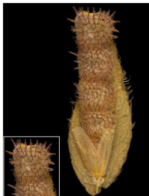
26 Zornia reticulata