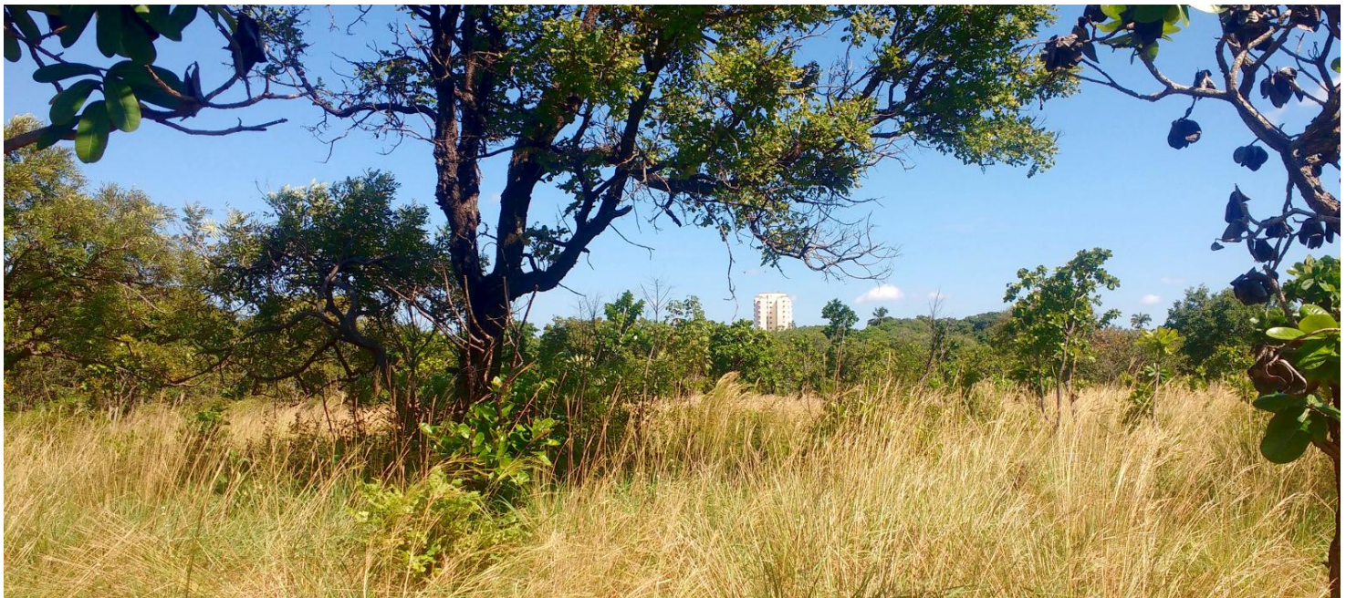
Fragmento de Savana (Cerrado) em Fortaleza, CE Fragment of Savanna (Cerrado) in Fortaleza, CE