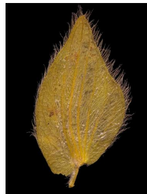
29 Zornia sericea