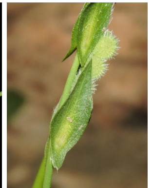
25 Zornia reticulata