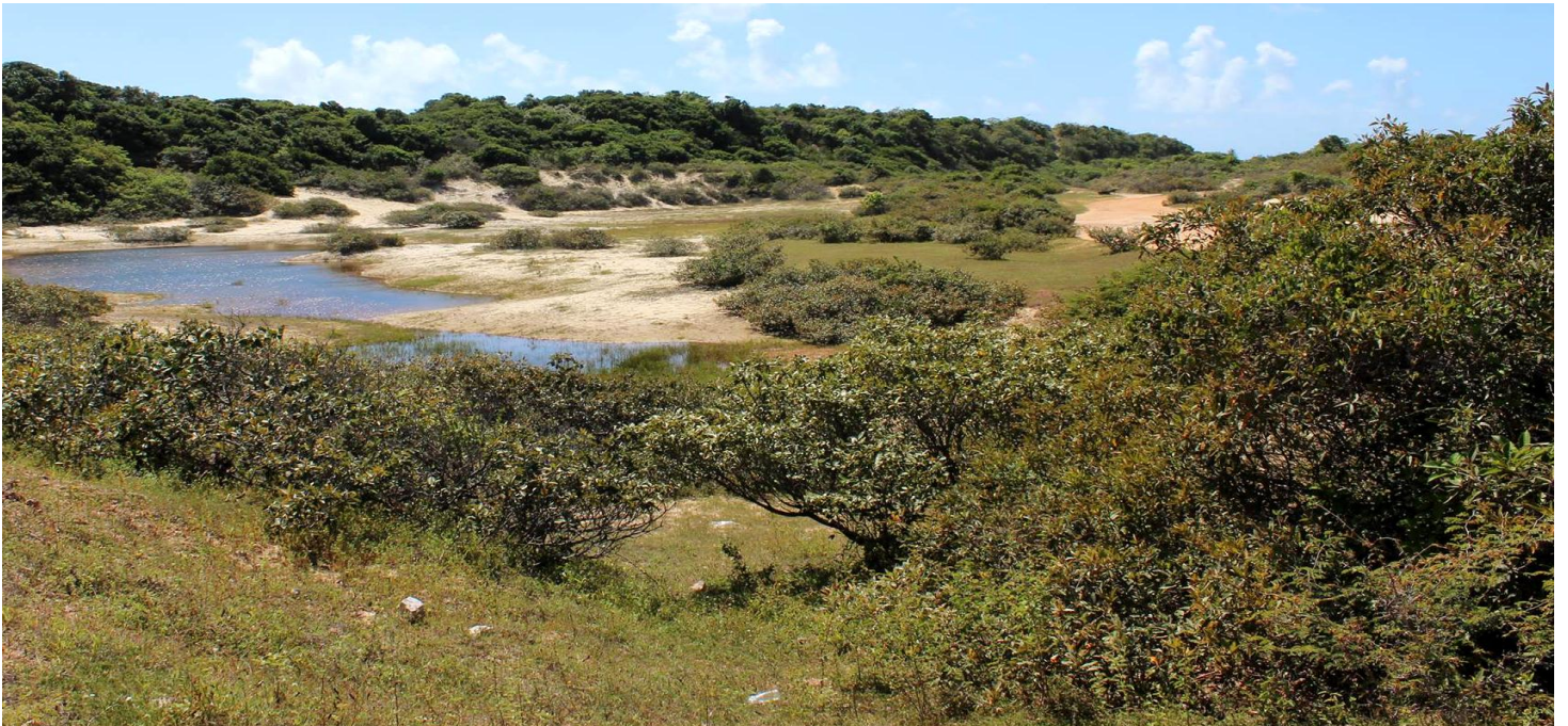
Floresta Estacional Semidecidual de Terras baixas (Mata sobre Tabuleiro Costeiro) Semi-deciduous Lowland Forest (“Coastal Tableland”)