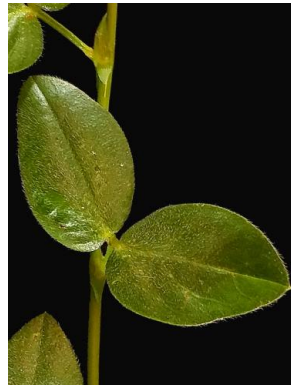
18 Zornia latifolia