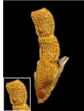
14 Zornia guanipensis