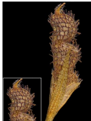
23 Zornia leptophylla