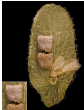
16 Zornia harmsiana