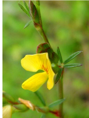
13 Zornia guanipensis