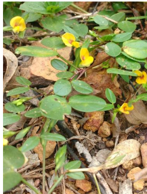
17 Zornia latifolia