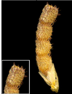
11 Zornia curvata