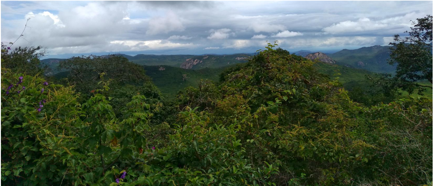
Floresta Estacional Decídua (Mata Seca) Deciduous Forest (Mata Seca)

[fieldguides.fieldmuseum.org] [1190] version/versão 1 9/2019