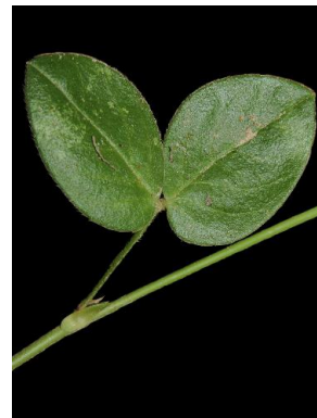
24 Zornia reticulata