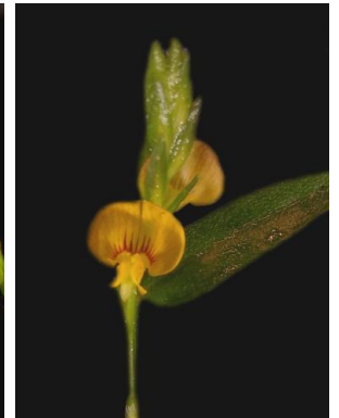
20 Zornia latifolia