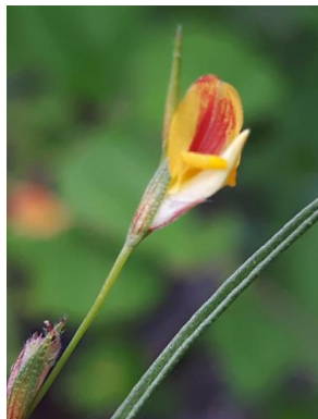
22 Zornia leptophylla