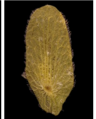
15 Zornia harmsiana