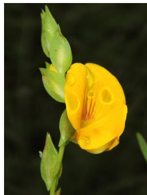
28 Zornia sericea