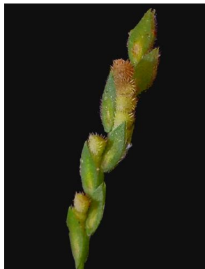
21 Zornia latifolia