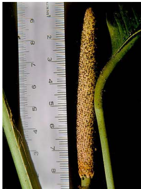
31 Rhodospatha sp. nov.