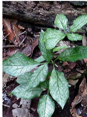
8 Asterostigma lusnathianum