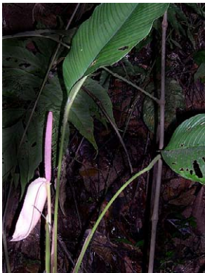
30 Rhodospatha sp. nov.