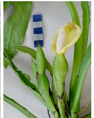
34 Syngonium vellozianum