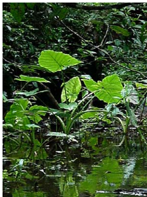
36 Xanthosoma maximiliani