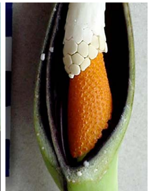
39 Xanthosoma maximiliani