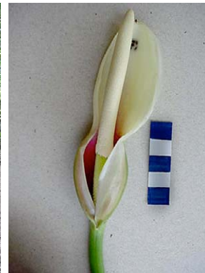
28 Philodendron vargealtense