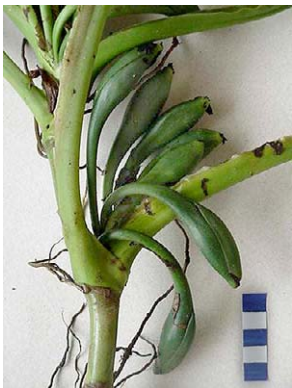
35 Syngonium vellozianum