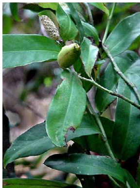
12 Heteropsis salicifolia