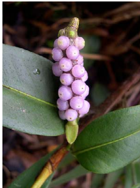
7 Anthurium scandens