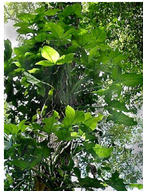
32 Syngonium vellozianum