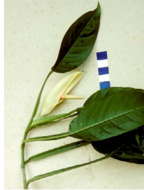
22 Philodendron propinquum