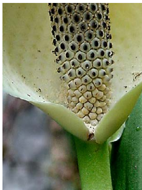
17 Monstera adansonii