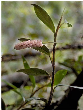
5 Anthurium scandens