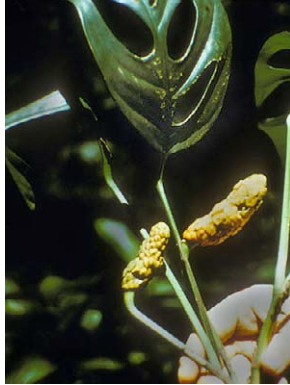
21 Monstera praetermissa