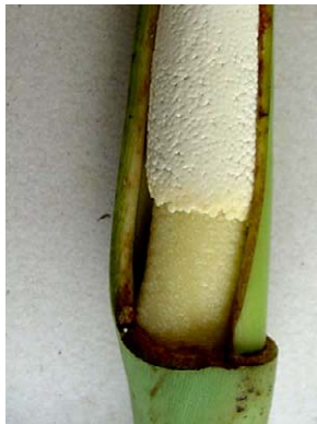
26 Philodendron speciosum