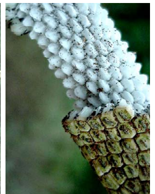
19 Monstera adansonii