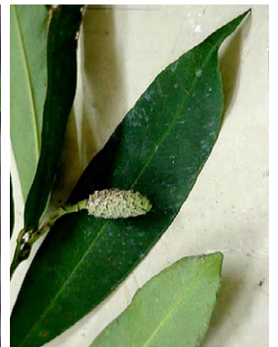
14 Heteropsis salicifolia