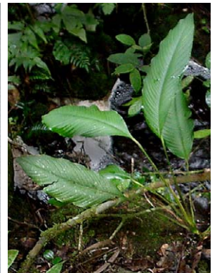
29 Rhodospatha sp. nov.