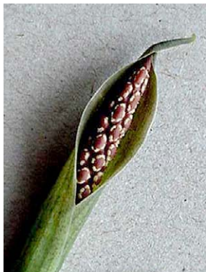
10 Asterostigma lusnathianum