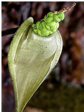
11 Asterostigma lusnathianum