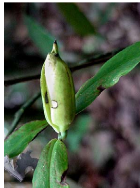
13 Heteropsis salicifolia