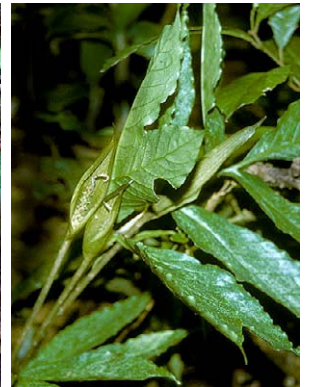
9 Asterostigma lusnathianum