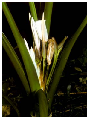
37 Xanthosoma maximiliani