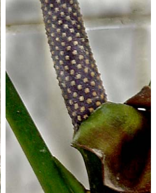
4 Anthurium pentaphyllum