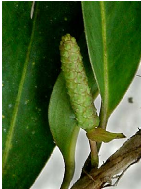
6 Anthurium scandens