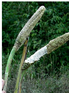
18 Monstera adansonii