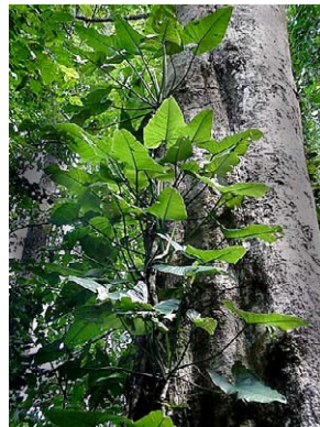
27 Philodendron vargealtense