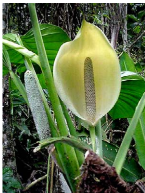
16 Monstera adansonii