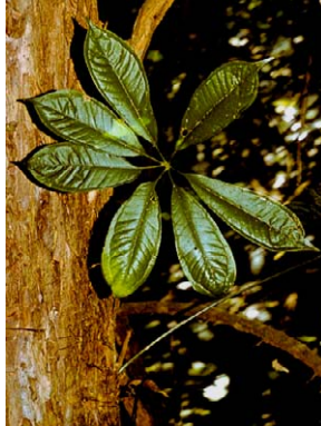
2 Anthurium pentaphyllum