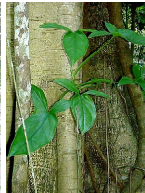
33 Syngonium vellozianum