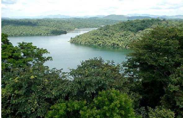
1 Vista da Lagoa Dom Helvécio no Parque Estadual Rio Doce, Minas Gerais

© Lívia Godinho Temponi (liviatemponi@yahoo.com.br) Instituto de Biologia Vegetal, Universidade Federal de Viçosa, Minas Gerais, Brasil. Apoio Fundação O Boticário/MacArthur Foundation © Environmental & Conservation Programs, The Field Museum, Chicago, IL 60605 USA. [RRC@fmnh.org] [www.fmnh.org/plantguides] Rapid Color Guide # 210 versão 1 12/2006