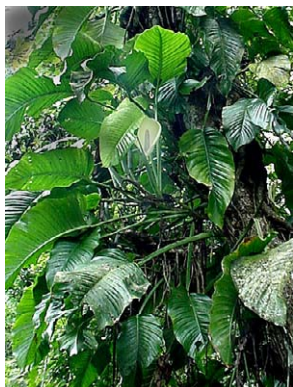
15 Monstera adansonii