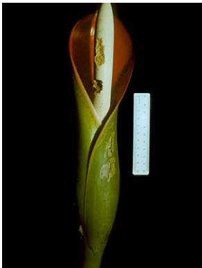
25 Philodendron speciosum