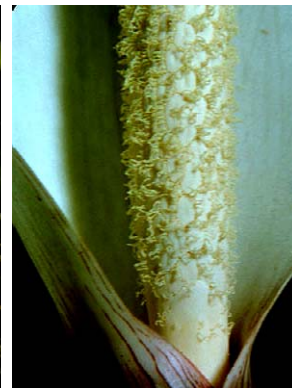
38 Xanthosoma maximiliani