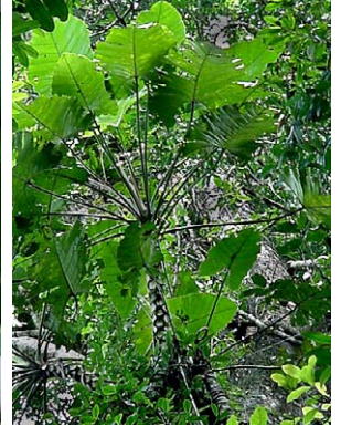
24 Philodendron speciosum