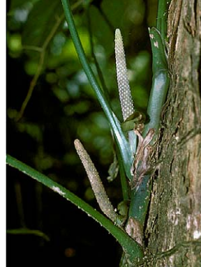
3 Anthurium pentaphyllum