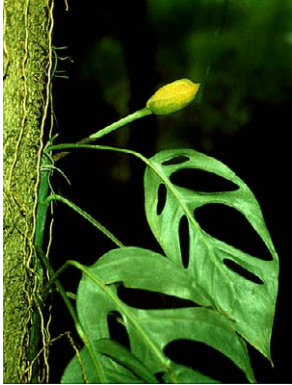
20 Monstera praetermissa