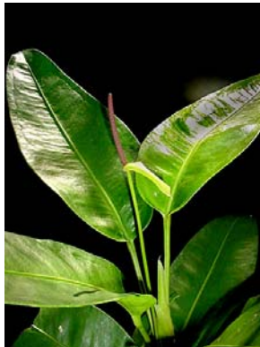
27 A. parasiticum