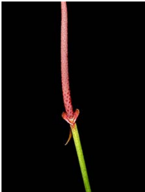
11 A. ianthinopodum