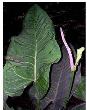
40 A. xanthophylloides