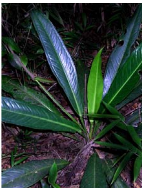
36 A. sellowianum