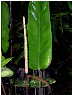
17 A. longipes