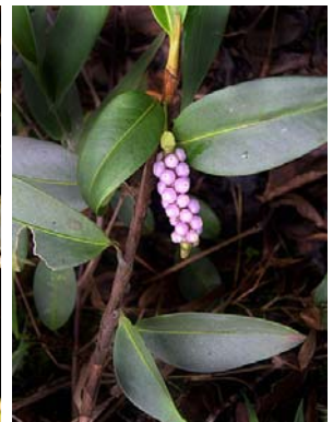
35 A. scandens