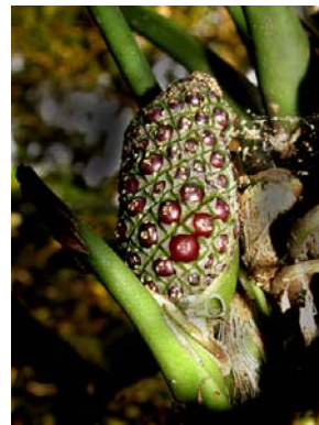
34 A. pentaphyllum