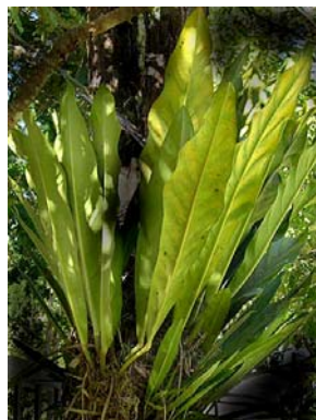
38 A. solitarium