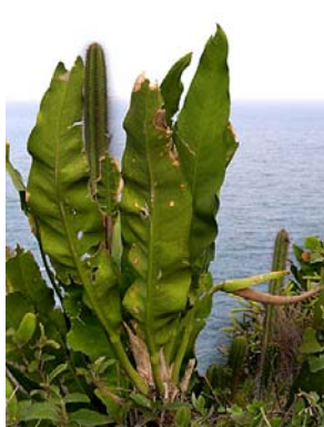
7 A. coriaceum