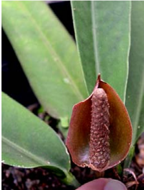
6 A. cleistanthum