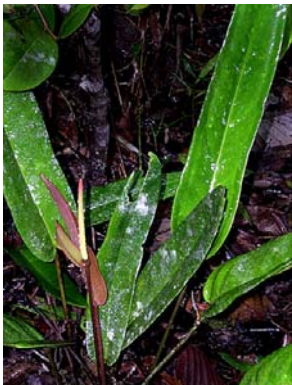
16 A. longipes