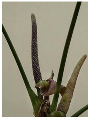
33 A. pentaphyllum