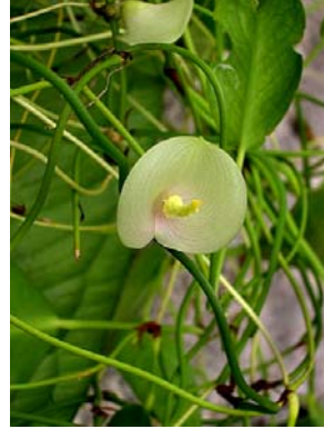
4 A. bromelicola