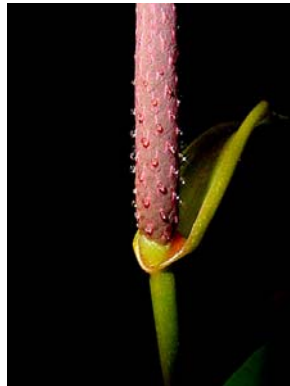
28 A. parasiticum