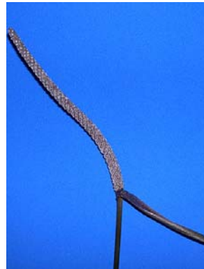
14 A. jureianum