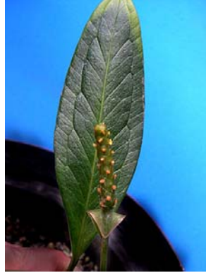
3 A. bellum