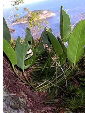
24 A. microphyllum