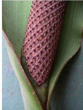
8 A. coriaceum