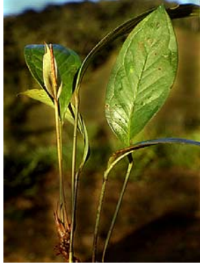
2 A. bellum