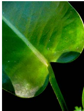
18 A. luschnathianum