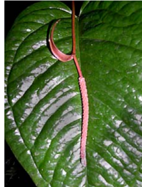
9 A. hoehnei