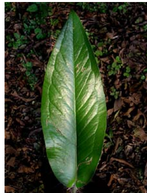
19 A. malyi