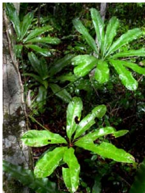
32 A. pentaphyllum