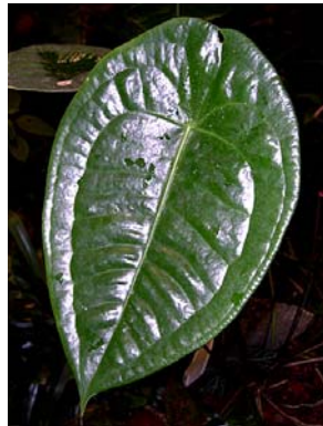
13 A. jureianum