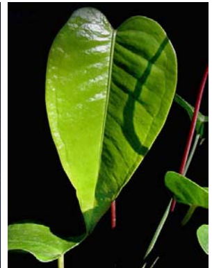
30 A. parvum