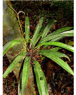
10 A. ianthinopodum