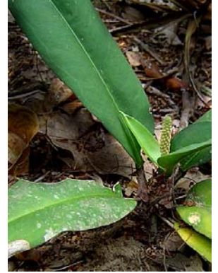
5 A. cleistanthum