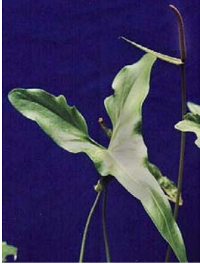
1 A. acutum

© Environmental & Conservation Programs, The Field Museum, Chicago, IL USA. [www.fnmh.org/plantguides] [rre@fieldmuseum.org] Rapid Color Guide # 211 versão 1 09/2010