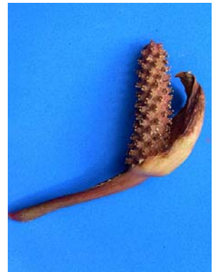
20 A. malyi