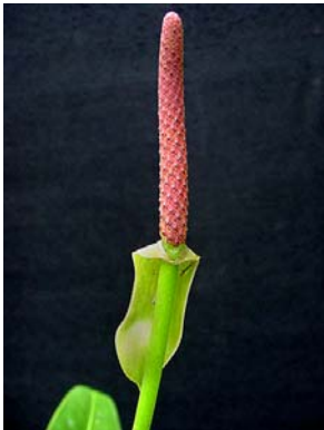
26 A. minarum