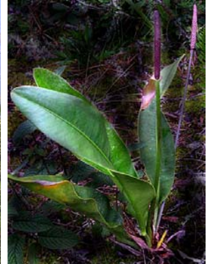
25 A. minarum