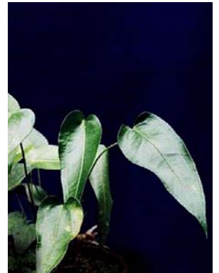
15 A. lhotzkyanum