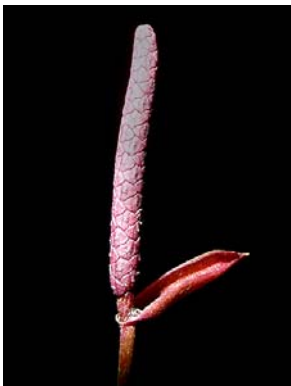
31 A. parvum