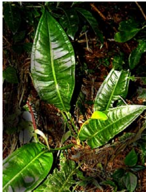
12 A. intermedium