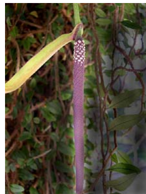
39 A. solitarium