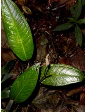
21 A. mareense

© Environmental & Conservation Programs, The Field Museum, Chicago, IL USA. [www.fmnh.org/plantguides] [rrc@fieldmuseum.org] Rapid Color Guide # 211 versão 1 09/2010