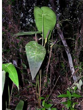
23 A. maximiliani