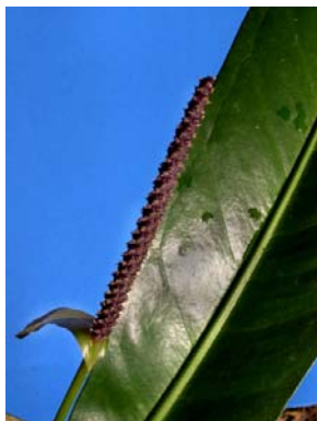
37 A. sellowianum