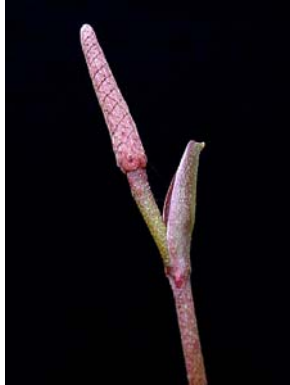
22 A. mareense