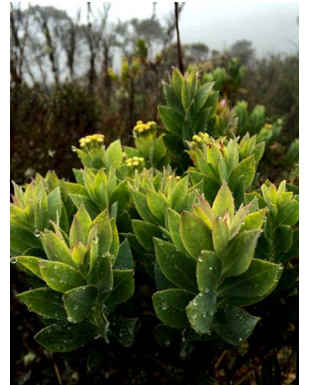
15 Pentacalia vaccinioides ASTERACEAE