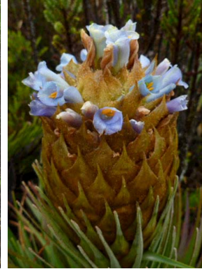
24 Puya santosii BROMELIACEAE (MC)