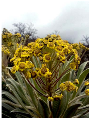
13 Espeletopsis corymbosa ASTERACEAE