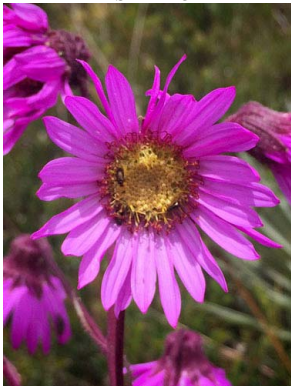
17 Senecio formosoides ASTERACEAE