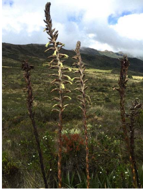
21 Puya nitida BROMELIACEAE

[fieldguides.fieldmuseum.org] [829] versión 1 11/2016