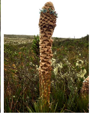
25 Puya trianae BROMELIACEAE