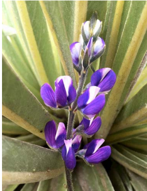
36 Lupinus bogotensis FABACEAE