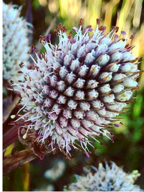
3 Eryngium humboldtii APIACEAE