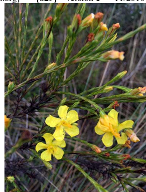
45 Hypericum strictum HYPERICACEAE