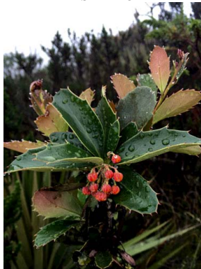
18 Berberis goudotii BERBERIDACEAE