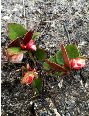
31 Gaultheria sclerophylla ERICACEAE