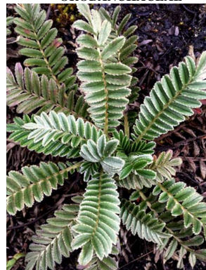
60 Acaena cylindristachya ROSACEAE