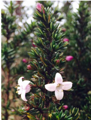
66 Arcytophyllum nitidum RUBIACEAE