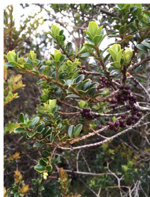
51 Myrsine dependens MYRSINACEAE