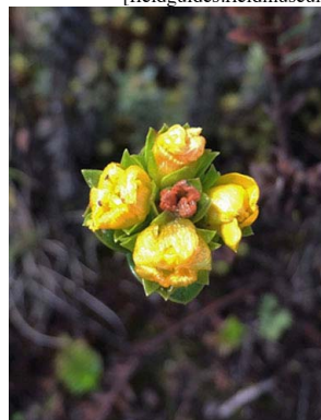
44 Hypericum mexicanum HYPERICACEAE