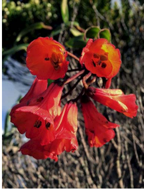
1 Bomarea crassifolia ALSTROEMERIACEAE

[fieldguides.fieldmuseum.org] [829] versión 1 11/2016