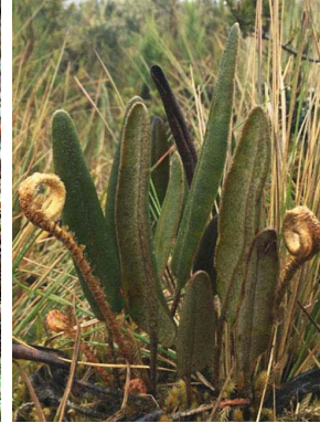
29 Elaphoglossum engelii DRYOPTERIDACEAE