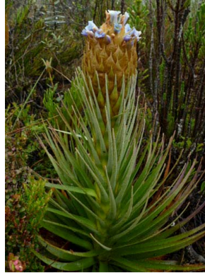
23 Puya santosii BROMELIACEAE (MC)