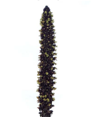
20 Puya goudotiana BROMELIACEAE