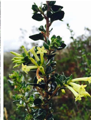
69 Cestrum buxifolium SOLANACEAE