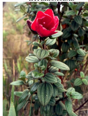
50 Tibouchina grossa MELASTOMATACEAE