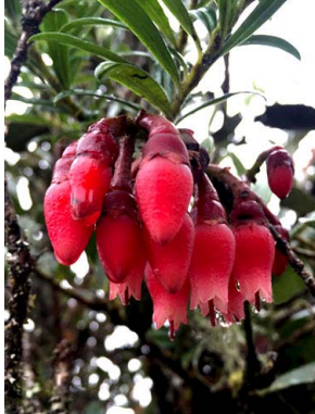
32 Macleania rupestris ERICACEAE