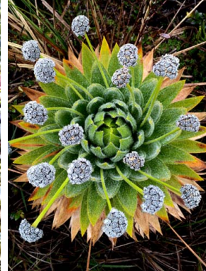
34 Paepalanthus columbiensis ERIOCAULACEAE