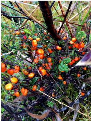
67 Galium hypocarpium RUBIACEAE