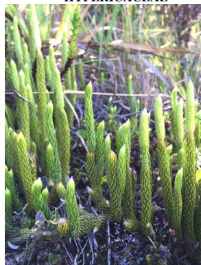
48 Lycopodium clavatum LYCOPODIACEAE