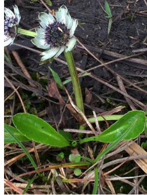
4 Eryngium humile APIACEAE