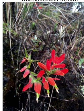
55 Castilleja integrifolia OROBANCHACEAE