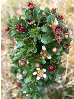
62 Hesperomeles obtusifolia ROSACEAE