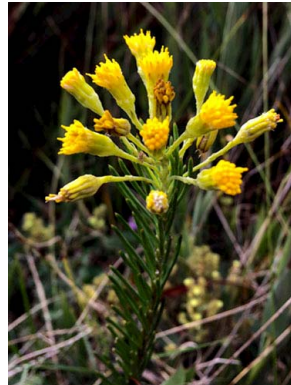
14 Pentacalia abietina ASTERACEAE