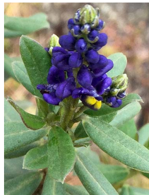
59 Monnina aestuans POLYGALACEAE