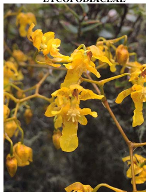
53 Cyrtochilum sp. ORCHIDACEAE