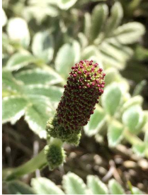
61 Acaena cylindristachya ROSACEAE

[fieldguides.fieldmuseum.org] [829] versión 1 11/2016