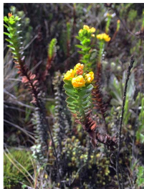
43 Hypericum mexicanum HYPERICACEAE