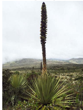
19 Puya goudotiana BROMELIACEAE