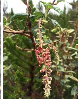
40 Ribes andicola GROSSULARIACEAE