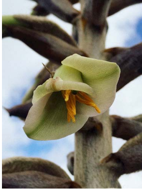
22 Puya nitida BROMELIACEAE