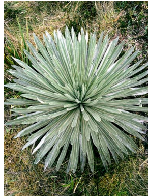
9 Espeletia argentea ASTERACEAE