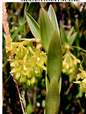
54 Epidendrum zipaquiranum ORCHIDACEAE