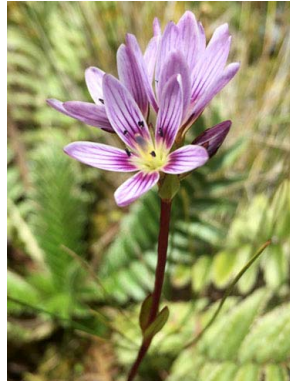
38 Gentianella sp. GENTIANACEAE