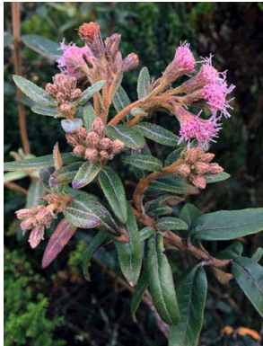
6 Ageratina gynoxoides ASTERACEAE