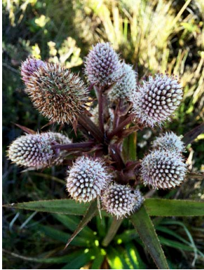
2 Eryngium humboldtii APIACEAE