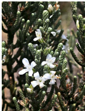
57 Aragoa cupressina PLANTAGINACEAE