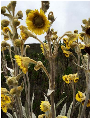
11 Espeletia grandiflora ASTERACEAE