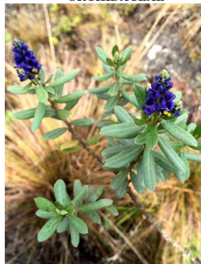
58 Monnina aestuans POLYGALACEAE