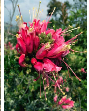
30 Bejaria resinosa ERICACEAE