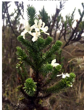
56 Aragoa abietina PLANTAGINACEAE