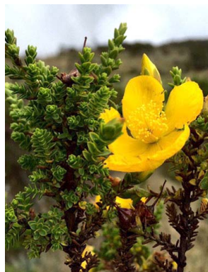
41 Hypericum goyanesii HYPERICACEAE

[fieldguides.fieldmuseum.org] [829] versión 1 11/2016