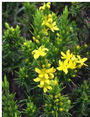
42 Hypericum juniperinum HYPERICACEAE