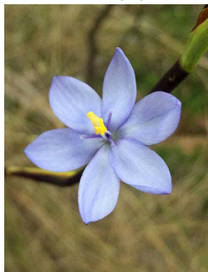
47 Orthrosanthus chimboracensis IRIDACEAE