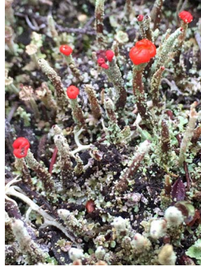
28 Cladonia andesita CLADONIACEAE