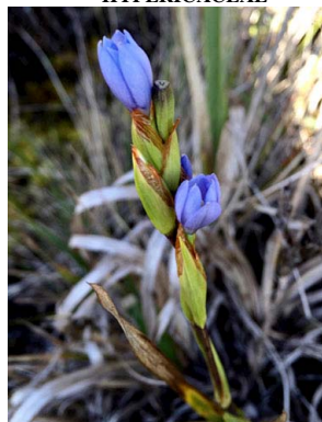
46 Orthrosanthus chimboracensis IRIDACEAE