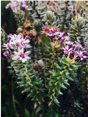
7 Diplostephium phyllicoides ASTERACEAE