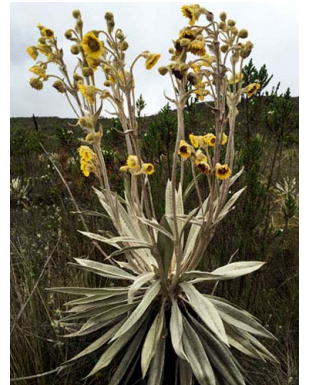
10 Espeletia grandiflora ASTERACEAE