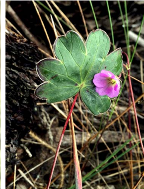
39 Geranium multiceps GERANIACEAE