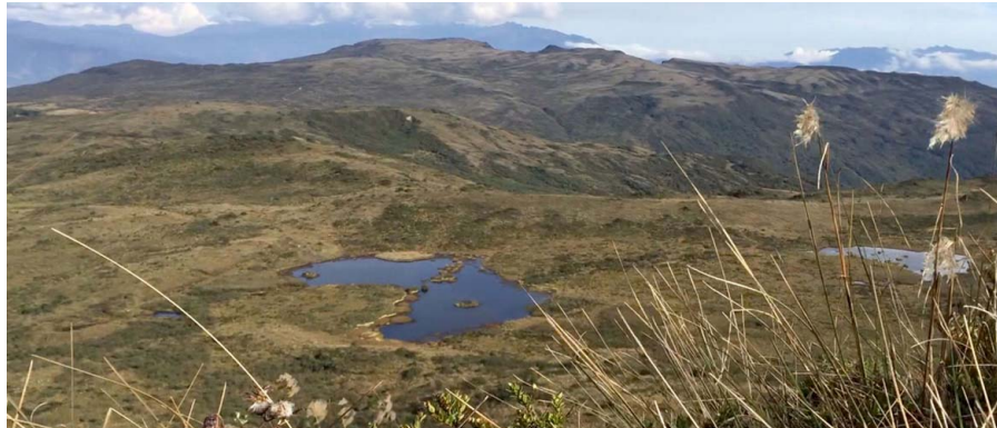
Laguna el Verjón