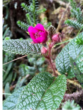
63 Rubus choachiensis ROSACEAE