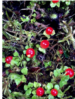
68 Nertera granadensis RUBIACEAE