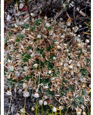
35 Paepalanthus karstenii ERIOCAULACEAE