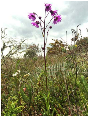
16 Senecio formosoides ASTERACEAE