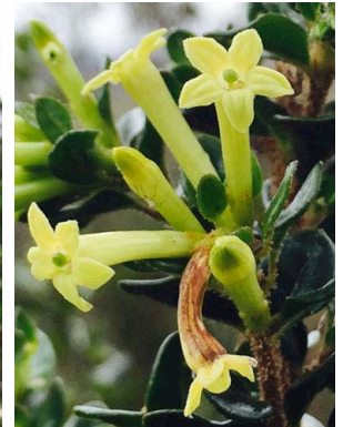
70 Cestrum buxifolium SOLANACEAE