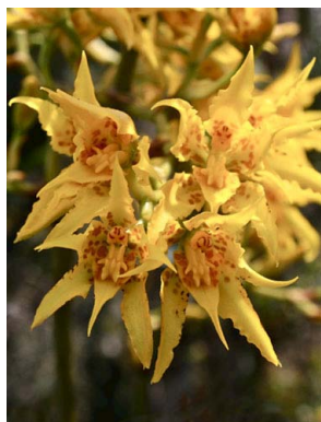
52 Cyrtochilum ramosissimum ORCHIDACEAE