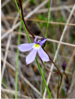
27 Lobelia tenera CAMPANULACEAE