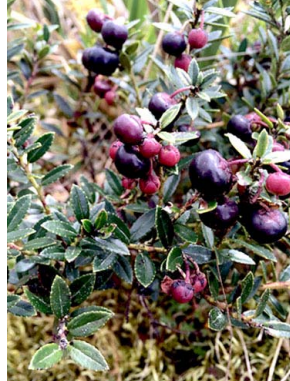
33 Vaccinium floribundum ERICACEAE