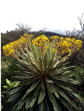
12 Espeletopsis corymbosa ASTERACEAE