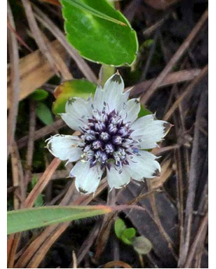
5 Eryngium humile APIACEAE