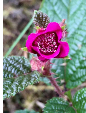
64 Rubus choachiensis ROSACEAE