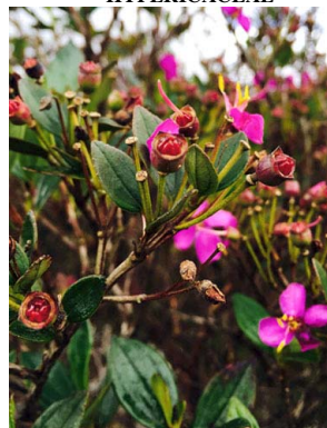
49 Bucquetia glutinosa MELASTOMATACEAE