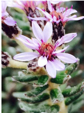
8 Diplostephium phyllicoides ASTERACEAE