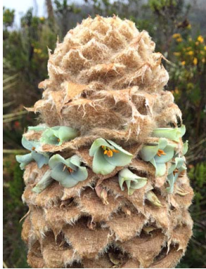
26 Puya trianae BROMELIACEAE