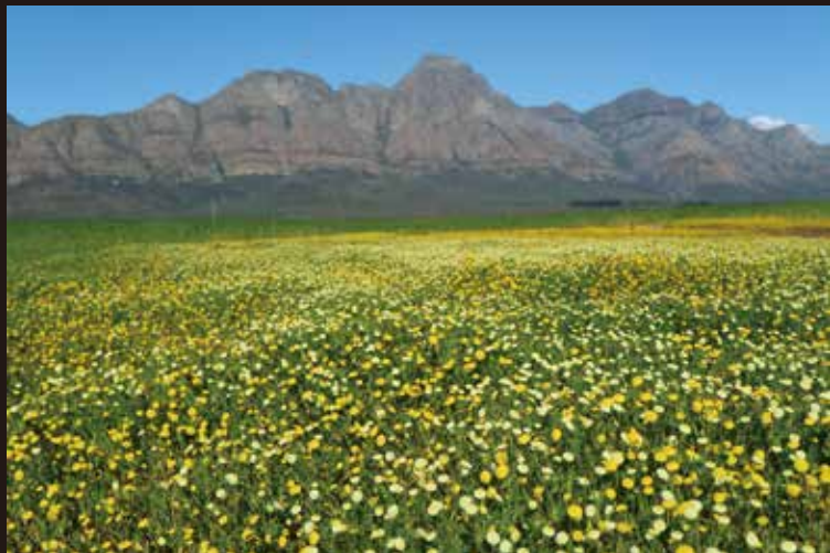
南アフリカの景観

特異な花色や草姿が魅力の「南アフリカの球根植物」のうち、春に開花するもの（モラエア、ラケナリア、ラペイロージア、ロムレア、アルブカ等）を中心に約30点展示します。