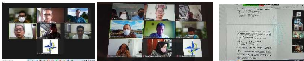
Gambar IV-1 Koordinasi dengan pejabat yang berwenang pada Dinas Kehutanan Provinsi Kalimantan Barat dan BPHP Wilayah VIII Pontianak serta KLHK RI

Berikut adalah dokumentasi kegiatan Remote Audit pada saat Resertifikasi PHPL PT HKI.