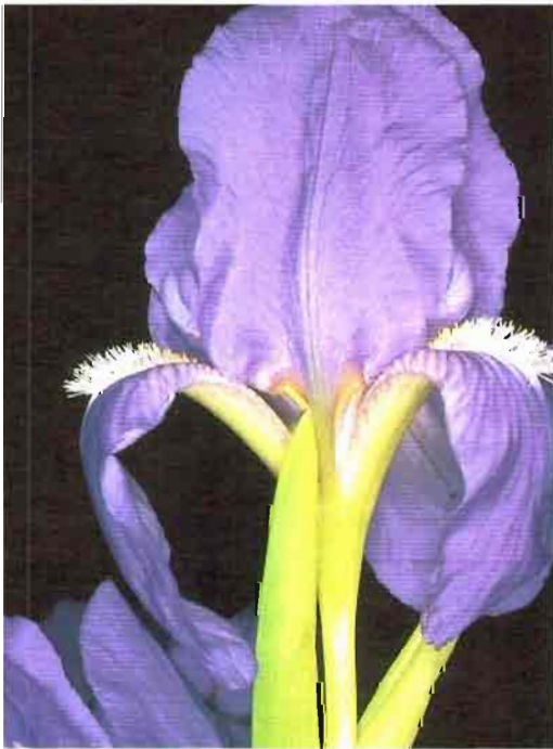
59. Iris subbiflora Brot.