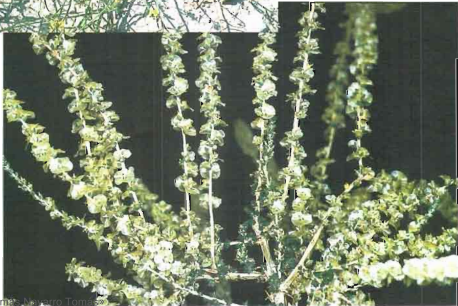
26. Salsola vermiculata L.