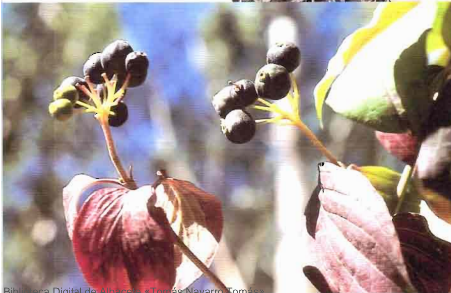
23. Cornus sanguinea L. subsp. sanguinea