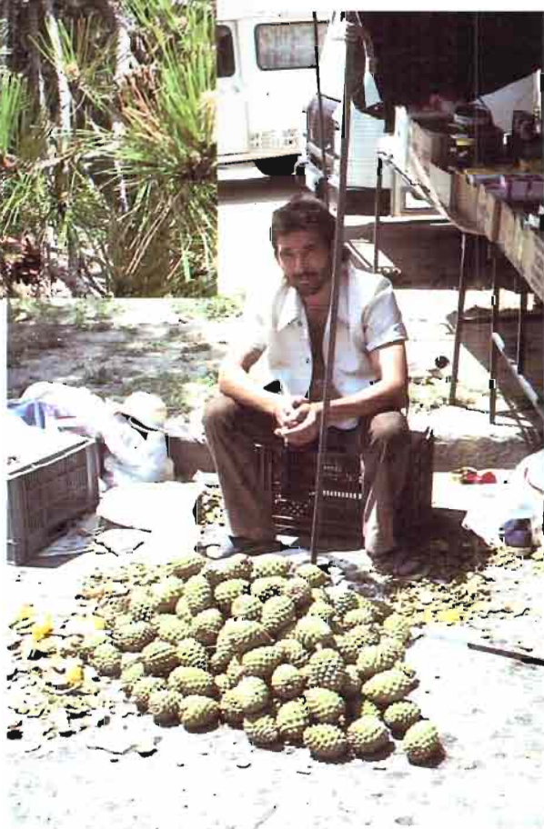
3. Pinus pinea L.