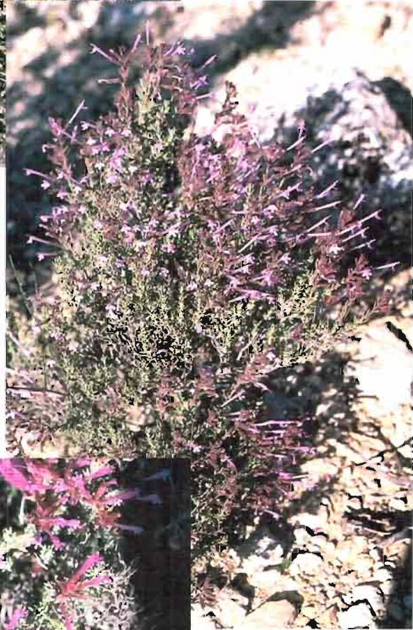
37. Thymus antoninae Rouy & Coincy