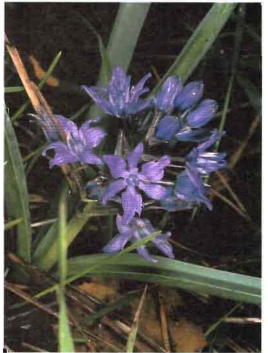
60. Scilla paui Lacaita