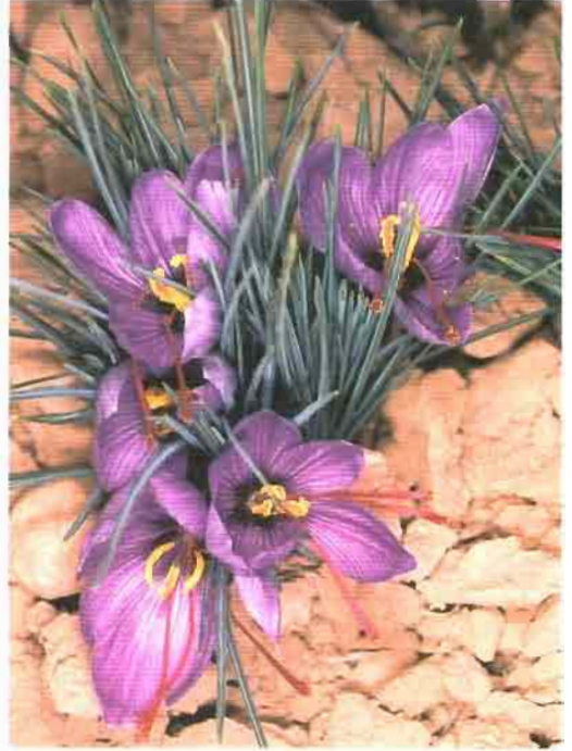
58. Crocus sativus L.