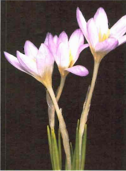
57. Crocus nevadensis Amo