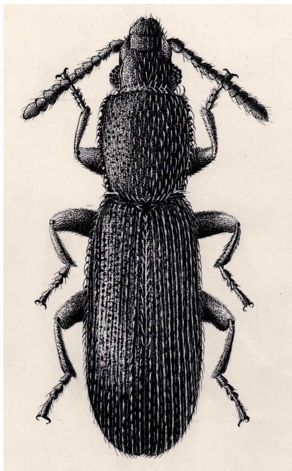
Fig. 1. Airaphilus "nasutus" di Flumini (Sardegna). Lunghezza del corpo: 3 mm (disegno di G. D'Este) (da Ratti 2007a).

DATI DI LETTERATURA. Sardegna (Bertolini 1904; Porta 1929; Angelini et al. 1995). Sardegna meridionale (Luigioni 1929). Cagliari prov.: Flumini (Ratti 2007a); presso Quartu [Sant'Elena] (Lostia 1887); Quartu Sant'Elena (Ratti 2007a). Nuoro prov.: Sorgono (Krausse 1913).