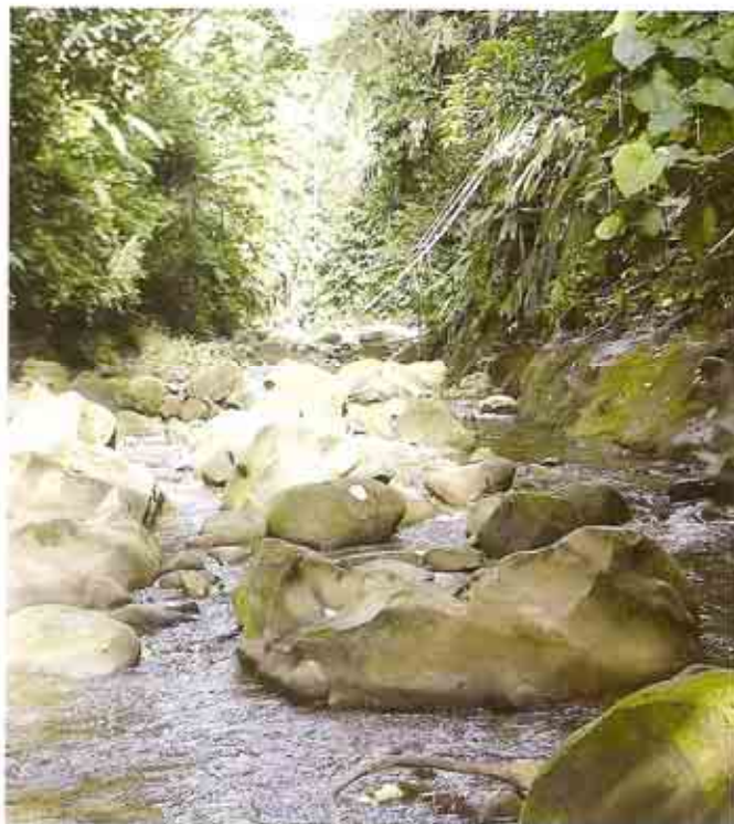
Río en época de verano de la Reserva. Foto: RESERVA ECOLÓGICA MACHE-CHINDUL (2006).

a las poblaciones en la zona de amortiguamiento (Alianza REMACH/MAE 2005).