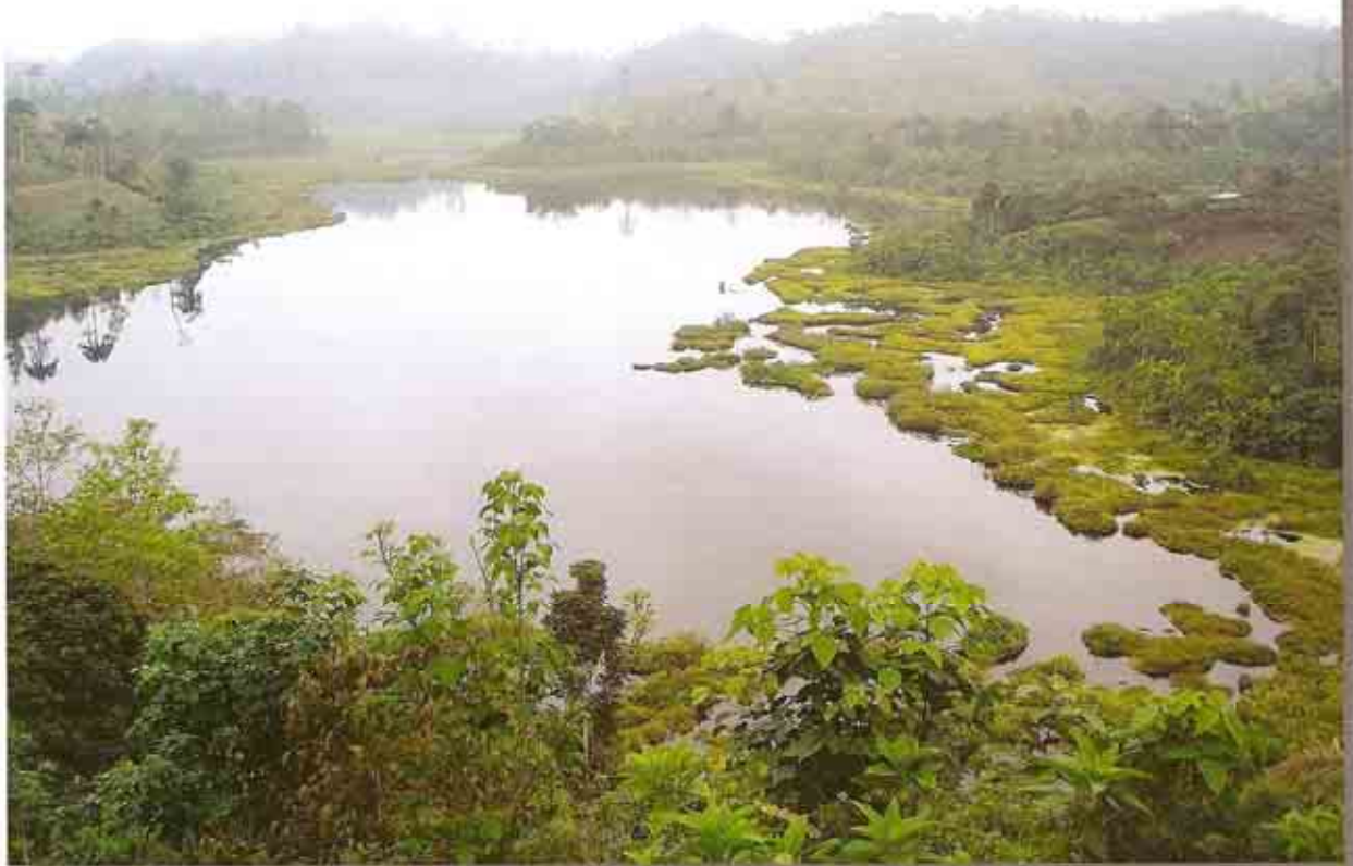
Laguna de Cube.

La Reserva Ecológica Mache-Chindul (REMACH) protege uno de los últimos remanentes de bosque húmedo y seco tropical de la costa ecuatoriana, y tal vez del mundo; caracterizado por su alta biodiversidad y los sorprendentes niveles de endemismo, se considera a la zona como un hotspot . Aunque el área está físicamente