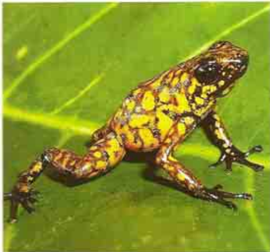
La rana diablito ( Oophaga sylvatica ) presenta diferentes tipos de coloración (polimorfismo).

En lo que respecta a reptiles, se han registrado 38 especies (incluidos en 28 géneros y 16 familias), destacando en términos de abundancia y diversidad la familia Iguanidae. A nivel de géneros, los Anolis , Lepidoblepharis y Ameiva son los más importantes (Alianza REMACH/MAE 2005).