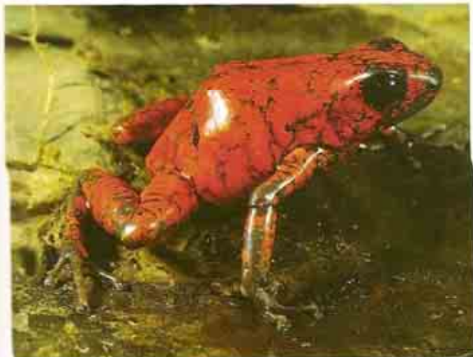
Rana diablito.