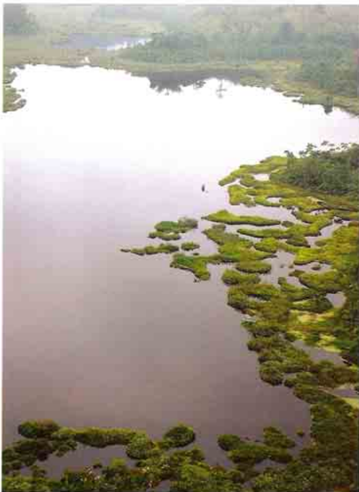
Laguna de Cube.

Un último trayecto de acceso es por San José de Chamanga, al sur del área, navegando desde Pedernales. Esta vía conduce a la comunidad Chachi de Balzar.