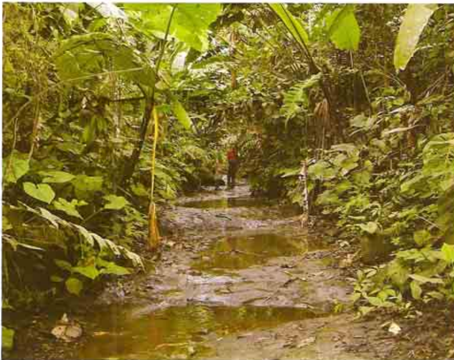
Sendero dentro del bosque de la Reserva. Foto: Reserva Ecológica Mache-Chindul (2006).

Hoy en día, el único remanente continuo de bosque natural de la Reserva se encuentra dentro del territorio chachi. Lamentablemente, este bosque, es el blanco de invasores que amenazan tanto la integridad ecológica del bosque, como la soberanía de la nacionalidad chachi sobre su territorio, poniendo en riesgo la existencia de la mencionada cultura (Alianza REMACH/MAE 2005).