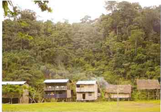
Comunidad Chachi en Chorrera Grande, Esmeraldas.

Según el último Plan de Manejo de la REMACH (2005) existen 6466 habitantes dentro de la Reserva entre afroesmeraldeños, chachis y colonos. Todo el territorio de la REMACH se encuentra en propiedad privada, bajo diferentes tipos de posesión. El problema radica en que la Reserva fue establecida con un gran número de centros poblados que se encontraban ya al interior de la misma, y otros en proceso de consolidación. En consecuencia, y con el pasar del tiempo, hubo una progresiva ampliación de la frontera agrícola, disminución de la productividad