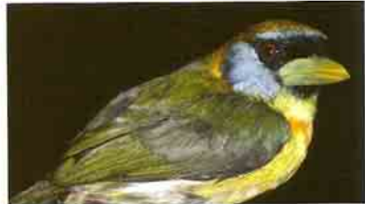
Barbudo cabecirrojo.