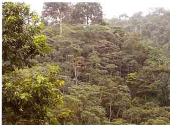
Bosques siempreverdes húmedos.

El bosque siempreverde húmedo de tierras bajas se ubica en la parte norte de la Cordillera de Mache Chindul, por debajo de los 300 msnm. Cubre una amplia franja que va desde la línea de costa en