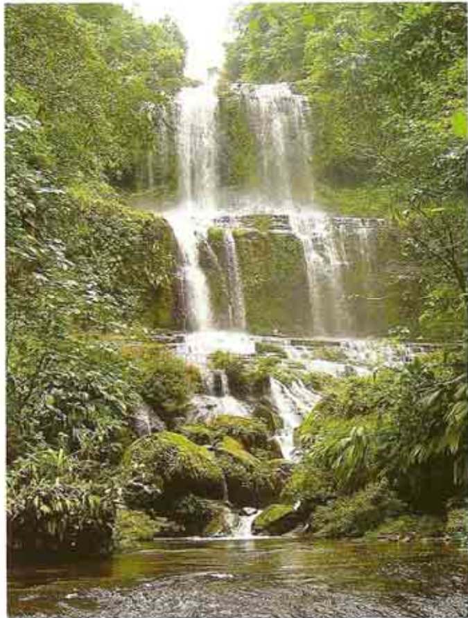
Cascadas naturales.