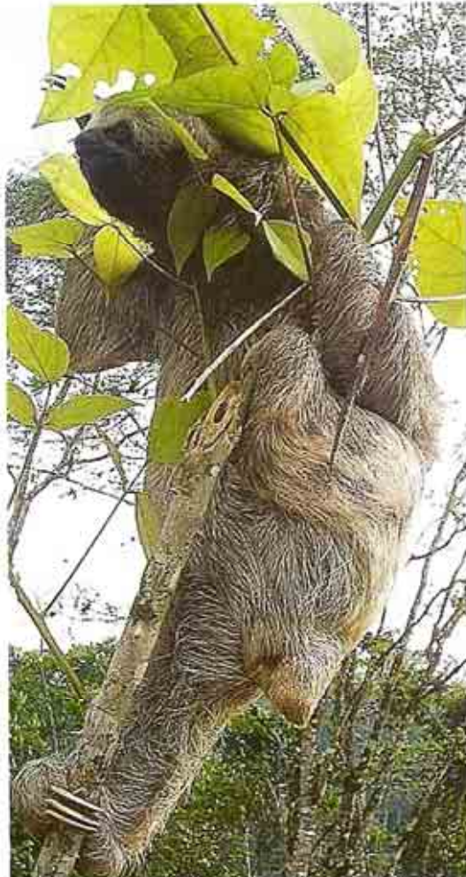
Oso perezoso.

CR: EN PELIGRO CRÍTICO; EN: EN PELIGRO; VU: VULNERABLE; LC: PREOCUPACIÓN MENOR; NT: CASI AMENAZADO; DD: DATOS INSUFICIENTES. FUENTES: UICN 2006; ALIANZA REMACH/MAE 2005; TRIM 2001.